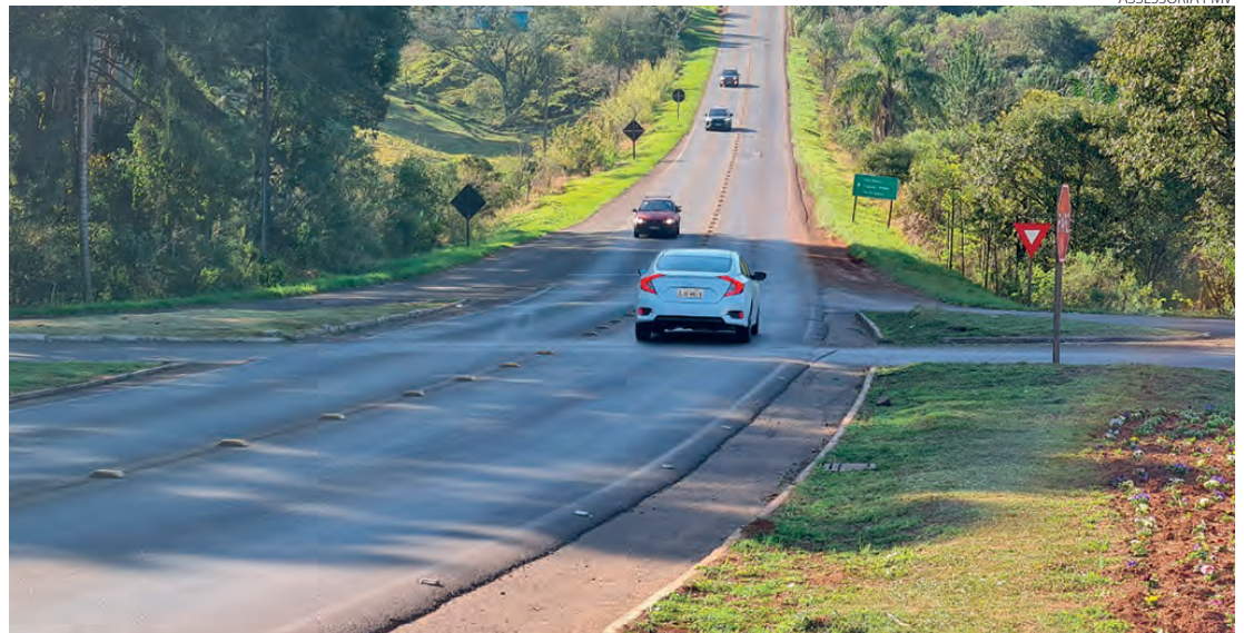
De de 2021 até agora, foram registrados três óbitos por acidentes no trevo que será instalado o dispositivo