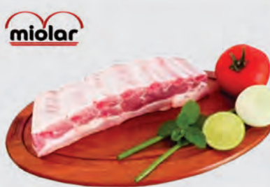
Costela Suína Miolar Temperada Kg