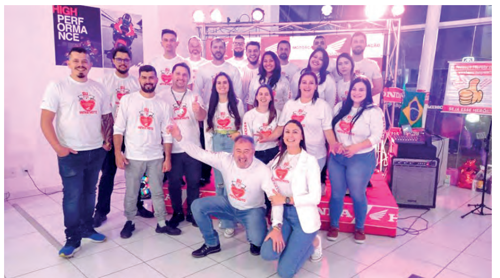
Em comemoração ao Dia do Motociclista, a Motoação realizou na quarta-feira (27) uma programação especial. As ações que começaram nas primeiras horas da manhã se estenderam até o início da noite, quando foi realizada uma motociata e bênção dos condutores. Durante todo o dia foi realizado check list das motocicletas com arrecadação de alimentos, que serão destinados a entidades beneficentes, e panfletagem com equipe do Hemonúcleo.