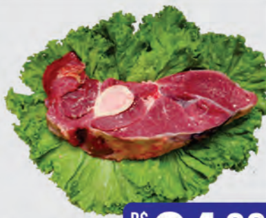
Paleta c/ Osso Bovina Kg