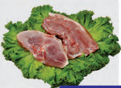
Pernil e Paleta Suína c/ Pele Kg