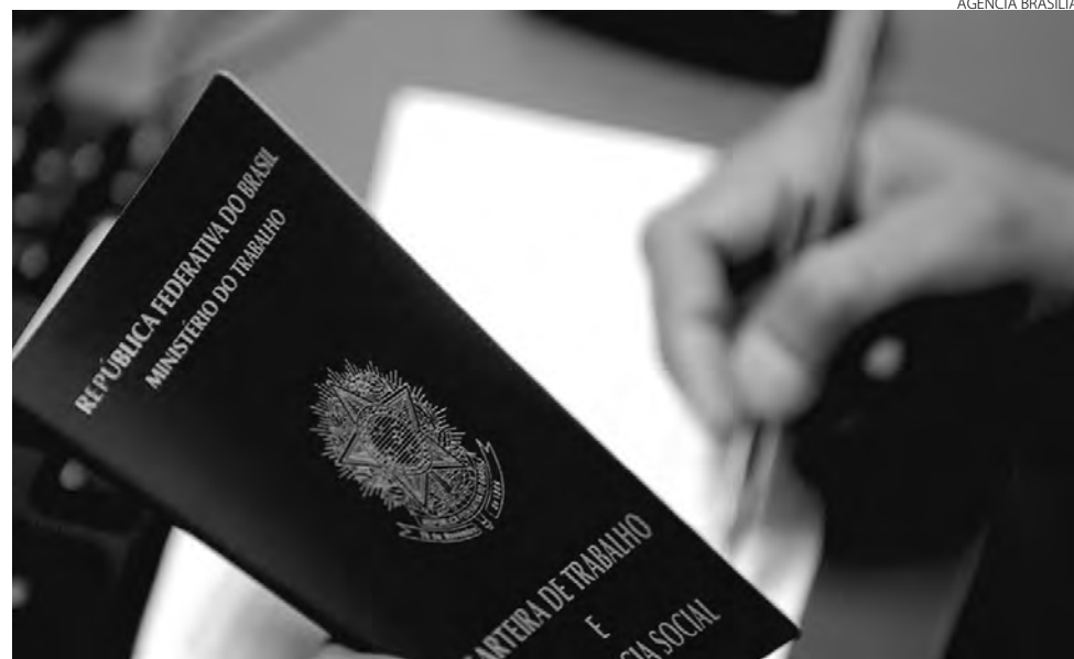
Apenas 14 municípios do Sudoeste tiveram desempenho melhor na geração de emprego no primeiro semestre, comparando com o mesmo período de 2021

Na outra ponta do desempenho regional, houveram municípios que não apenas