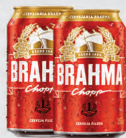
Cerveja Brahma Chopp 350ml