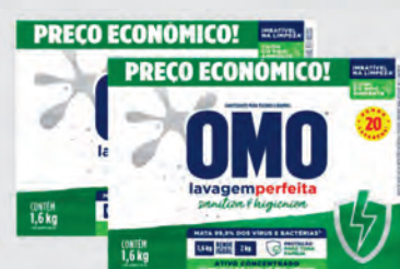
Sanitizante Pó Omo Lavagem Perfeita 1,6Kg