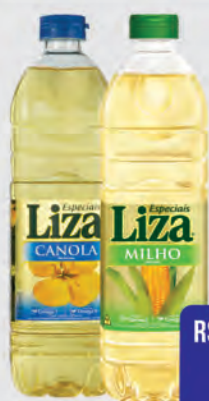
Óleo de Canola ou Milho Liza 900ml