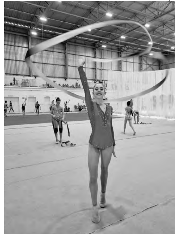
A competição serve de preparação das ginastas para outros campeonatos