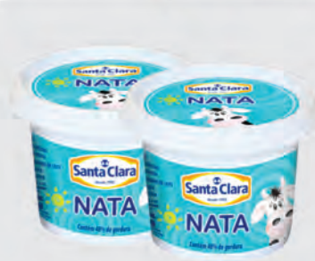
Nata Santa Clara 300g