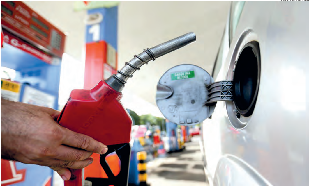
Mesmo com queda no preço da gasolina, consumidor ainda sente no bolso cada vez que encosta na bomba para abastecer