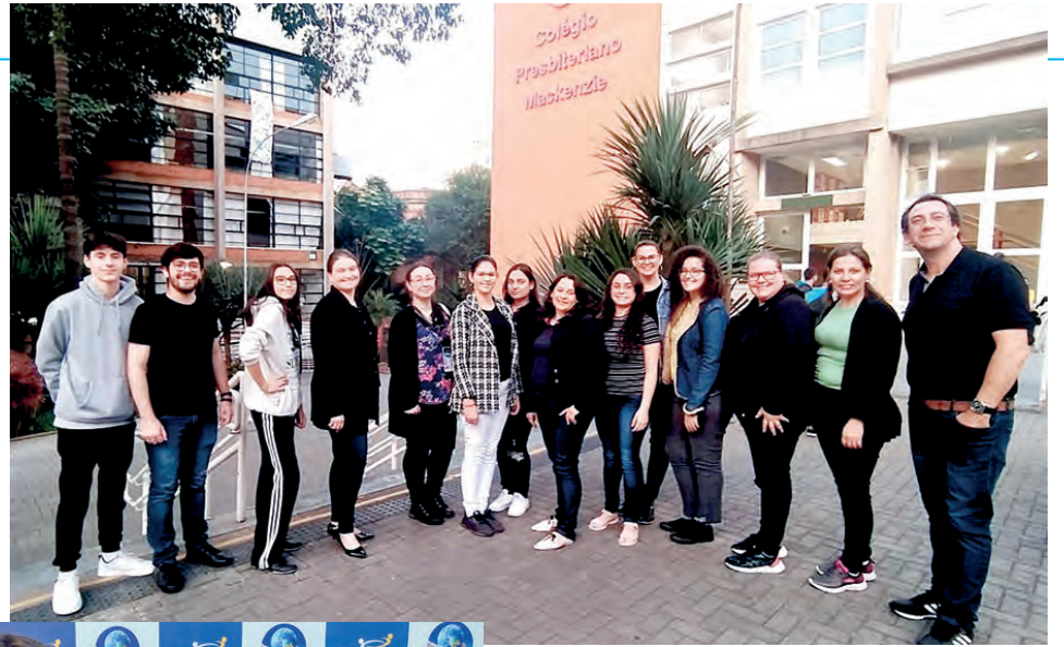
Parte da equipe da Escola Crescer em treinamento na Universidade Mackenzie em São Paulo