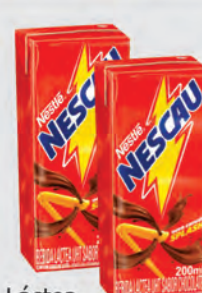
Bebida Láctea Achocolatada Tradicional Nescau 200ml