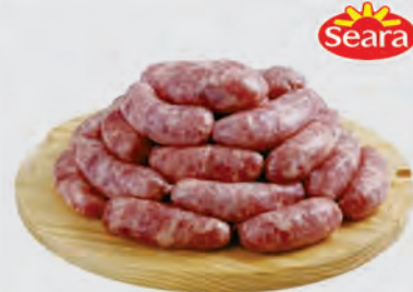
Linguíça Toscana Suína Seara Kg