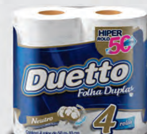
Papel Higiênico Duetto c/ 4 Rolos 30m