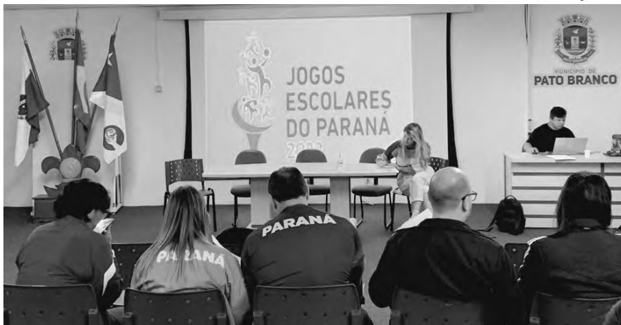
O Congresso Técnico dos JEPs foi realizado na última quarta-feira