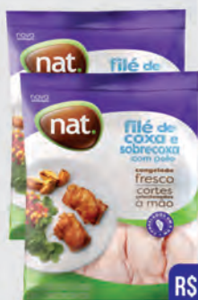
Filé de Coxa e Sobrecoxa Frango Nat 1Kg