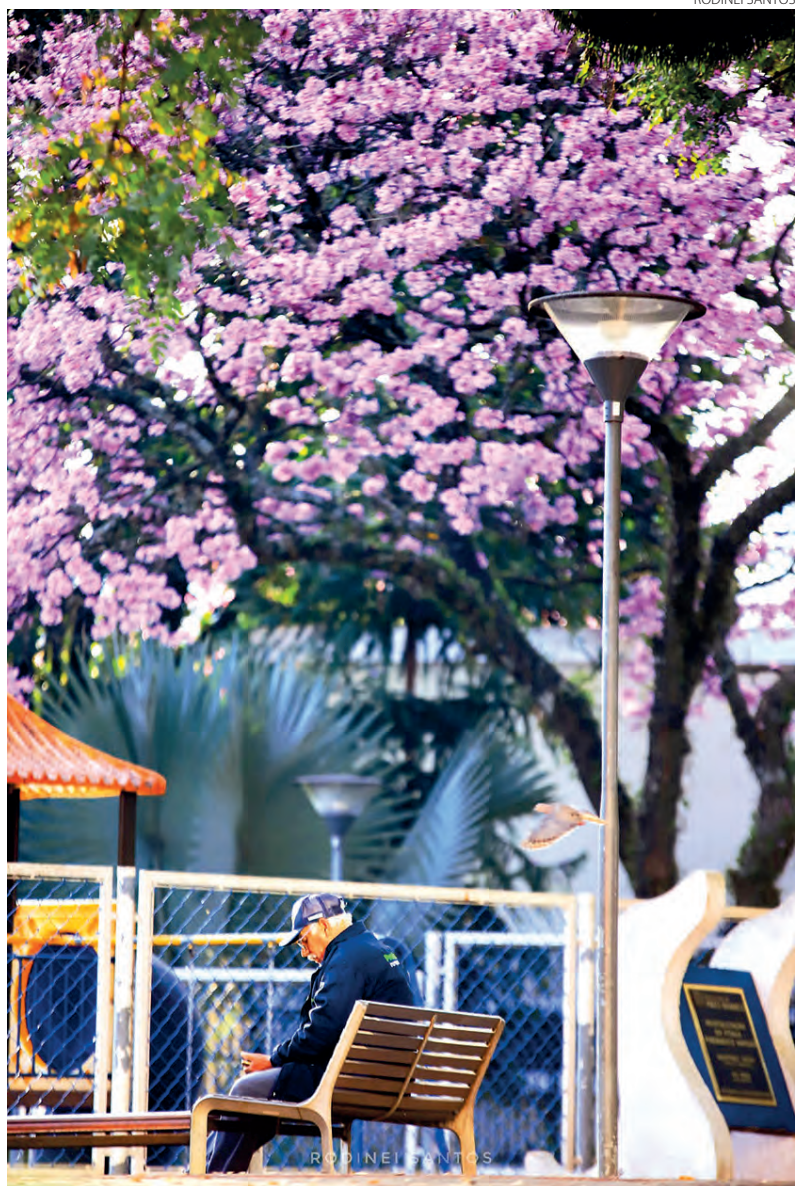
Registro feito na manhã de quinta-feira (28), em Pato Branco. Inverno com flores, colorido e temperaturas de primavera.