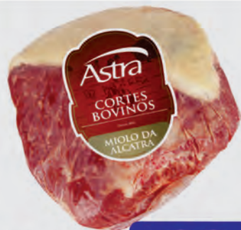
Miolo da Alcatra Bovina Astra Kg