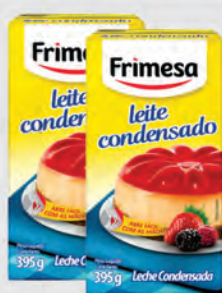
Leite Condensado Frimesa 395g