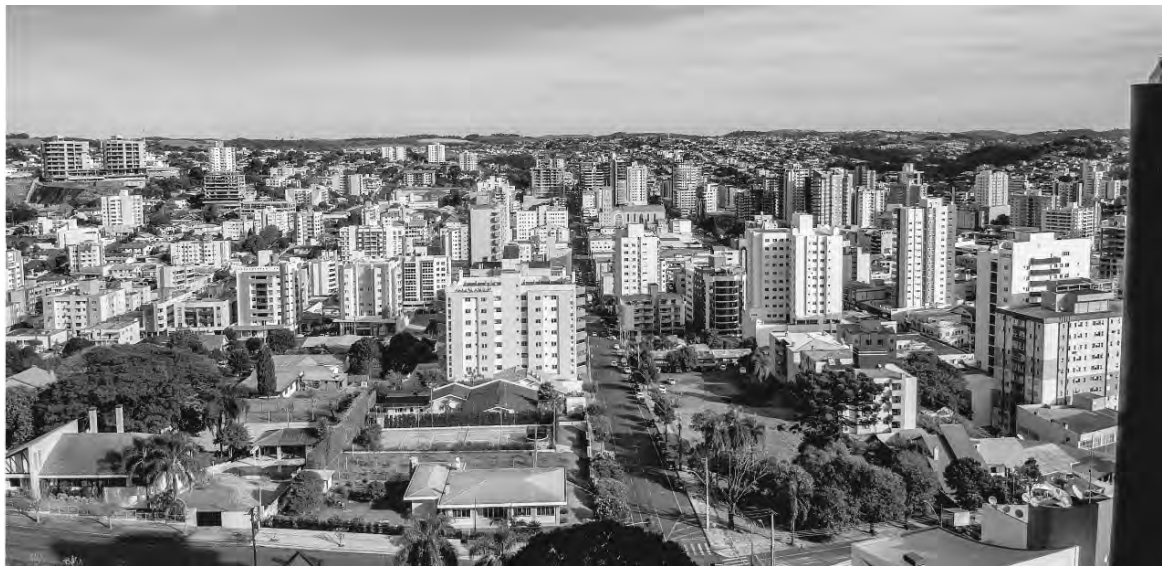
Assembleia aconteceria nesta sexta-feira (29)

convocação estão ainda a suposta falta de documentos fiscais na sede da AFM, bem como a não localização do livro ata e documentos contábeis, que deveriam estar acessíveis para a consulta de associados.