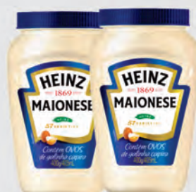
Maionese Tradicional Heinz 400g