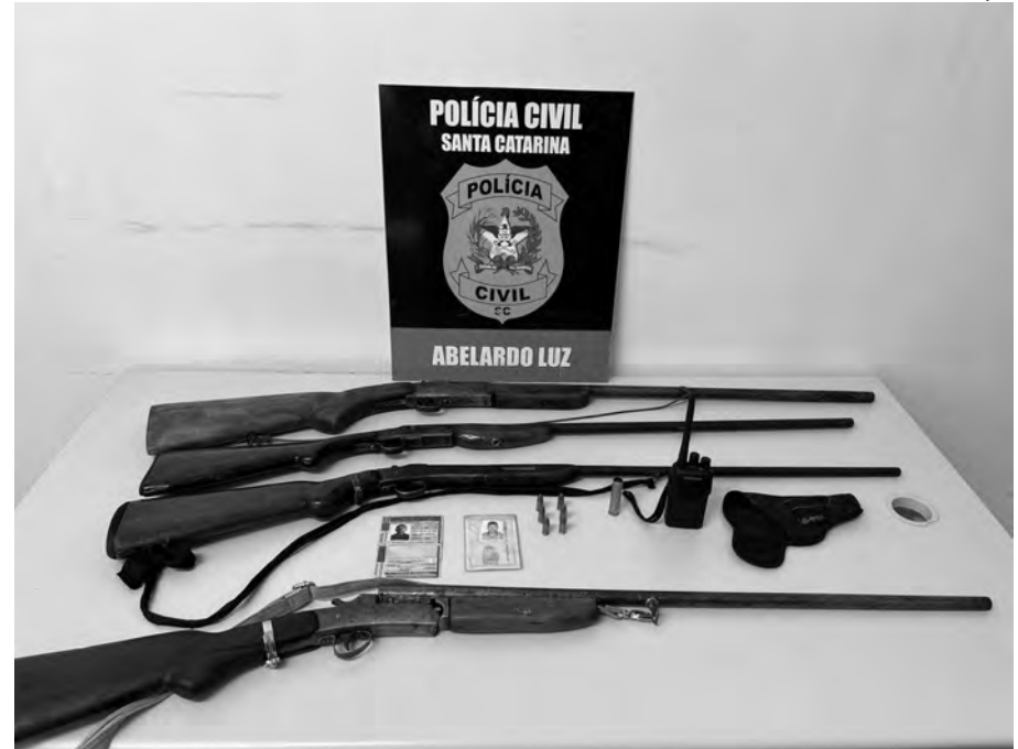
As armas e os documentos falsos foram apreendidos durante a ação policial