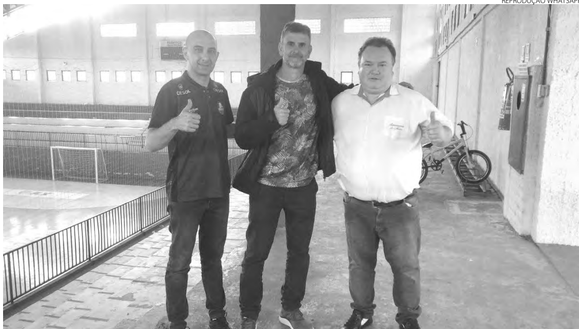
Lavardinha esteve com dirigentes do Marreco e deverá ser apresentado nesta quinta-feira