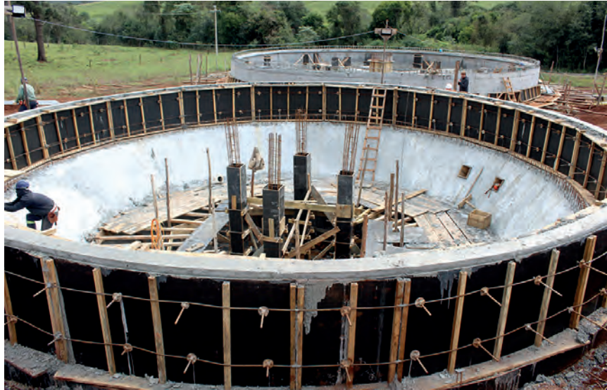
Obra da estação de tratamento de esgoto está em estágio avançado