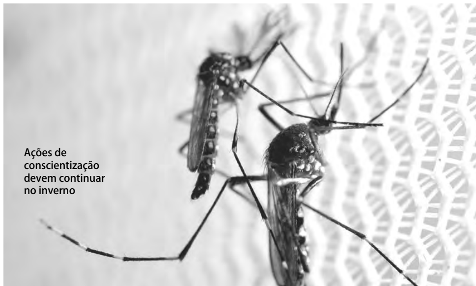
Ações de conscientização devem continuar no inverno

Nelson da Luz Junior nelson@diariosudoeste.com.br