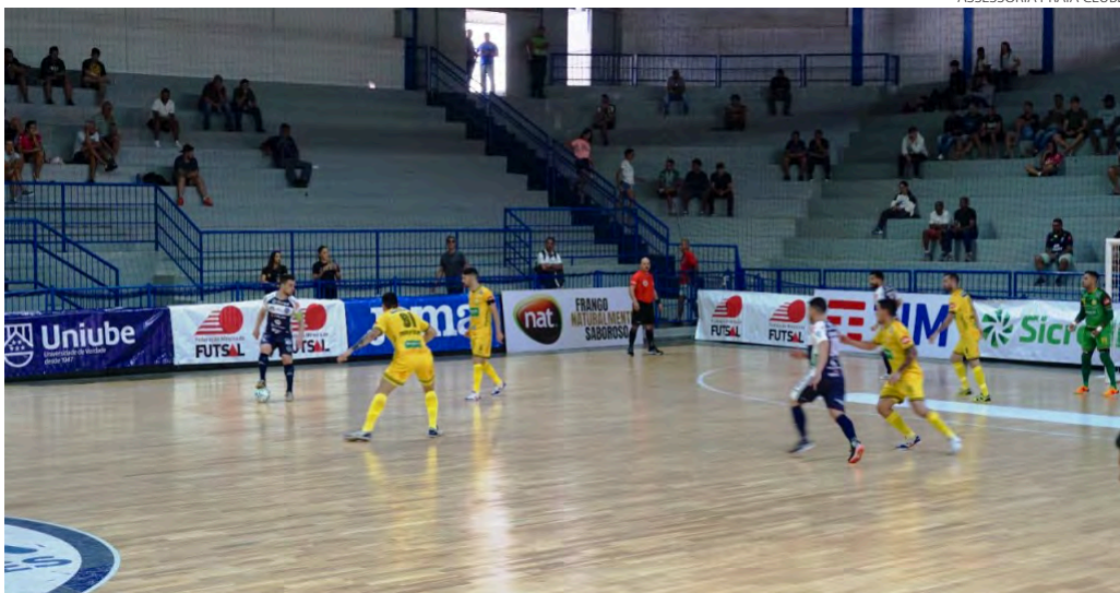
ASSESSORIA PRAIA CLUBE

O Pato Futsal volta a enfrentar o Praia Clube, desta vez pela Liga Nacional