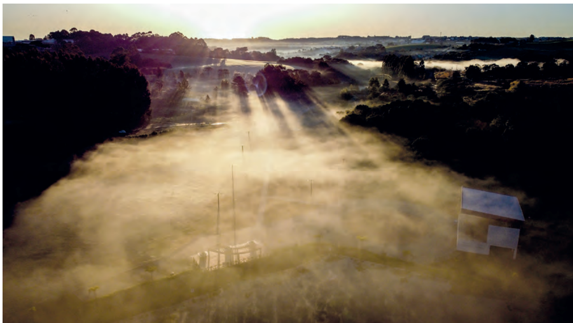
Registro panorâmico da geada na manhã de quinta-feira (30), em Pato Branco, fechando o mês de junho e anunciando um inverno gelado.