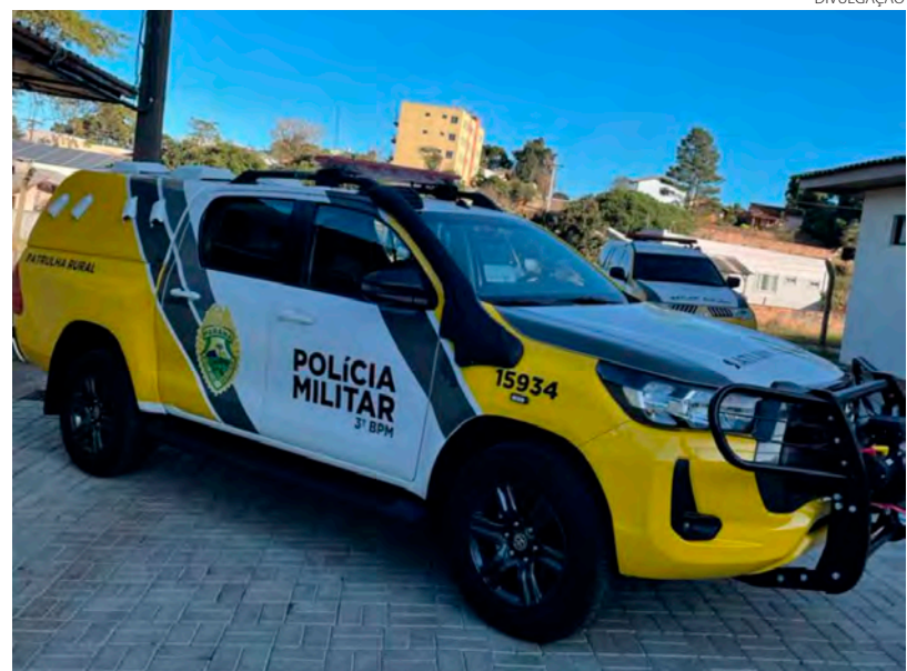
A cerimônia de entrega da nova viatura foi realizada quinta-feira