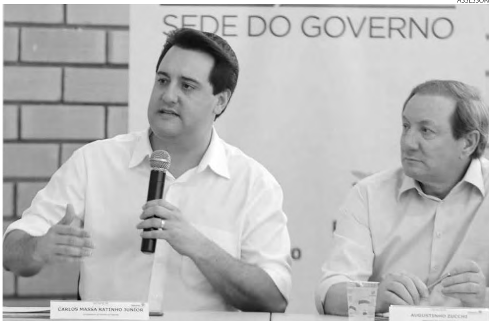
A autorização do edital de licitação para a compra de veículos e equipamentos ocorreu na manhã de sexta-feira (1º)

O valor autorizado pelo secretário está distribuído em seis lotes. Lote 01 - Aquisição de Equipamentos Rodoviários sendo: seis caminhões chassis 6x4, Fabricação/Modelo 2022/2022 (novo, zero km), potência mínima de 300 CV e demais características técnicas constantes no Modelo 07.