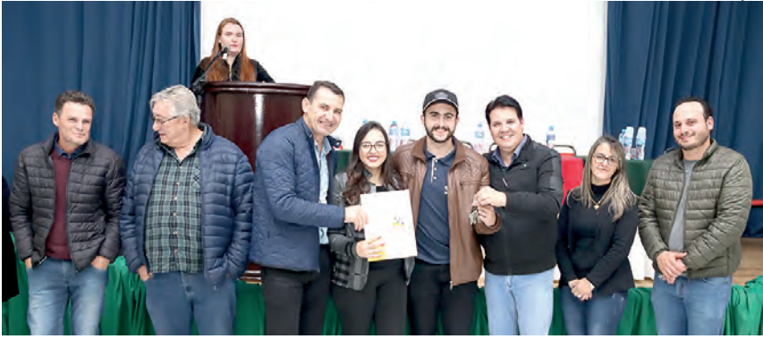
Secretaria trabalhar com os mutuários temáticas ligadas ao pertencimento do imóvel

Eles passam a residir no conjunto Morar Melhor II, em Coronel Vivida