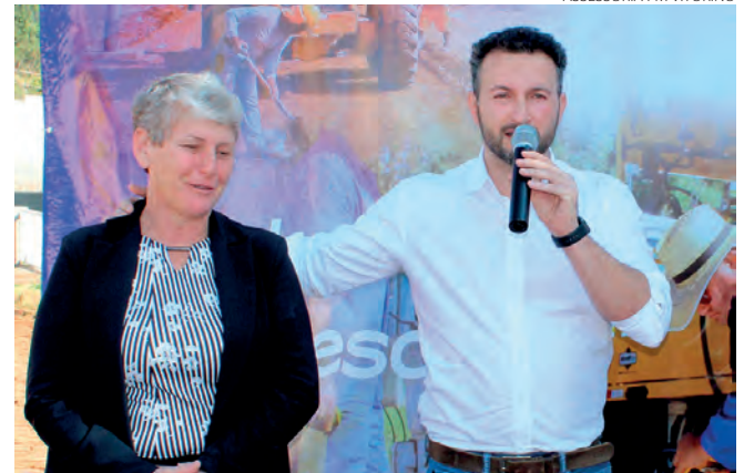
Com o pacote assinado, serão pavimentadas sete ruas de Vitorino