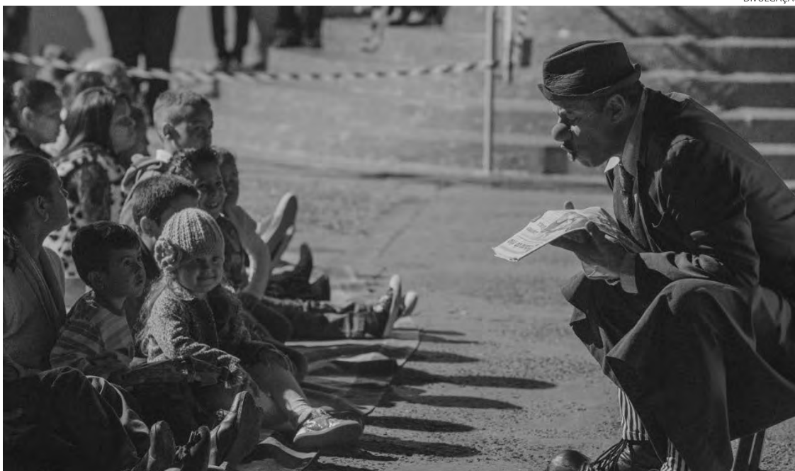
O espetáculo inicia às 19h

Com entrada franca. Ingressos devem ser retirados no teatro a partir de 30 minutos antes do início do show. O pedido é de contribuição com 1kg de alimento não perecível, uma caixa de leite ou um livro). Informações: (46) 3220 5524 ou (46) 9 8801 2273 (WhatsApp).