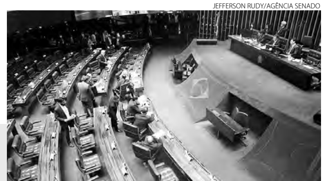
A proposta segue para votação na Câmara dos Deputados

Todas as medidas têm duração prevista até o final do ano de 2022.