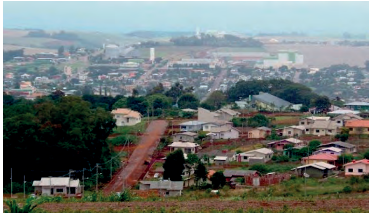
São João tem mais de 10,5 mil habitantes

Segundo ele, ainda este ano deve ser lançado em São João um novo programa para dar suporte às pequenas propriedades leiteiras. “Hoje em São João, 90% das áreas, são de pequenas propriedades”, contextualiza apontando que mesmo o complexo produtivo de soja, milho, trigo, sendo muito for-