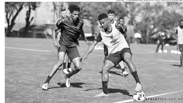
Dois sessões de treinos foram dedicadas à partida contra o Botafogo