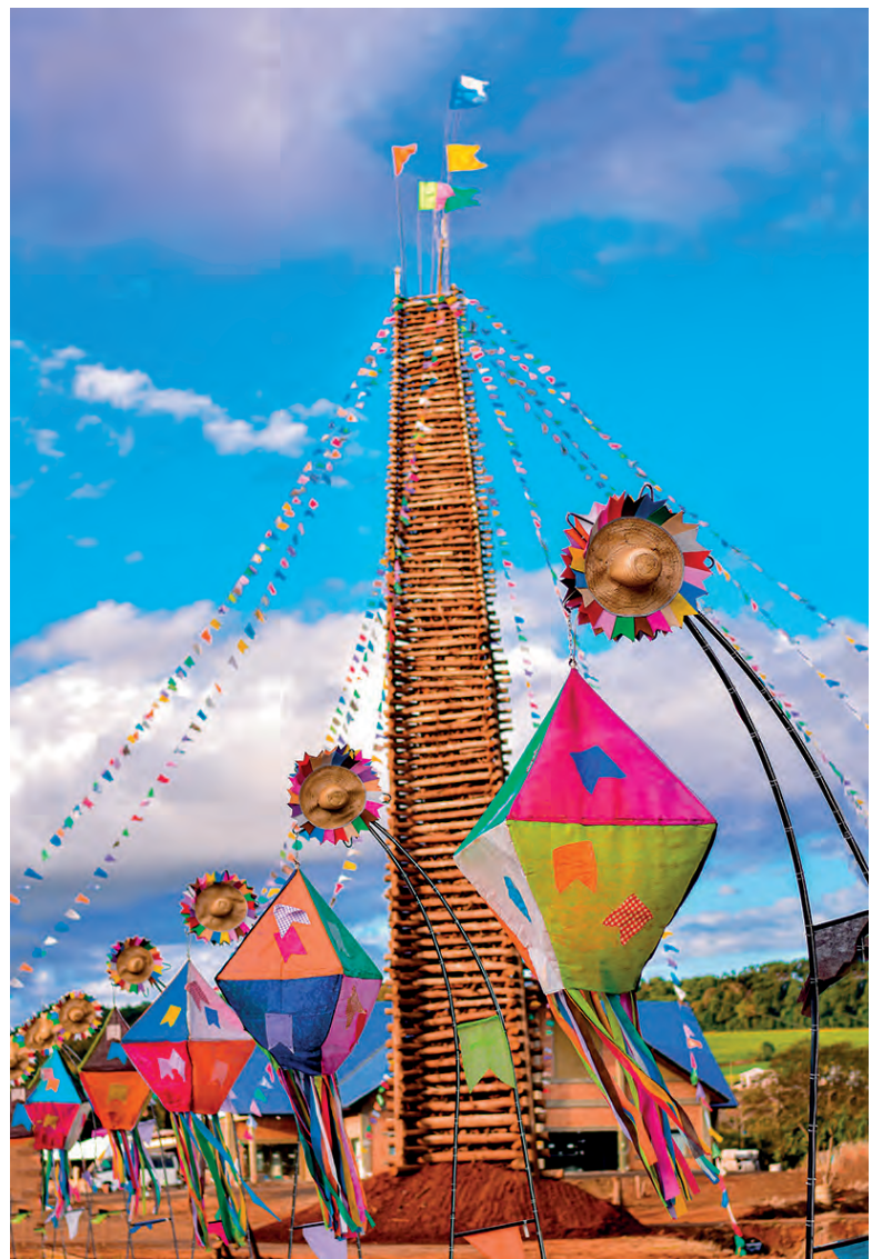
As primeiras festas, na praça da Matriz tinha apresentações de quadrinha, declamações de poemas e trovas