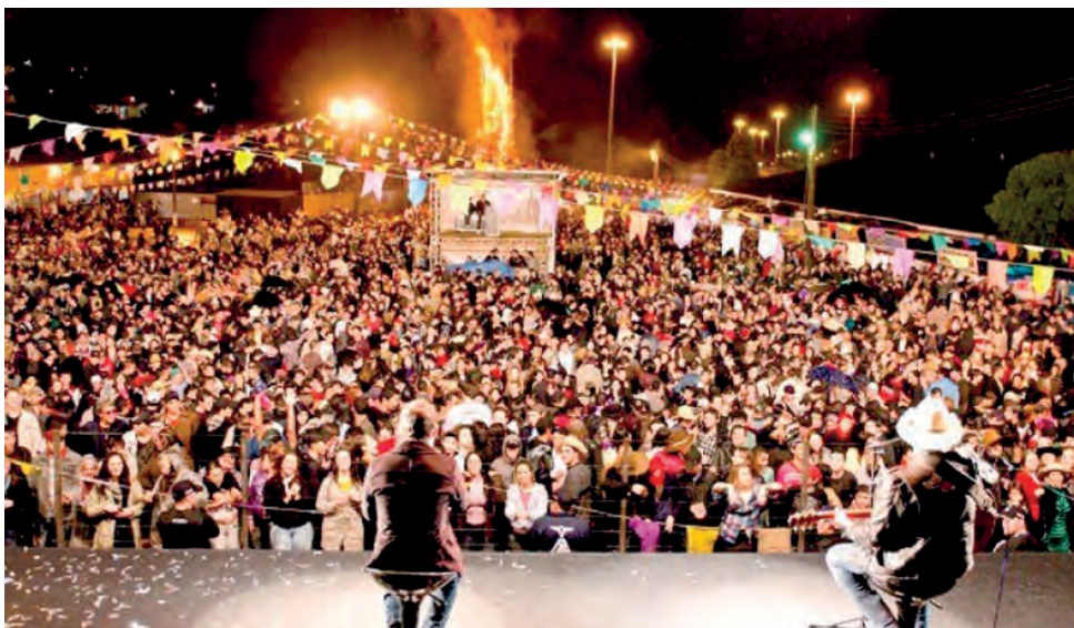
O município é reconhecido como o detentor da maior fogueira junina do Brasil

Os primeiros registros de fé no território do município são anteriores a sua criação