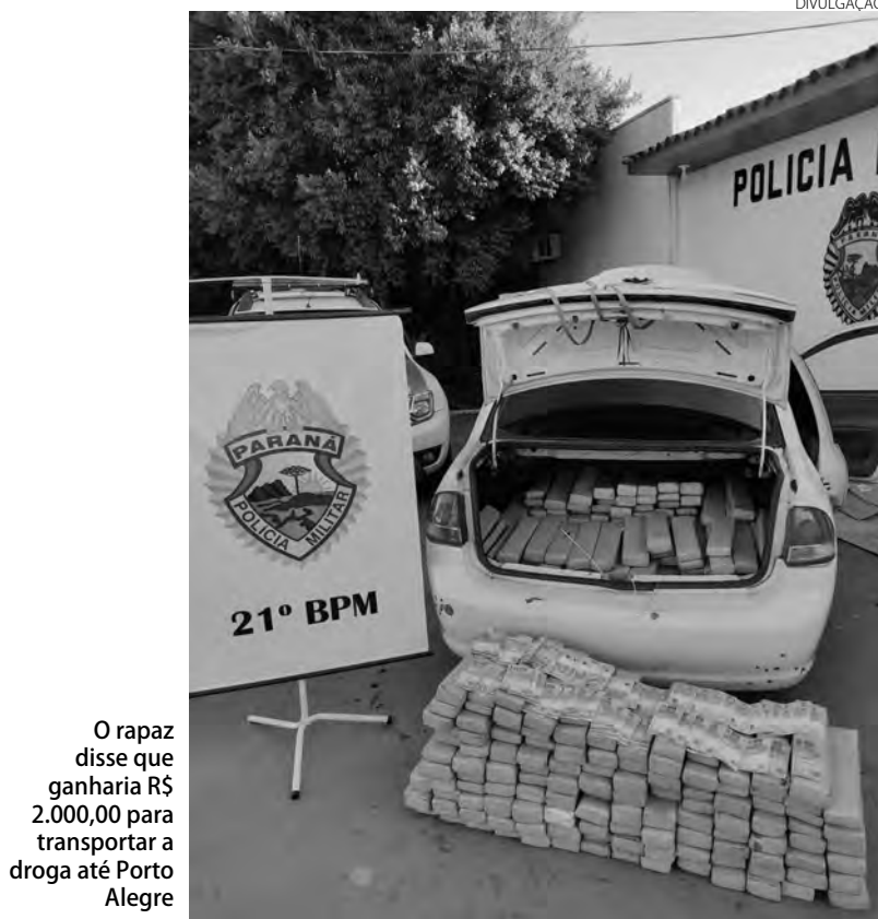
O rapaz disse que ganharia R$ 2.000,00 para transportar a droga até Porto Alegre

Os veículos estavam carregados com cigarros contrabandeados do Paraguai, totalizando 5.000 pacotes. Os carros, o detido e os cigarros foram encaminhados à Delegacia da Polícia Federal de Foz do Iguaçu.