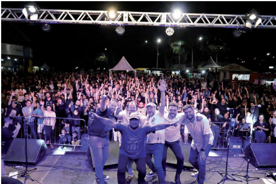
Com 30 anos de banda, a Chumbo Dirigível se apresenta no Rock The Concert neste sábado

Evento reúne quatro bandas locais e a Orquestra Filarmônica de Valinhos