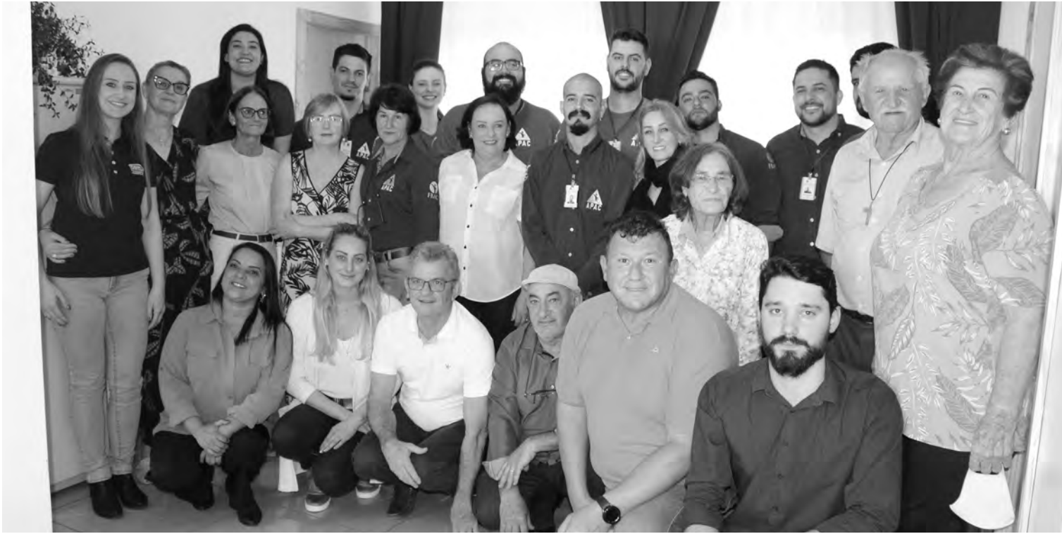
Colaboradores, voluntários, representantes de empresas e parceiros da Apac