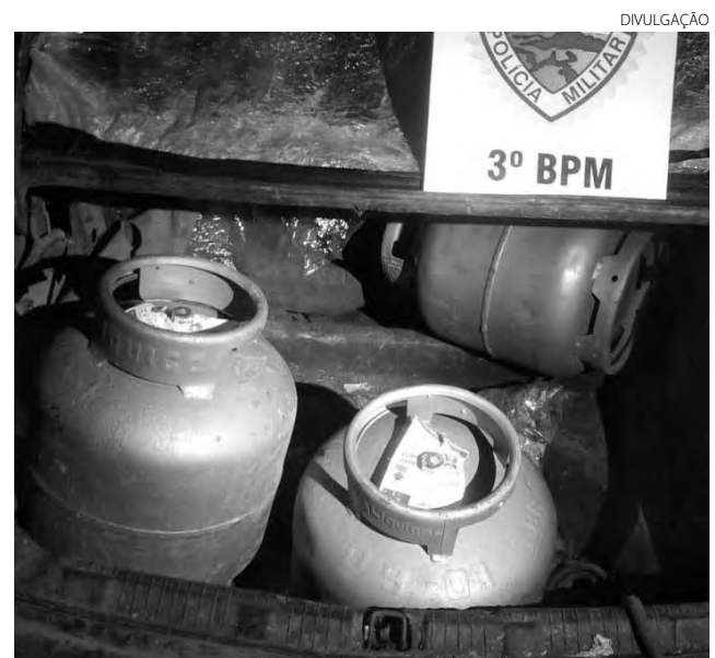
Os botijões tinham sido furtados de uma distribuidora de gás de Pato Branco

A equipe da Rocam fez consulta no sistema e constatou que havia um mandado de prisão contra o condutor do veículo, de 35 anos, por ameaças. O preso, que não teve o nome divulgado, foi encaminhado, juntamente com o veículo e os botijões de gás recuperados, à Delegacia da Polícia Civil de Pato Branco para as providências cabíveis ao fato. (AB)