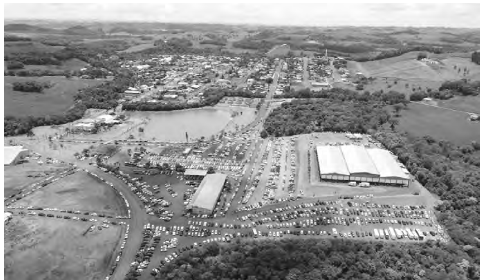
A 15ª Festa do Leitão Desossado será Centro de Eventos Jordan Munaretto, junto ao Parque dos Anjos

Os acompanhamentos do kit serão servidos a partir das 11h30, este composto por: saladas, legumes, conservas, frutas, mandioca,