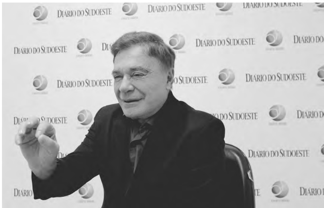
“A política estimula a ambição das pessoas, muitas vezes a ambição desmedida”, frisou Alvaro Dias