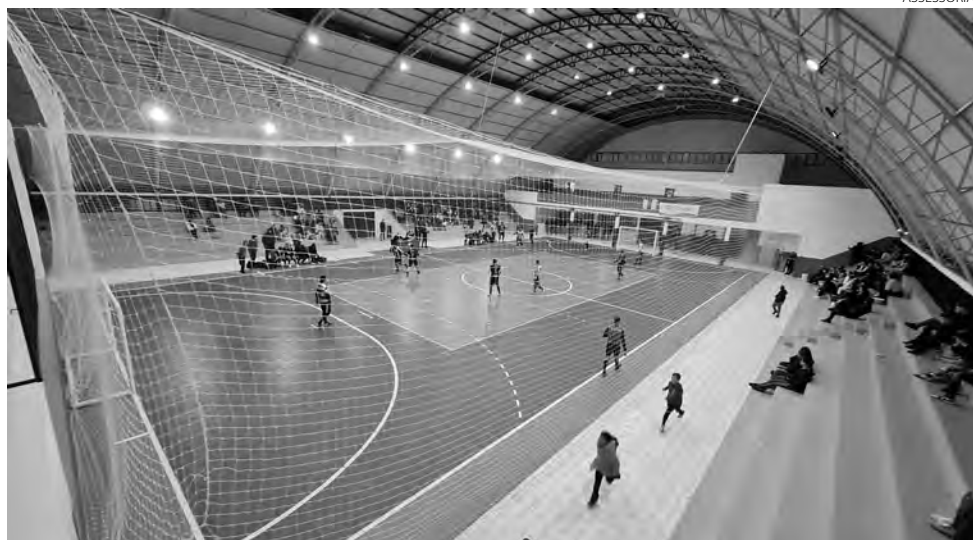
Atletas vitorinenses terão isenção de inscrição nas competições municipais

administração pública, será possível para o município realizar o pagamento das inscrições nas competições em que atletas representantes de equipes do município estejam participando. Também