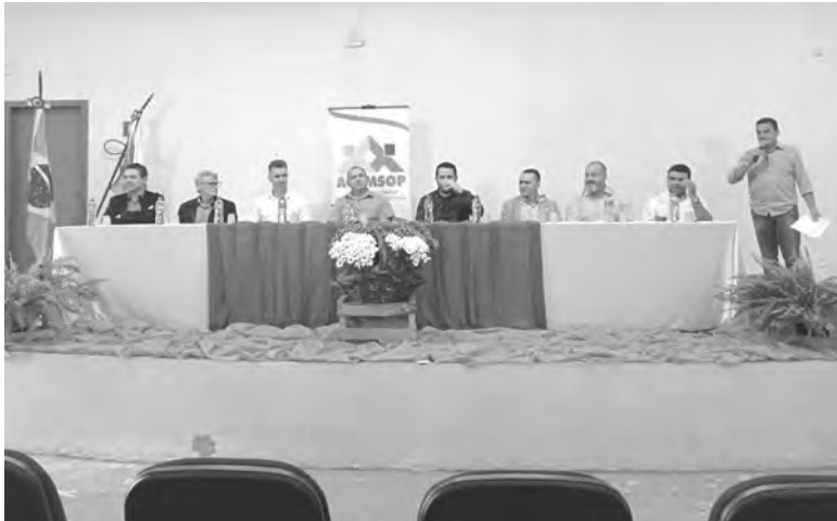
A assembleia da Acamsop em Salgado Filho ocorreu no último dia 9