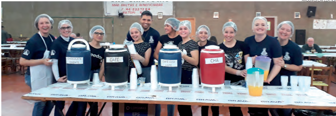
Evento arrecadará recursos para obras na capela

Nelson da Luz Junior nelson@diariosudoeste.com.br