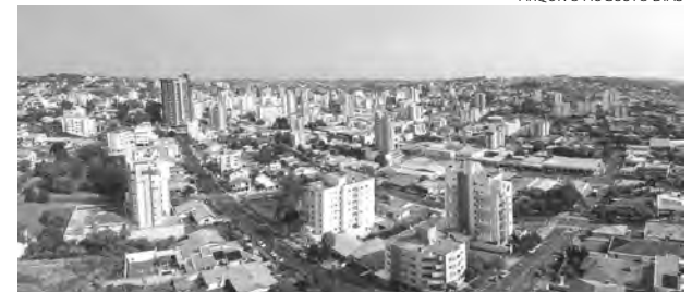
De 2018 a 2020, empresa denunciada assinou 16 contratos com o Município