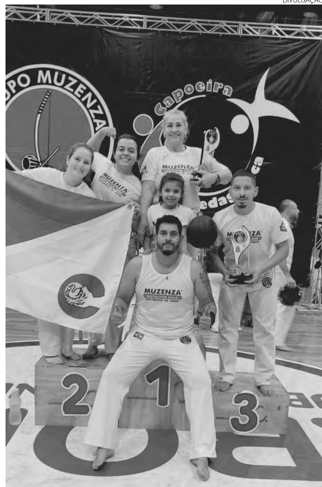
Equipe que representou Pato Branco na competição

A equipe deve participar de uma nova competição em outubro, na cidade de Florianópolis. (Redação)