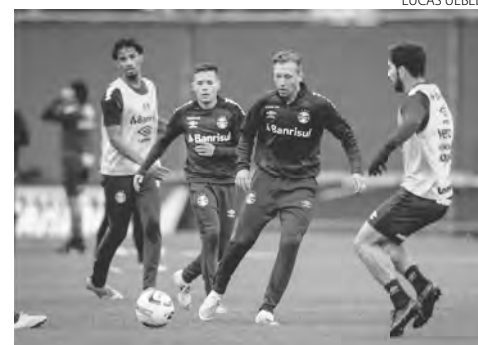
O Grêmio se prepara para enfrentar o Tombense pela Série B

A segunda atividade da manhã foi em meio campo, os atletas se enfrentaram em 13 contra 13, com dois coringas. O objetivo foi trabalhar a posse de bola, a marcação e a troca de passes. Posteriormente, os co-