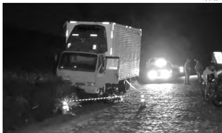
O homem foi encontrado morto nas imediações de um caminhão

O ex-policia militar, que era vizinho da vítima, teria planejado o crime e ordenado a execução, realizada pelo outro denunciado, que se deslocou de Curitiba a Mariópolis para esse fim. A investiga-