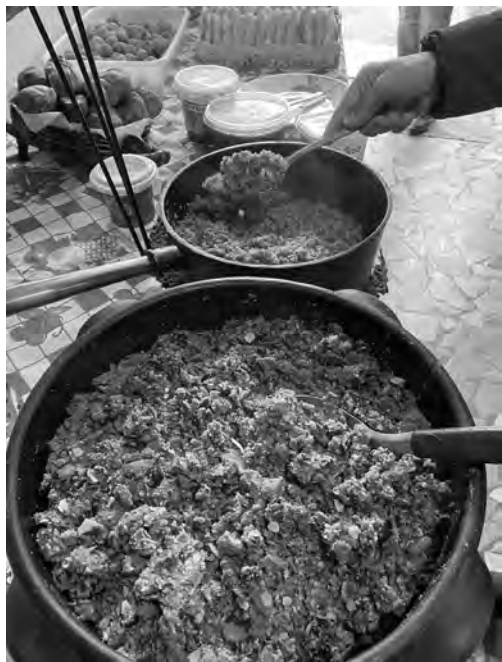
Gastronomia é aposta de Honório Serpa para turismo municipal