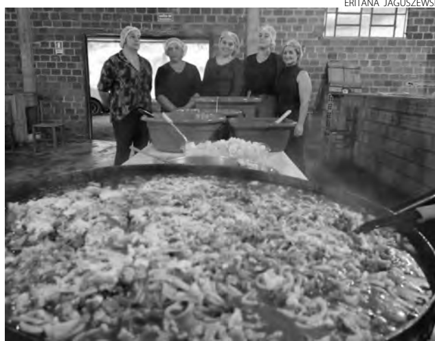
Eventos com pratos típicos do município serão parte do turismo local

A Feira da Agricultura Familiar também consta como potencial turístico do município, com sete agricultores oferecendo hortifrúts, panificação, bolos, bolachas,