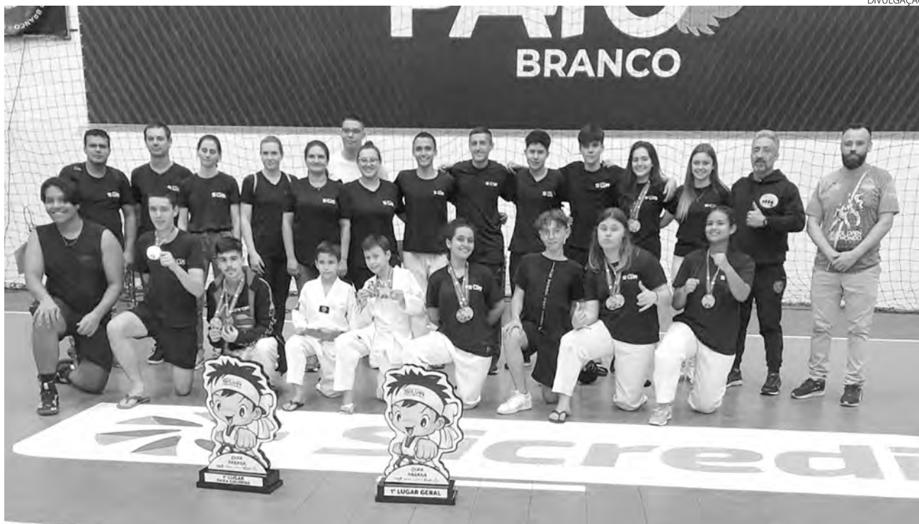
Os atletas da Associação Silva comemoraram o título da Copa Paraná