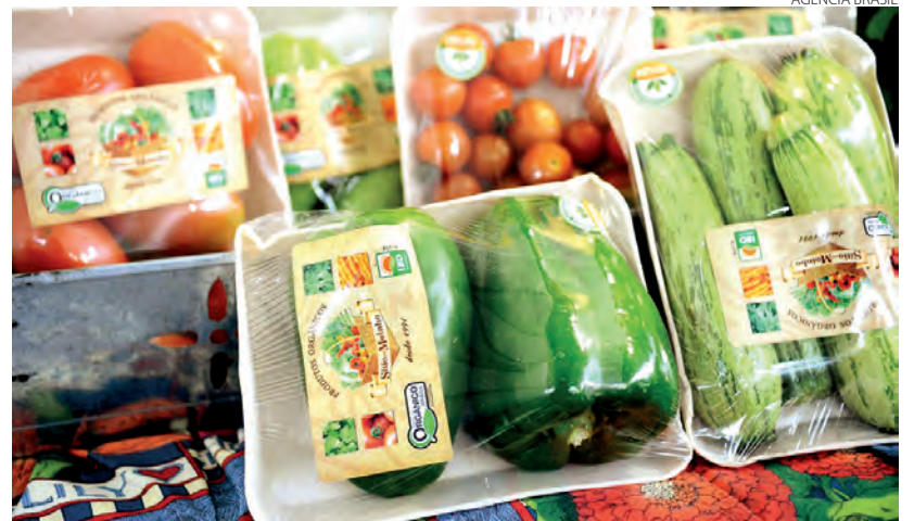
Medida evitará desperdício de alimentos, diz secretário do Mapa