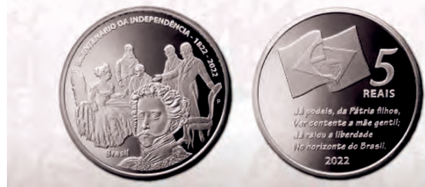
Versão em cuproníquel é a primeira moeda da história do Brasil com detalhes coloridos

sessão do Conselho de Estado, presidida pela princesa Leopoldina e com a participação de José Bonifácio, que culminou no envio de cartas que pediam que Dom Pedro rompesse com a coroa portuguesa.