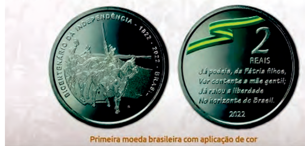
Primeira moeda brasileira com aplicação de cor