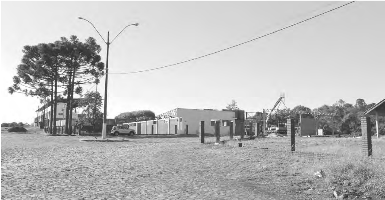
Enquanto licitação da nova arena está suspensa, demolição do antigo almoxarifado segue

Motivo de nova suspensão são vigas de travamento em tesouras da cobertura da arena