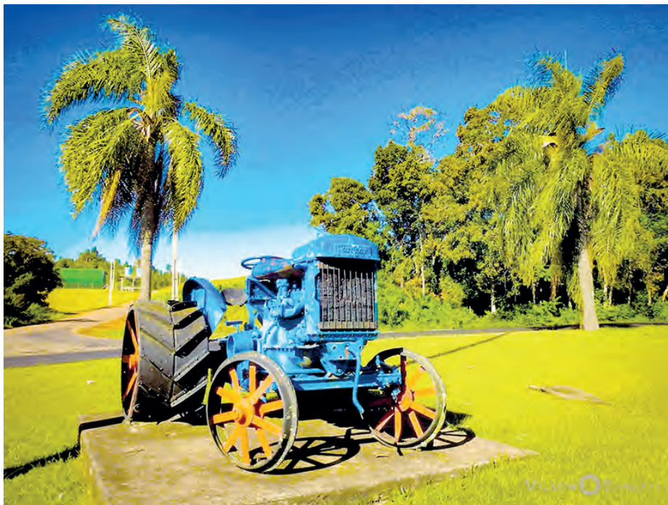
Um dos símbolos de Mariópolis, o trator no trevo de acesso da PR-280, foi registrado por Vilson Bonetti