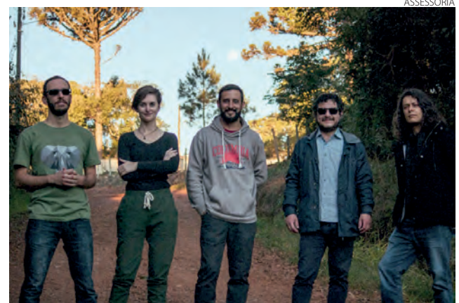
Depois de Pato Branco, integrantes realizarão apresentações Santo Antônio da Platina, Londrina e Araçongas

O espetáculo, intitulado “Latitudes Latinas”, deve ter em torno de uma hora de duração, com os músicos trazendo curiosidades sobre o contexto cultural presentes no repertório que conta com composições do álbum Ovo e músicas inéditas compostas durante a