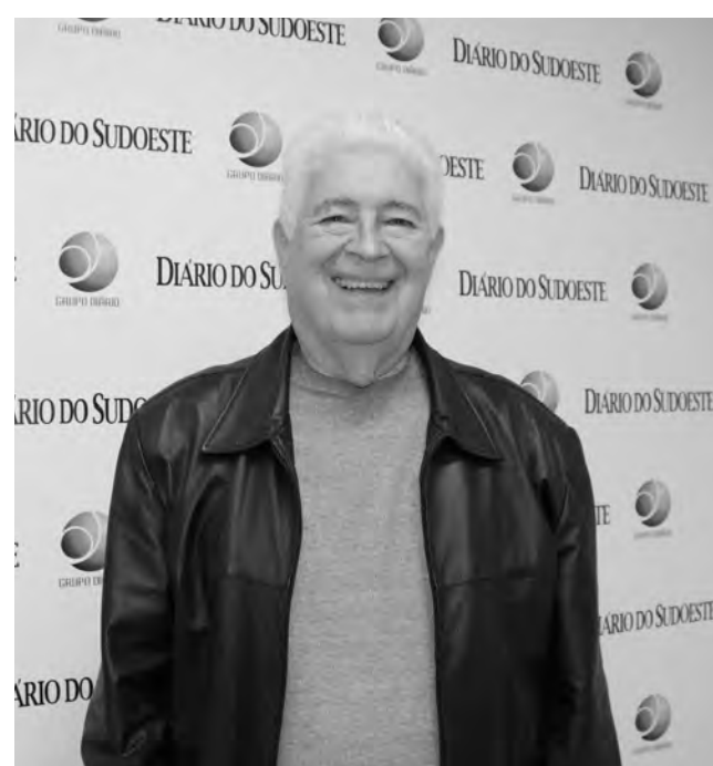
Requião é pré-candidato ao governo do Paraná pelo PT

Deixando de lado o campo da agricultura, mas com olhar ao desenvolvimento econômico, o pré-candidato ponderou que “o Paraná e o Brasil, estão se reduzindo no número de criação de empresas”, e recordou números por ele atribuídos a época de seus governos. “Na época que eu fui governador, criávamos 32 mil empresas por mês, hoje, isso caiu a números ridículos. Precisamos retomar o crescimen-