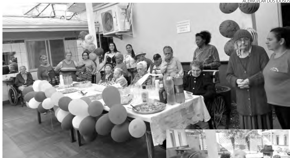
ACERVO/LAR DOS IDOSOS

Aniversário de 102 anos do acolhido mais velho do lar