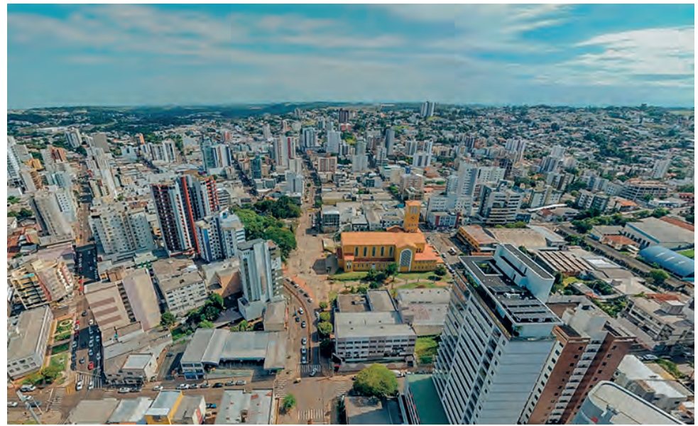
Praça Getúlio Vargas é destino de lazer da população de Pato Branco

O projeto foi arquivado em maio de 2019, após solicitação através do requerimento nº 1209/2019, onde cita que “do ponto de vista jurídico, com base na jurisprudência dominante dos Tribunais Pátrios, alerta-se