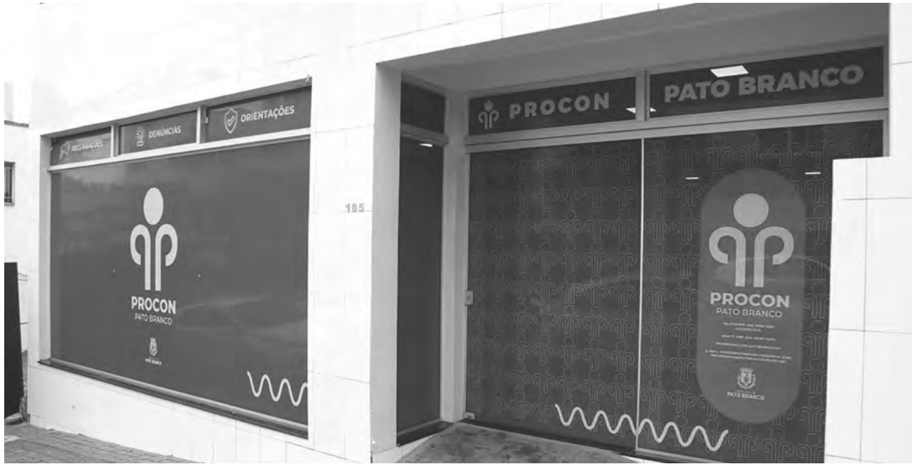
Consumidores que recebem ofertas devem procurar o Procon