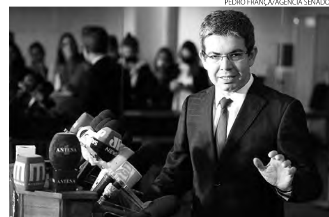
O senador Randolfe Rodrigues durante entrevista coletiva concedida na quinta-feira

Para Pacheco, em termos de conveniência e oportunidade, o momento pré-eleitoral é algo que pode prejudicar o escopo de uma CPI, que, ressaltou ele, deve