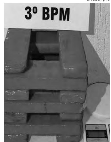
A maconha que foi apreendida pela Polícia Militar em Itapejara D'Oeste

O maior de idade foi preso e os menores detidos. Eles foram encaminhados à Delegacia da Polícia Civil, juntamente com o entorpecente, para as providências cabíveis ao fato. (AB)