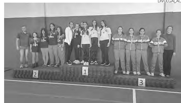
As atletas de Verê conquistaram quatro medalhas de ouro e uma de prata

Agora as atletas se preparam para a fase estadual dos JEPs, em julho e agosto, em Campo Mourão e Pato Branco. A técnica e as atletas agradecem a Secretaria Municipal de Educação, que disponibilizou transporte e uniformes às equipes. (Assessoria)