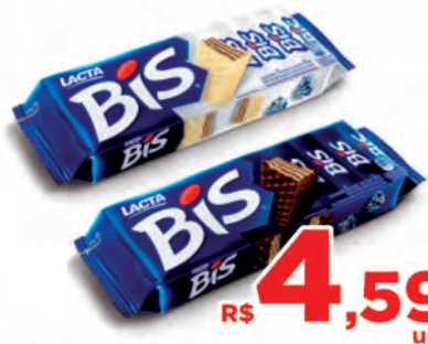
Chocolate Bis 126g Ao Leite e Laka