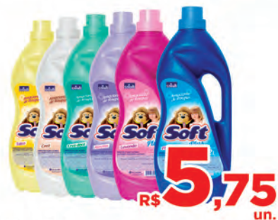
Amaciante Soft Plus 2 Litros