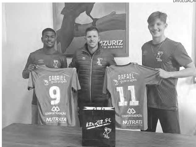
Juntos os dois atacantes somam mais de 30 gols na temporada