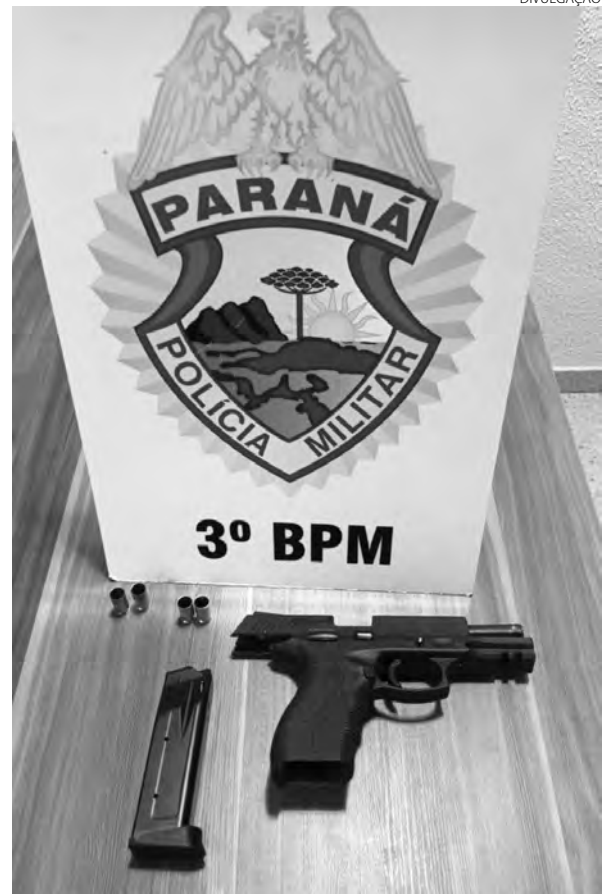
A pistola e os cartuchos deflagrados que foram apreendidos durante a ação policial

De acordo com a Polícia Militar, o rapaz abordado assumiu a autoria dos disparos e a propriedade da arma, que possuía registro, mas não porte. Ele foi preso e encaminhado, juntamente com a pistola apreendida, à Delegacia da Polícia Civil, devendo responder por porte ilegal de arma de fogo. (AB)