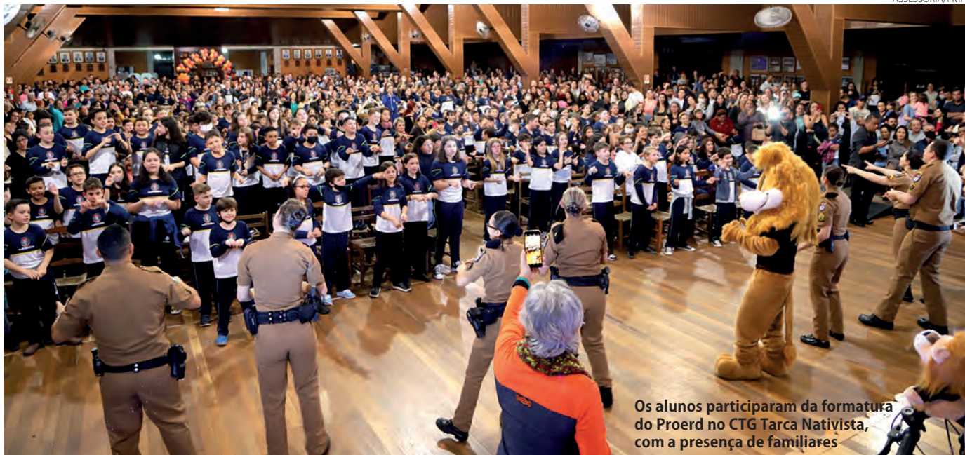
Os alunos participaram da formatura do Proerd no CTG Tarca Nativista, com a presença de familiares

Durante a cerimônia de formatura foi possível observar a relação de confiança e amizade criada entre os alunos e os policiais do programa. Com energia, descontração, músicas e coreografias, os policiais animaram os alunos, pertencentes às 15 escolas participantes neste primeiro semestre,