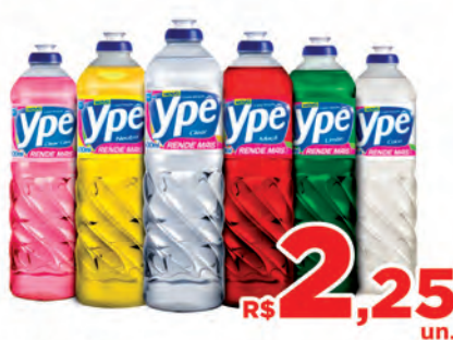
Detergente Ypê 500g