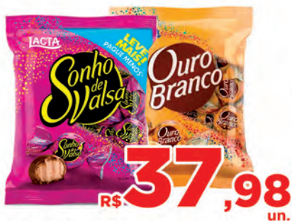
Bombom Sonho Valsa e Ouro Branco Pc 1k