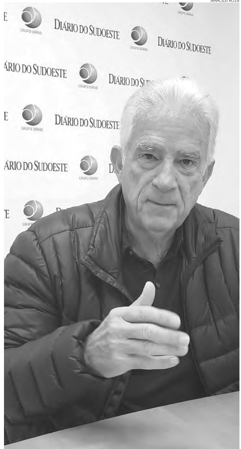
O deputado federal Rubens Bueno concedeu entrevista ao Diário na última quinta-feira (16)

Para se ter uma ideia, Pato Branco recebeu R$ 9 milhões e 300 mil desse Orçamento de Guerra para o combate à pandemia. O orçamento foi de guerra, porque precisávamos enfrentar essa guerra que o mundo todo combatia. Em comparativo, na 2ª Guerra Mundial, estivemos com 25 mil soldados e perdemos 400 solda-