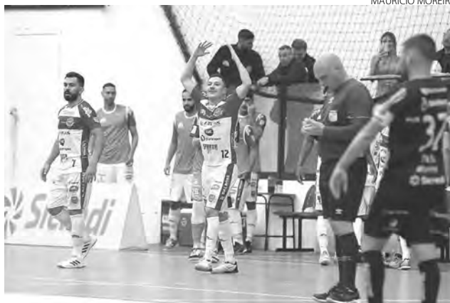
Após vencer o Blumenau pela Liga, o Pato Futsal enfrenta o Cascavel pelo Estadual