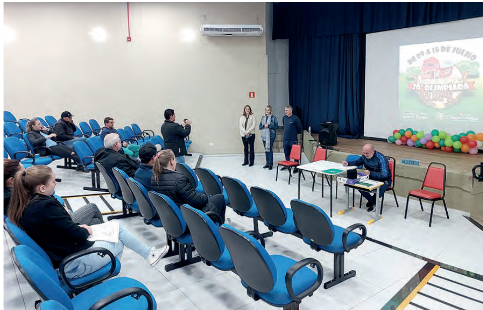
Expectativa é de que 1.500 competidores participem da olimpíada deste ano

O diretor do Departamento de Esportes também explicou que a caça a galinha, que por anos fez parte das disputas da Olimpíada Rural, já não integra mais as disputas para preservar os animais. Com relação a corrida do porco, Pizzi explicou que "não há contato físico em nenhum momento do competidor com o animal, então é apenas uma brincadeira, onde não causa prejuízo ao animal", disse comentando o motivo da manutenção da modalidade nas disputas.