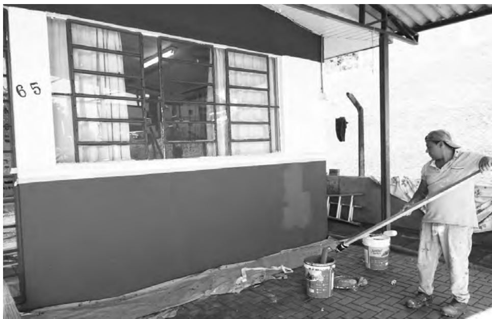
CMEI recebeu diversos reparos e melhorias

estrutura física, foi construído um muro pequeno, para conter o solo do canteiro e foram realizados serviços de podas de árvores, removendo partes danificadas, assim