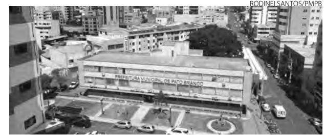
Concurso preenche 10 vagas efetivas e cadastro de reserva