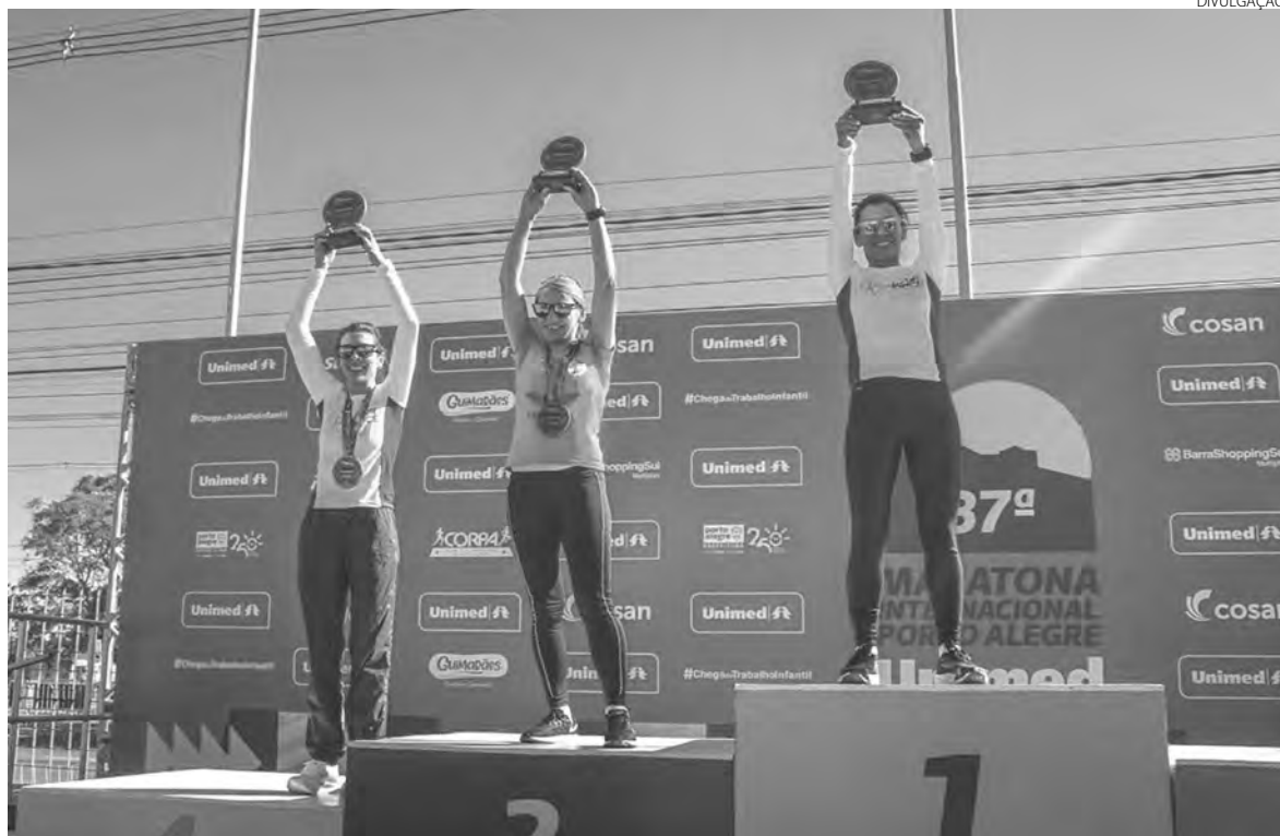
As três atletas da região que chegaram ao pódio em Porto Alegre

A 37ª Maratona Internacional de Porto Alegre foi disputada no último domingo (12), com a participação de 15 mil atletas de 19 países. A Associação de Corredores de Rua de Pato Branco (Acorpato) foi representada por cerca de 70 atletas, mas também estiveram disputando a prova outros atletas da cidade e região, nos percursos de 42.195km (maratona), 21 km (meia maratona) e 8,5 km (rústica).