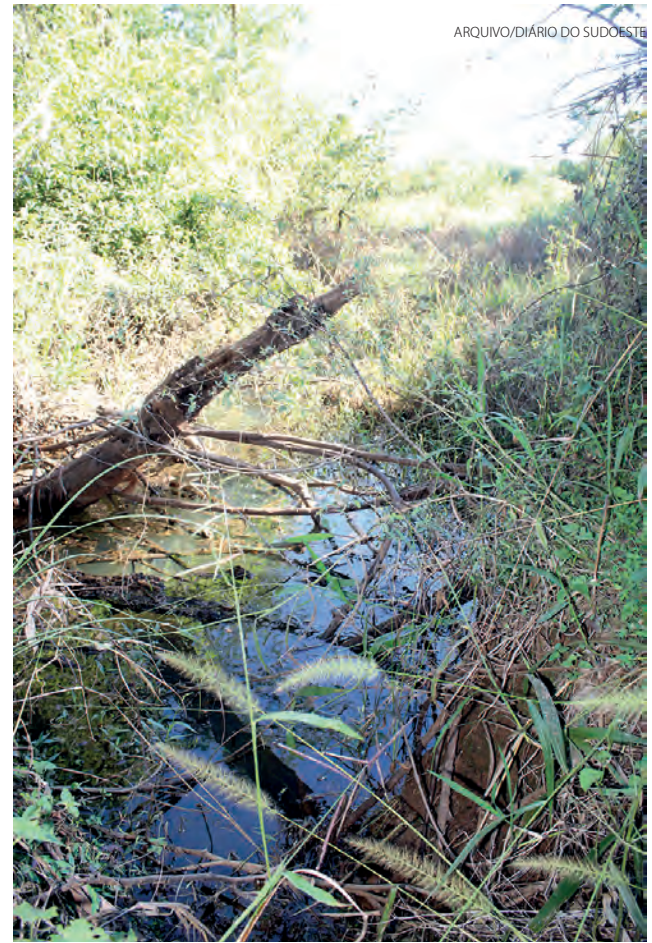
Rio Pato Branco contribui para recebimento do ICMS Ecológico de Mariópolis

Além de lideranças locais, profissionais e entida-