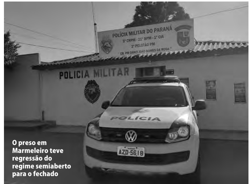
O preso em Marmeleiro teve regressão do regime semiaberto para o fechado

Uma equipe policial foi ao local e prendeu o jovem, que estaria tendo atitudes agressivas com a bisavó. Ele foi entregue na Delegacia da Polícia Civil para as providências cabíveis ao fato.