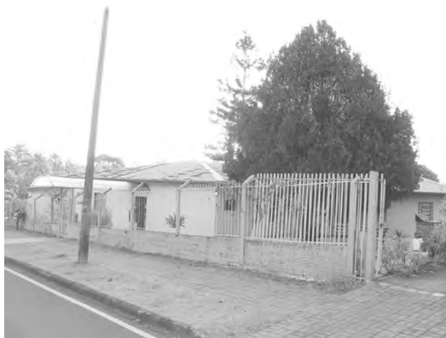
Termo de cessão foi assinado no início de junho

Ainda de acordo com o Município, somente no mês de maio deste ano, foram registrados 130 atendimentos pelo serviço de Abordagem