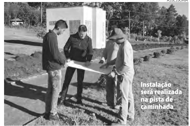
Instalação será realizada na pista de caminhada

Para realizar esta obra será investido R$ 1.041.133,00, sendo R$ 960.019,00 através de emenda do deputado federal Ricardo Barros e R$ 81.114,00 de contrapartida, com recursos próprios da prefeitura.