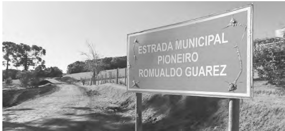
Trecho que deve ser pavimentado é de 5,7 quilômetros

Além da pavimentação, será executado o serviço de base, ampliação e limpeza da via, melhorias nos aces-