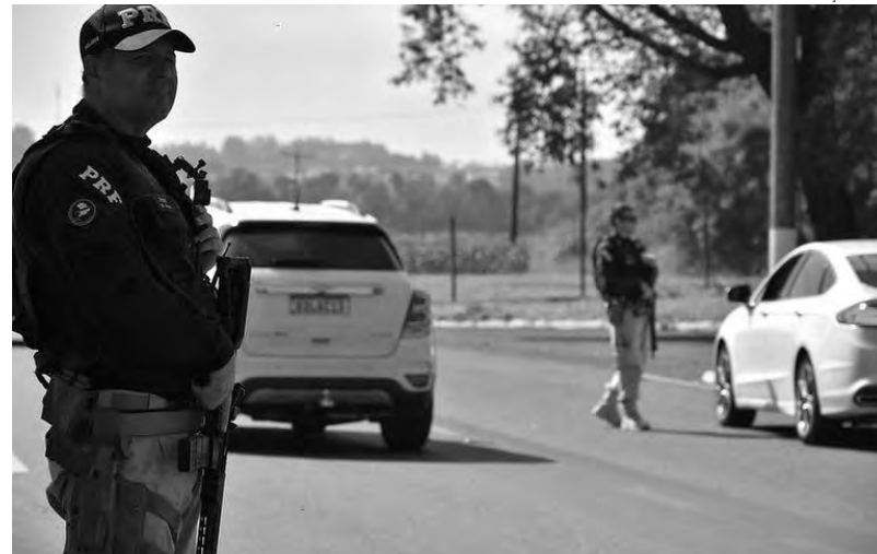
As ações da PRF seguem até a meia-noite do próximo domingo

Alguns temas que receberão destaque: ultrapassagens indevidas, embriaguez ao volante, utilização do cinto de segurança, utilização dos dispositivos de retenção para crianças, uso do capacete, excesso de velocidade, uso do celular ao dirigir, entre outros. Essas são as condutas que, historicamente, provocam o maior número de fatalidades nas rodovias.