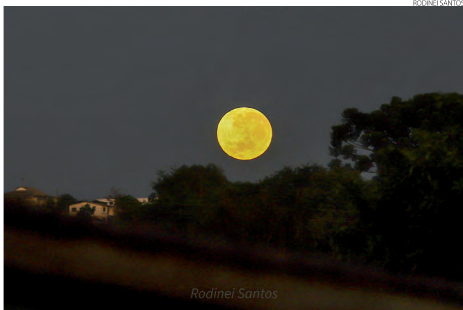
A lua se mostrou majestosa na manhã da terça-feira (14), quando os primeiros raios de sol já despontavam no céu de Pato Branco