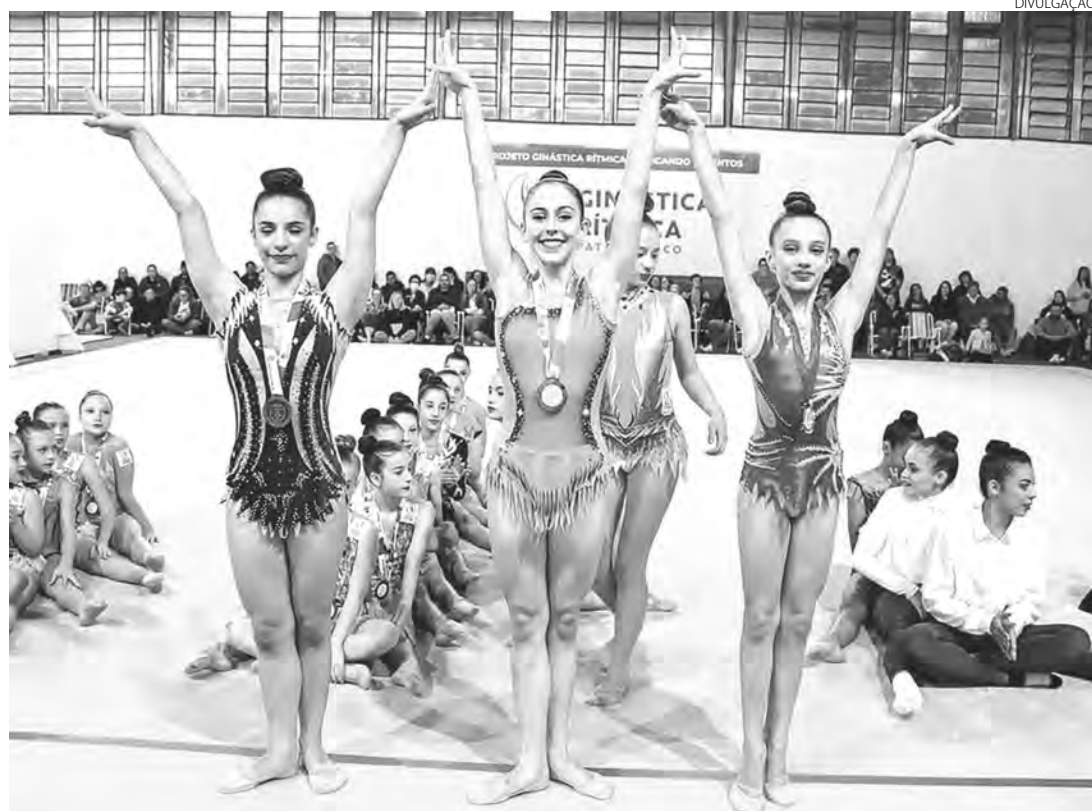
Primeira fase da Copa foi realizada no mês de maio

Redação com assessoria redacao@diariosudoeste.com.br