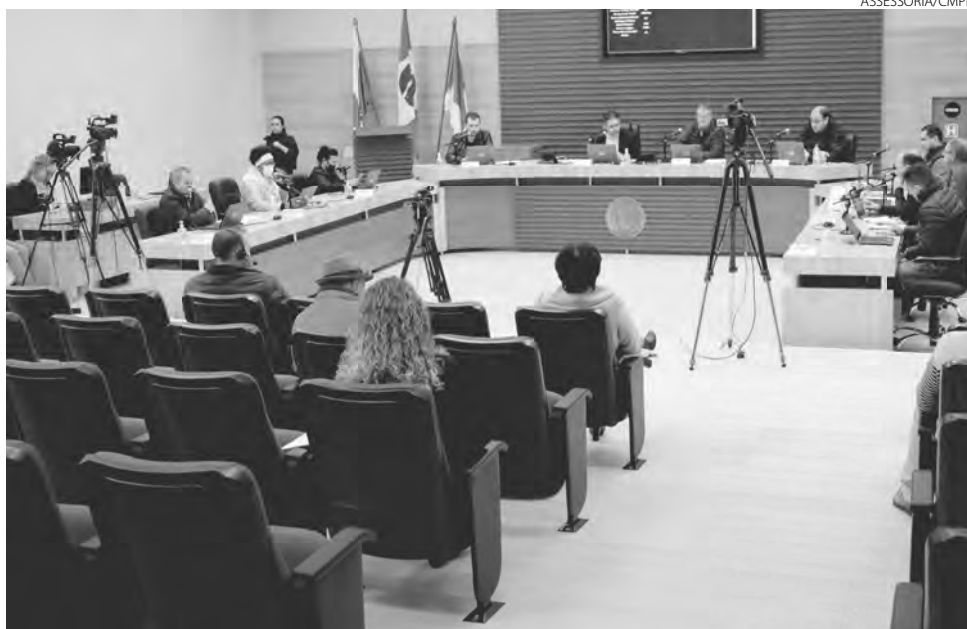
Na sessão de segunda-feira (30) foram aprovadas aberturas de crédito especial, ampliação de cargos e contratação por meio de PSS

Também foi aprovada em primeira votação o Projeto de Lei nº 55, de 2022, de autoria do Executivo, que amplia de seis para oito o número de va-