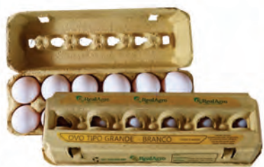
Ovos Branco Grande RealAgro Dúzia