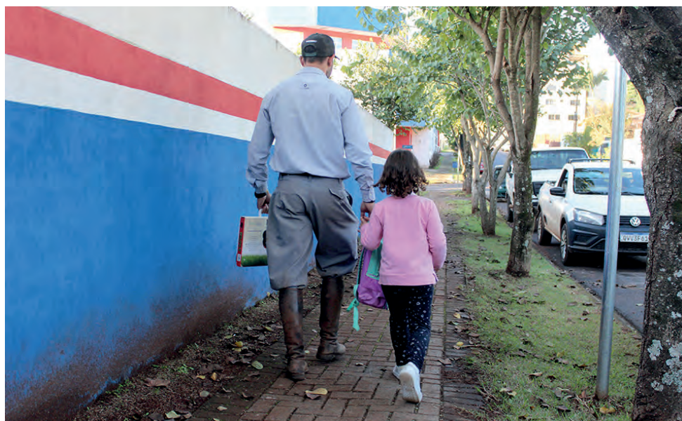
Avaliação foi realizada de acordo com dados do Censo Escolar de 2021

ras para atender as crianças. Também há muitas famílias que se reorganizaram, uma vez que a própria pandemia pode ter criado novos hábitos familiares”, aponta.