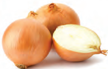
Cebola Importada Kg