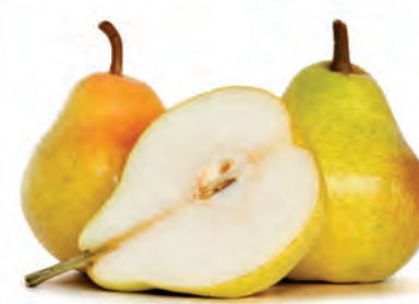
Pera Willians Importada Kg