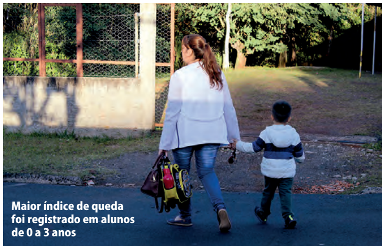
Maior índice de queda foi registrado em alunos de 0 a 3 anos