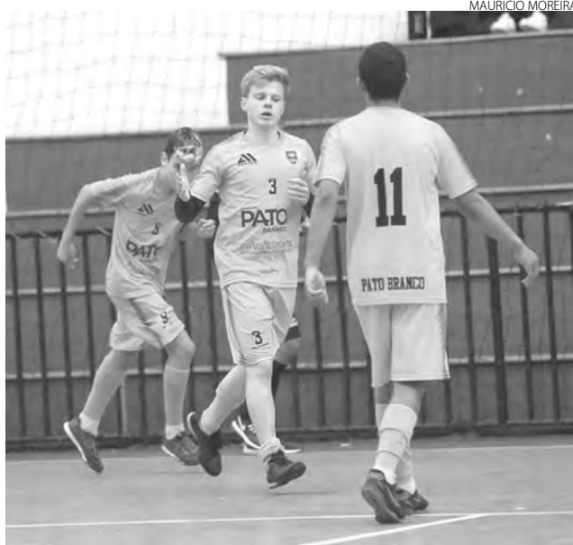
Atletas comemoram um dos gols da vitória do sub-15

O Projeto do Pato Futsal tem o Incentivo - Proesporte / Governo do Estado do Paraná - Secretaria de Estado da Educação e do Esporte - Paraná Esporte - Lei Estadual de Incentivo ao Esporte. (Assessoria)