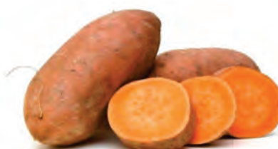
Batata Doce Amarela Kg