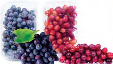
Uva Vitória e Ísis Bandeja 500g