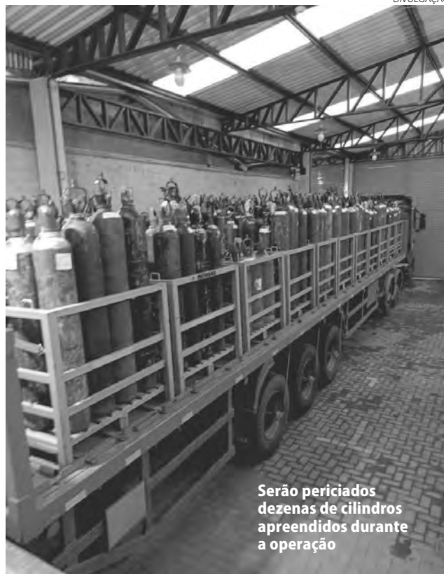
Serão periciados dezenas de cilindros apreendidos durante a operação

Por conta dessas adulterações, o grupo criminoso venciu inúmeras licitações, fornecendo o produto a preço muito inferior aos cobrados no mercado. Desde o início de 2020, o prejuízo estimado nos contratos firmados com mais de 20 municípios e entidades públicas chega a R$ 750 mil, podendo alcançar R$ 3 milhões caso os contra-