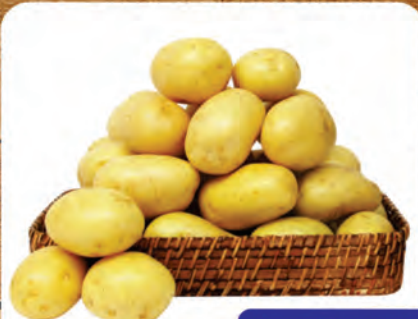
Batata Monalisa Kg