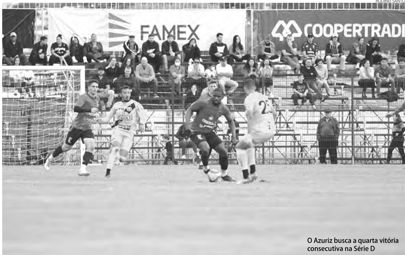
O Azuriz busca a quarta vitória consecutiva na Série D