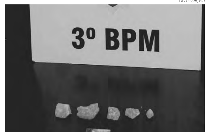
As drogas que estavam sendo transportadas para Itapejara

Polícia Militar realizava patrulhamento, por volta das 22h, na rua Santa Catarina, bairro Vila Nova, quando percebeu que um rapaz dispensou um objeto ao avistar a viatura. O suspeito foi abordado e os policiais encontraram um invólucro contendo 71 gramas de maco- nha e uma porção de cocaína. O preso e as drogas foram entregues na 5ª Subdivisão Policial (5ª SDP) de Pato Branco para as providências cabíveis ao fato. (AB)