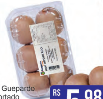
Kiwi Guepardo Importado Bandeja 600g