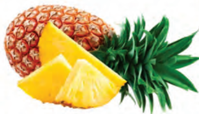
Abacaxi Hawai Extra Unidade