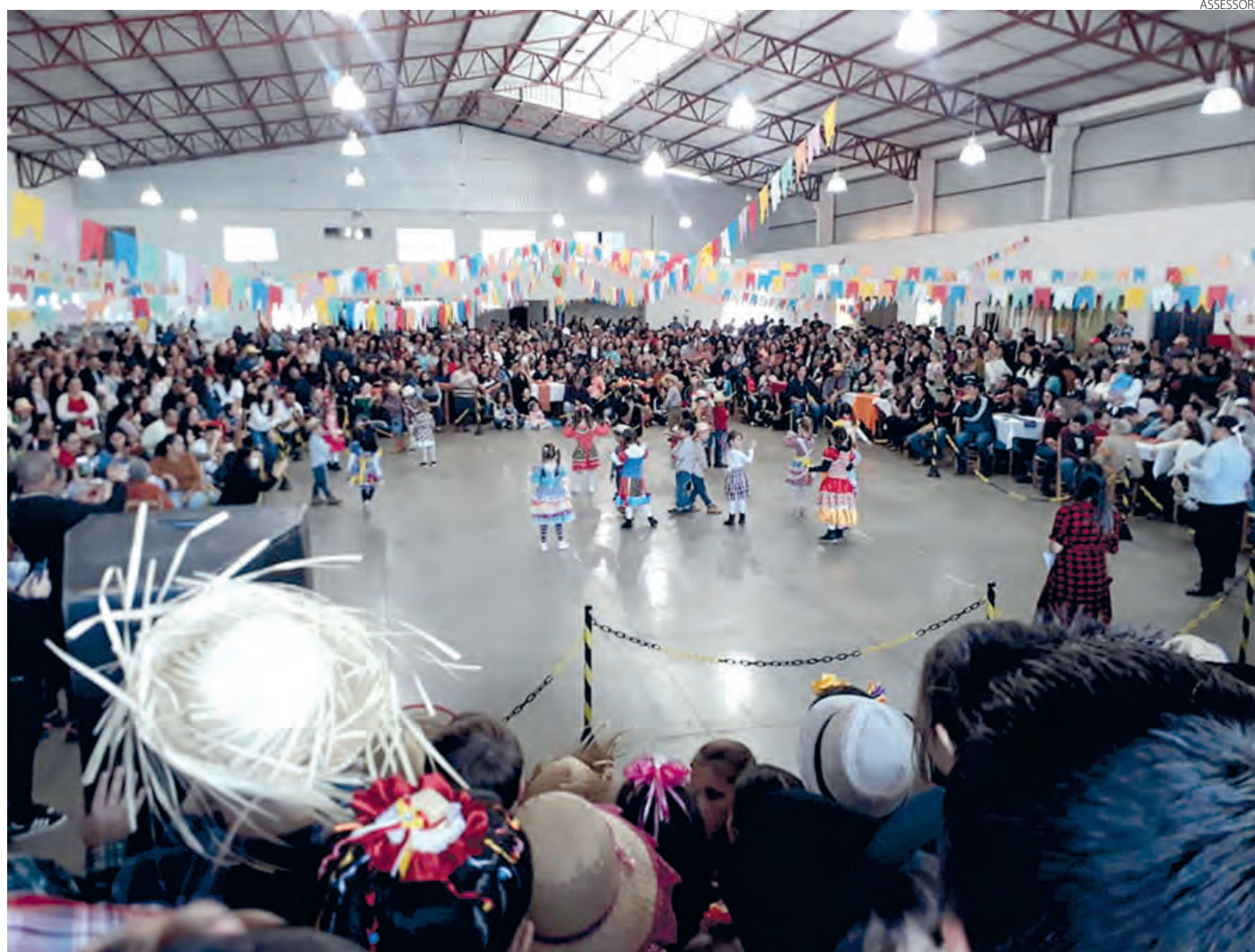
Registro da Festa Junina na Escola Municipal Irmã Neli – EF, em Bom Sucesso do Sul