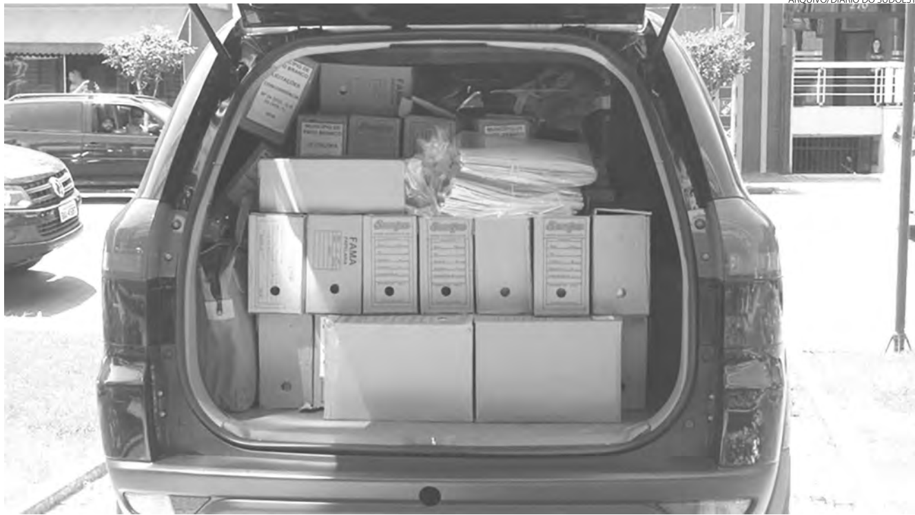
Registro das apreensões realizadas pela Justiça no dia em que a Operação Hígia foi deflagrada em Pato Branco