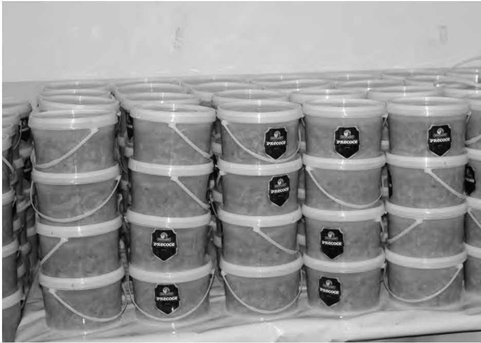
Cerca de 1,350 kgs de buchada já estavam prontos na tarde de quinta-feira (9)