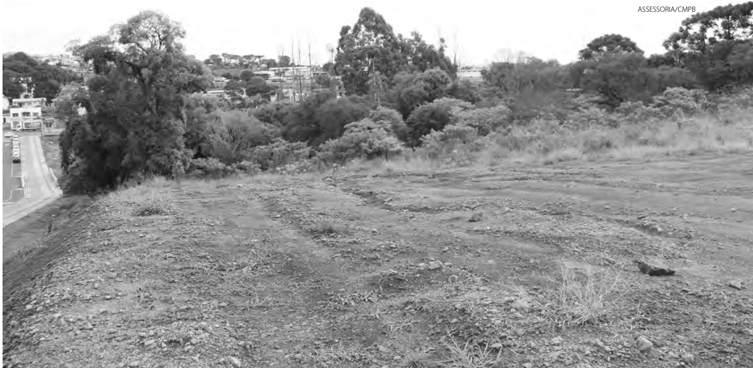
Terreno público apontado no Projeto de Lei, suspenso pelo Executivo, a ser doado ao ISSAL para construção do hospital

Com isso, “considerando que tramita na Câmara Municipal de Pato Branco o Projeto de Lei Ordinária nº 26, de 2022, que visa a desafetação e doação de bem imóvel público a entidade particular, com fins filantrópicos”, o MP explica que “a desafetação significa que o bem não estará mais atrelado a uma destinação específica, deixando de servir à finalidade pública anterior”. Ainda, de