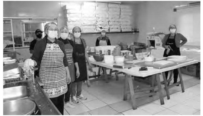
Produção do bolo de Santo Antônio já acontecia na quinta-feira (9)