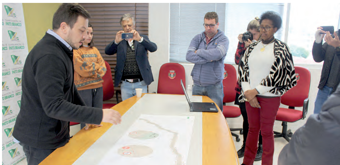
Ciclofaixa foi projetada para a região Leste do município