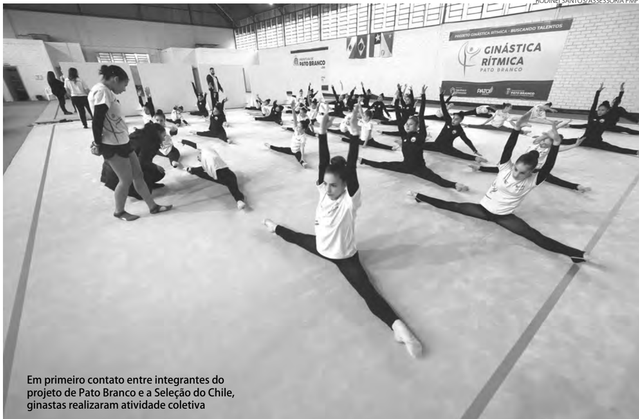
Em primeiro contato entre integrantes do projeto de Pato Branco e a Seleção do Chile, ginastas realizaram atividade coletiva