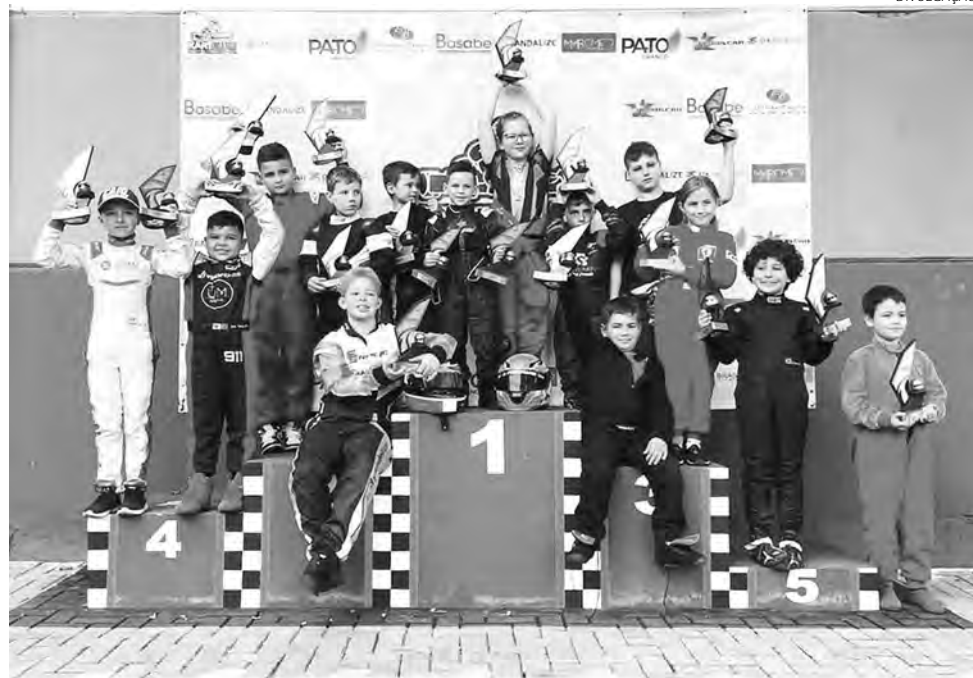
Competidores das categorias iniciantes reunidos no pódio