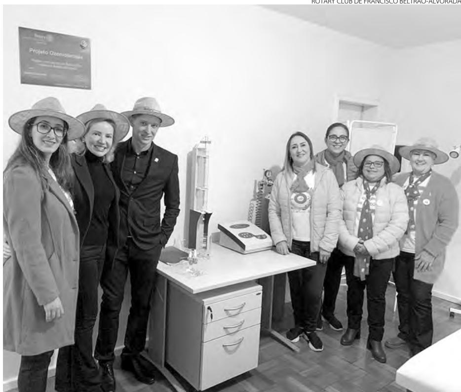
Projeto Ozonioterapia Francisco Beltrão

ROTARY CLUB DE FRANCISCO BELTRÃO-ALVORADA