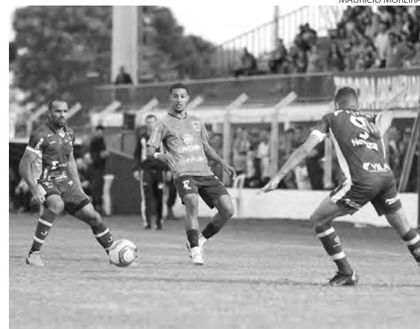
O Azuriz foi surpreendido em casa pelo Juventus (SC)

Faltando três rodadas, o Azuriz tem sete pontos a mais que o Marcílio Dias, quinto colocado. Com isso, depende somente de um empate no próximo domingo, em confronto direto contra a equipe catarinense, fora de casa, para garantir a classificação.