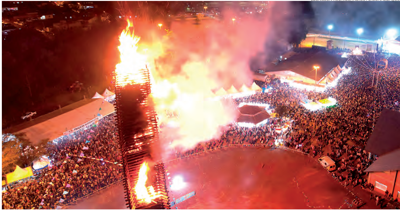
Fogueira desse ano teve 52 metros de altura

Nesse ano, a fogueira foi construída com a ajuda de um guindaste, em 10 dias, e contou com a atuação de 12 trabalhadores diretamente, chegando a 52 metros de altura. Para que o atrativo fosse construído, 200 metros cúbicos