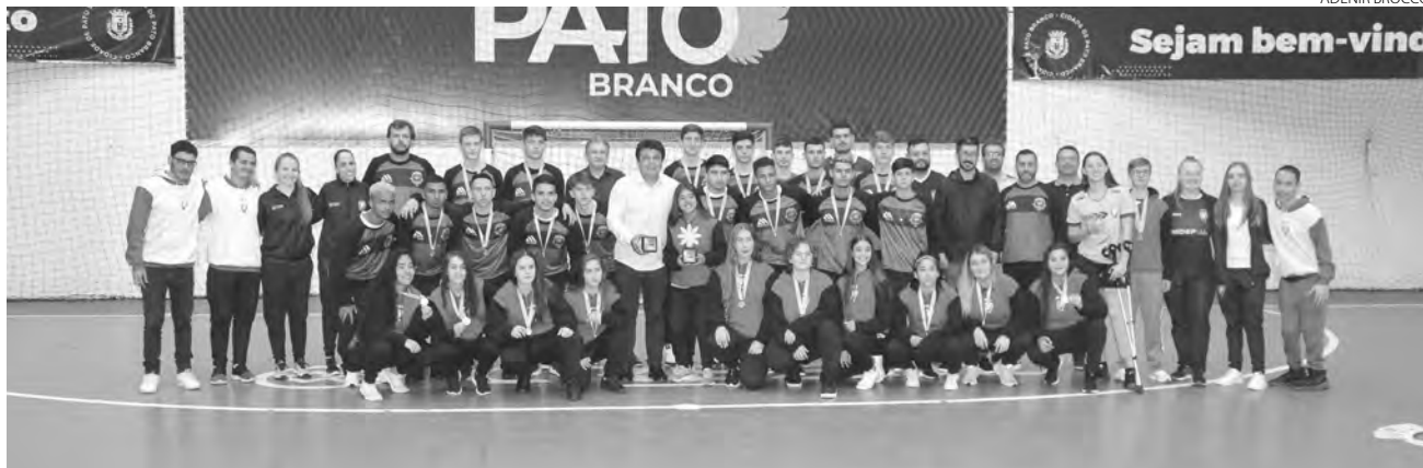
As equipes campeãs foram recebidas segunda-feira no Ginásio Dolivar Lavarada

Adenir Brocco com assessoria ade@diariodosudoeste.com.br