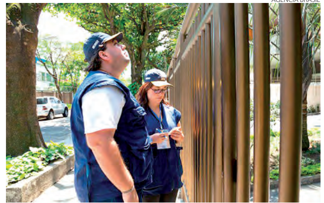
Instituto já tem sinal verde da pasta da Economia para recomposição

Em resposta à Agência Brasil, o Ministério da Economia informou que a Secretaria de Orçamento Federal só se manifesta sobre “créditos orçamentários cuja proposta já esteja formalizada e seus efeitos tornados públicos”.