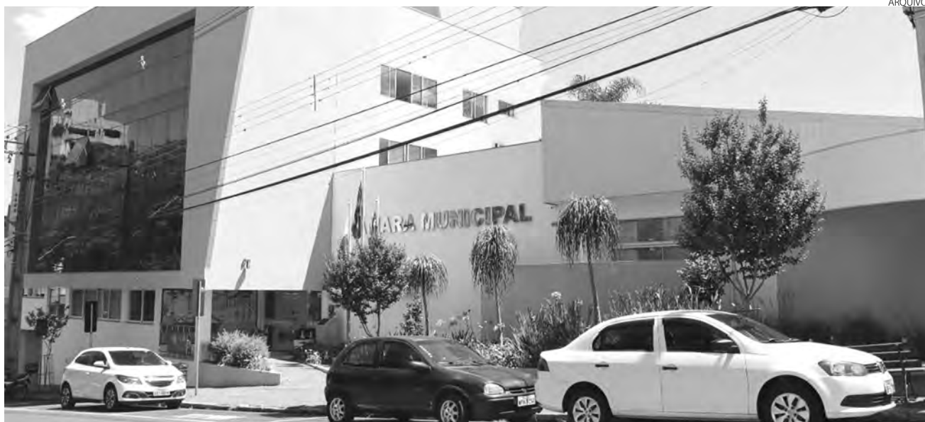
Segundo o projeto dos vereadores, o pedido se justifica pela melhoria na qualidade de vida que trará aos usuários do CEU

salta que “as Secretarias Municipais de Planejamento Urbano e de Meio Ambiente emitiram pareceres técnicos favoráveis à ampliação do CEU das Artes no aludido local”.