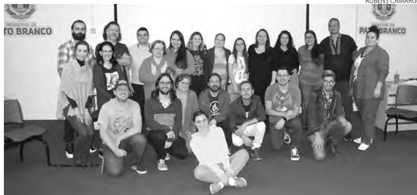
Representantes do Conselho Municipal de Política Cultural, e participantes do fórum de culturais

Integram o conselho representantes de associações de moradores dos bairros de Pato Branco; institutos e associações culturais; centro de tradições gaúchas; clubes sociais e fundação cultural; academias e instituições culturais; entidades estudantis e de ju-