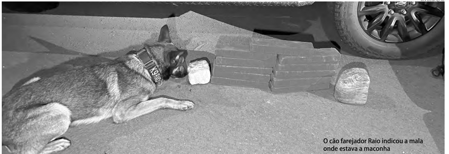
O cão farejador Raio indicou a mala onde estava a maconha

Um homem, que era procurado pela Justiça, foi preso quarta-feira, em Marechal Cândido Rondon, por policiais do Batalhão de Polícia de Fronteira (BPFron). O suspeito foi abordado durante ação da Operação Hórus, sendo um homem, de 50 anos, que tinha em seu desfavor um mandado de prisão pelo crime de tráfico de drogas. Ele foi entregue na Delegacia da Polícia Civil, estando à disposição da Justiça.