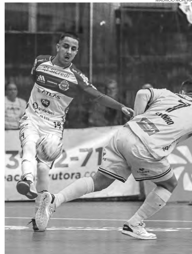
O Pato Futsal venceu o Praia Clube no jogo de ida das quartas de final da Copa do Brasil