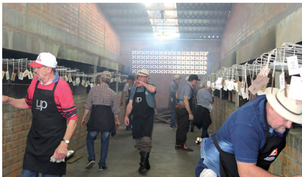
Voluntários se dedicaram durante meses para a realização da festa