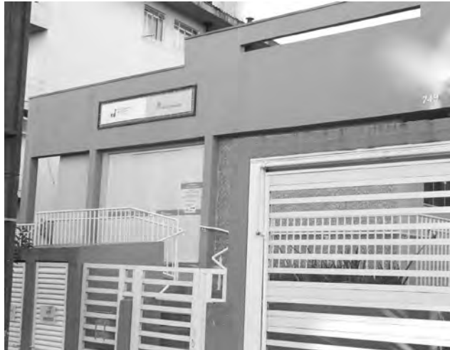
Grande maioria das oficinas será realizada na sede do Departamento de Cultura

oficina de “pintura em tela”, as segundas, das 8h às 10h; as terças, das 19h às 21h; as quartas, das 10h às 11h4; as quintas, das 19h às 21h; e as sextas, das 13h30 às 15h30.