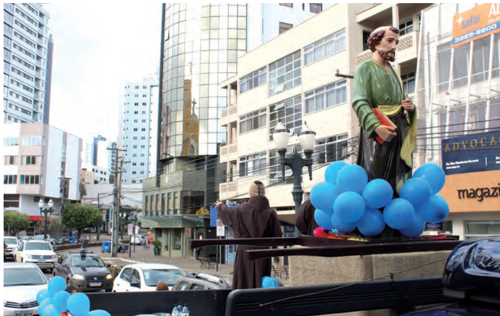
Nessa quarta pela manhã teve carreata do padroeiro e bênção dos carros