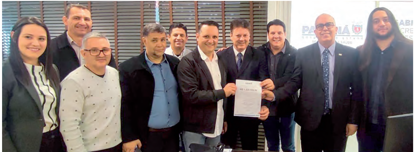
Solenidade de assinatura do convênio