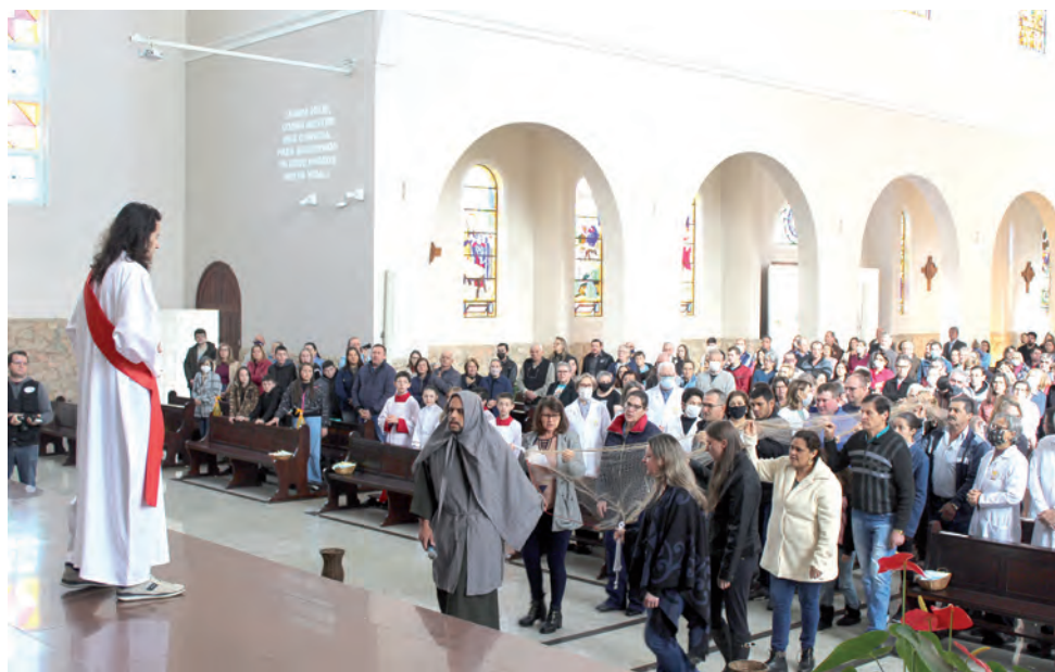
Missa solene foi presidida por Dom Edgar e teve referências a passagens de Jesus e São Pedro