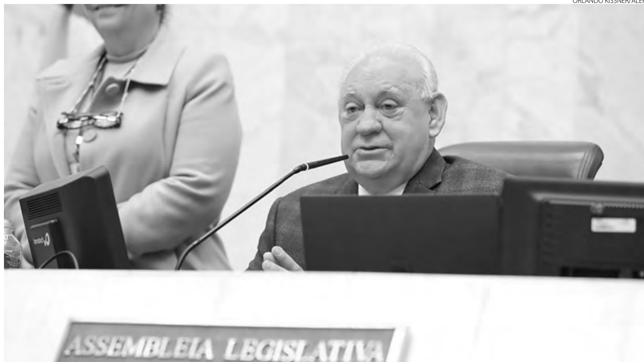
Decisão foi comunicada pelo presidente da Casa, deputado Ademar Traiano (PSD), na sessão plenária de quarta-feira (29)

Durante o comunicado, o presidente também disse que, após reunião conjunta entre as assessorias das Assembleias Legislativas, do Senado Federal, Câmara dos Deputados e Ministério Público Eleitoral, as sessões solenes, entregas de títulos de Cidadania e menções honrosas estão suspen-