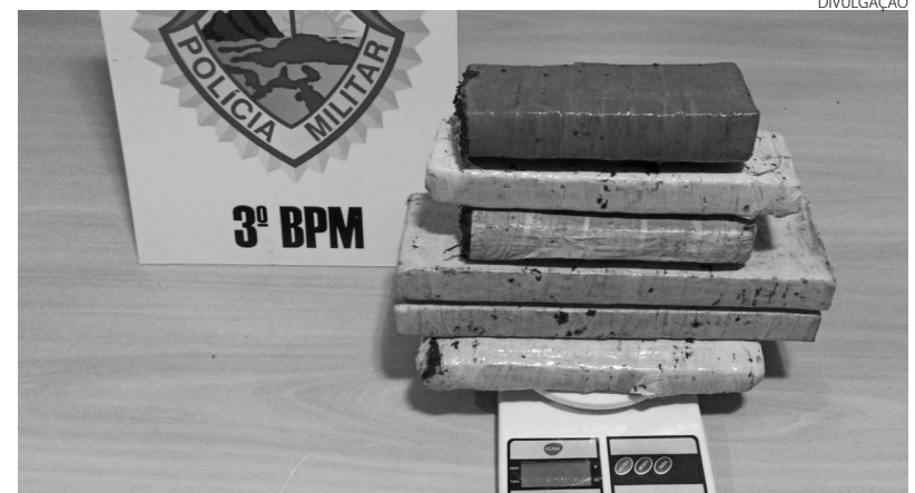
A maconha que foi apreendida no bairro São Luiz

Segundo a Polícia Militar, durante patrulhamento avistaram um masculino conhecido por diversas ocorrências de tráfico de drogas. O suspeito, ao perceber que seria abordado, empreendeu fuga saltando muros de algumas residências, mas acabou se machucando, deixando um rastro de sangue. Ele foi localizado atrás de uma casa ten-