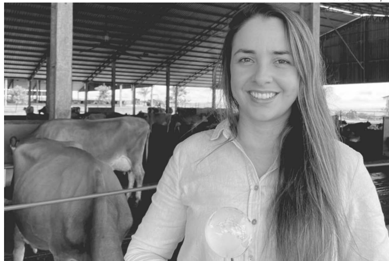
Pesquisa apontou que mais de 40% das mastites não precisam de tratamento