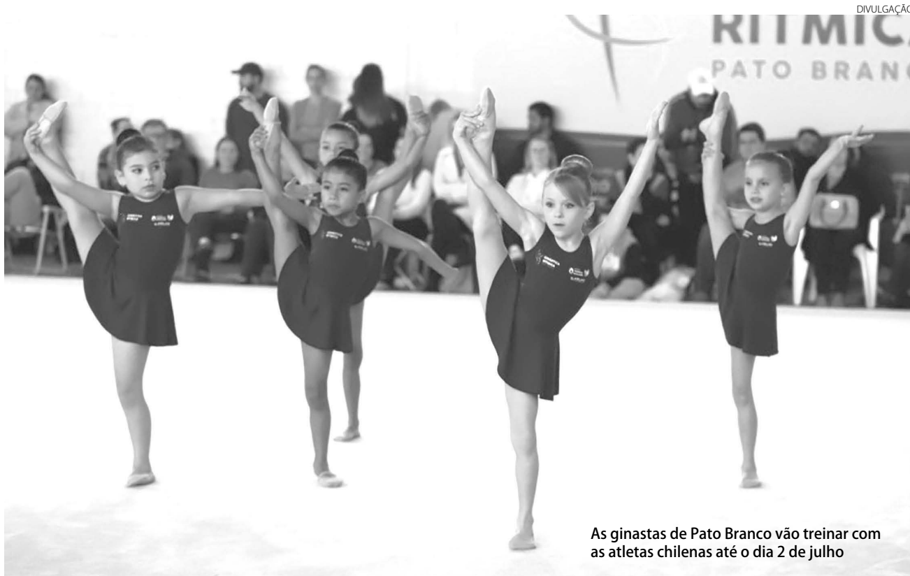
As ginastas de Pato Branco vão treinar com as atletas chilenas até o dia 2 de julho

Adenir Brocco com assessoria ade@diariodosudoeste.com.br