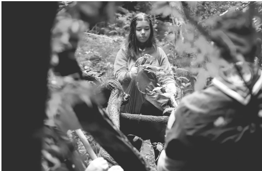
Programação sobre o meio ambiente segue durante a semana