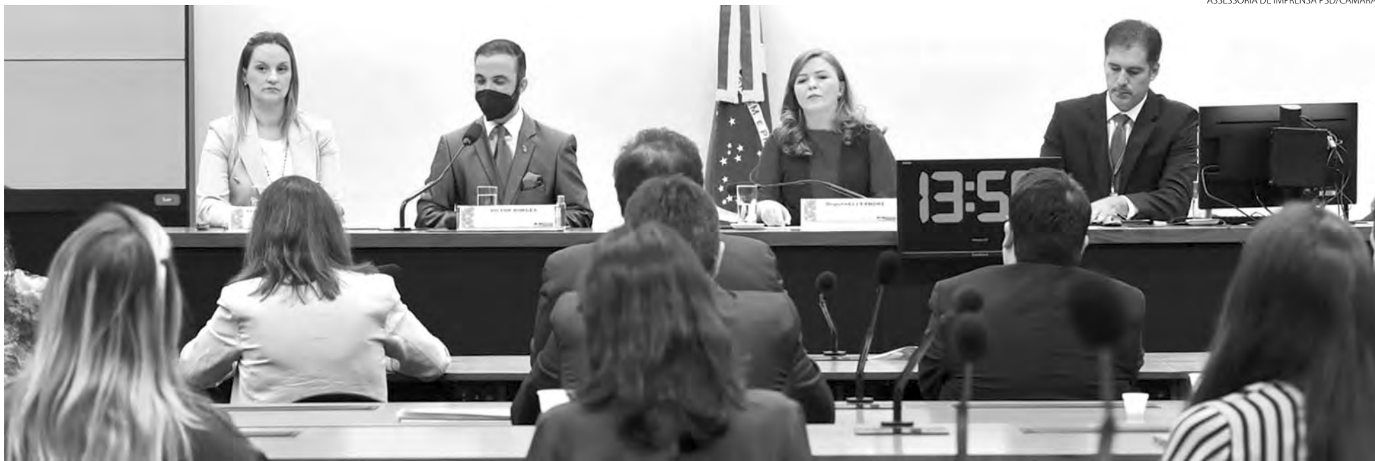
Novo debate sobre repasses ao Samu foi em audiência pública em Brasília

Municípios brasileiros pagam a conta do Samu, enquanto Governo Federal não faz reajuste desde 2013