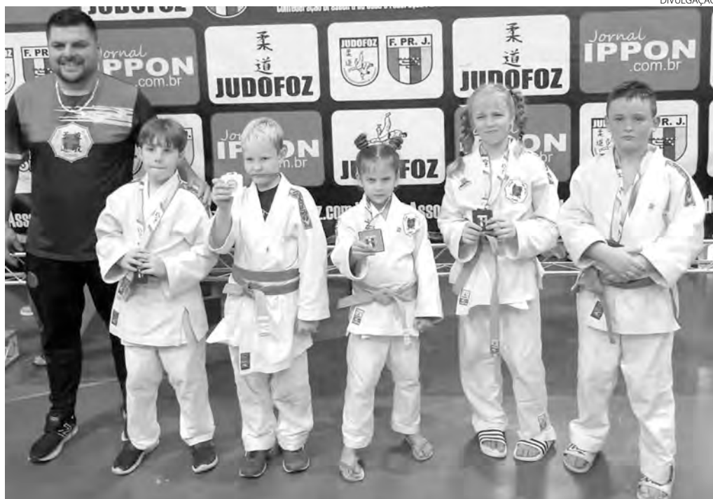
Os atletas da Academia Judô Sonkei conquistaram excelentes resultados no Estadual

Atletas da Academia Judô Sonkei, de Pato Branco, disputaram no último sábado, em Foz do Iguaçu, a primeira etapa do Campeonato Paranaense de Judô, categorias Sub-9 e Sub-11. Os cinco judocas pato-branquenses conquistaram excelentes resultados.