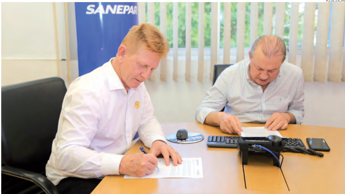
O termo foi assinado pelo prefeito na Sanepar, em Curitiba