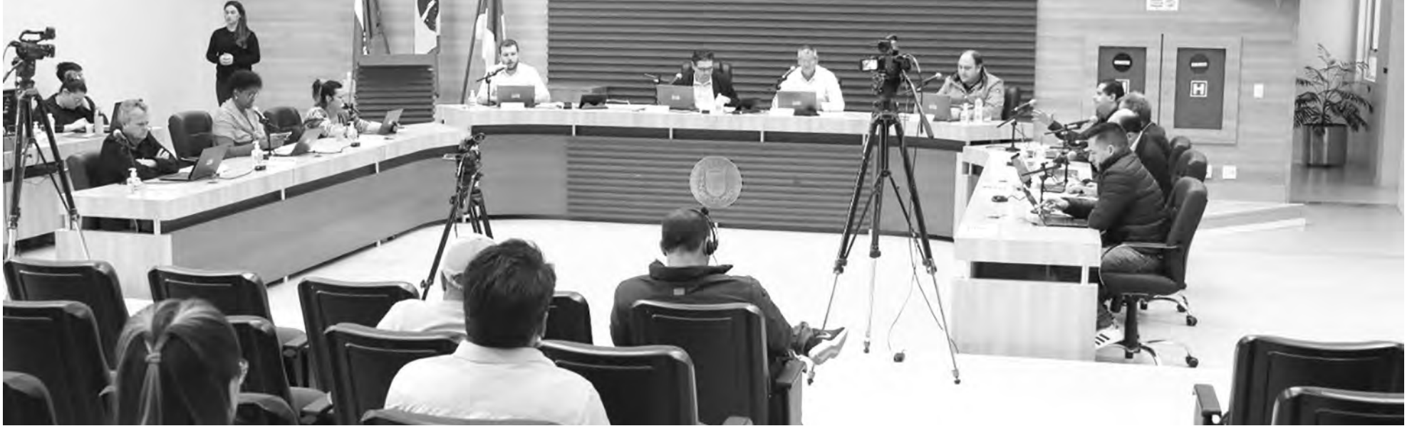
O Projeto de Lei aprovado pelo Legislativo vai possibilitar a regularização de imóveis junto a Secretaria de Planejamento Urbano