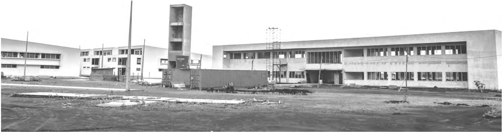
Parque Tecnológico de Pato Branco em setembro de 2013, quando as obras estavam paradas

Redação com Assessoria MPF redacao@diariosudoeste.com.br