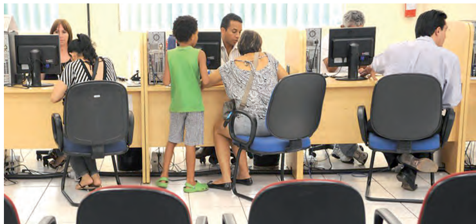
Implantação do sistema vai até 31 de janeiro de 2023

De acordo com a medida, o Serp vai conectar as bases de dados de todos os tipos de cartórios, será implantado e gerenciado pelos oficiais de registros públicos de todo o país, com adesão obrigatória. O operador nacional do sistema será uma entidade privada, na forma de associação ou fundação sem fins lucrativos, a ser regulamentada pela Corregedoria Nacional de Justiça, do Conselho Nacional de Justiça (CNJ).