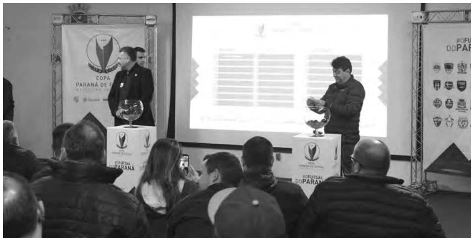
A competição conta com equipes das séries Ouro, Prata e Bronze