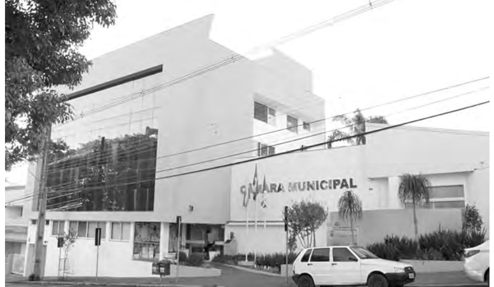
Segundo os parlamentares, a justificativa para a prorrogação do prazo é a demanda de trabalho que ainda será necessário realizar

Com o objetivo de promover e difundir o ciclismo na região, bem como arrecadar fundos para doar