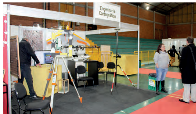
Primeira turma deve iniciar no início de 2023

O ingresso no curso de engenharia cartográfica e agrimensura será por meio do Sistema de Seleção Unificada (Sisu), assim como para os demais cursos de graduação da universidade.