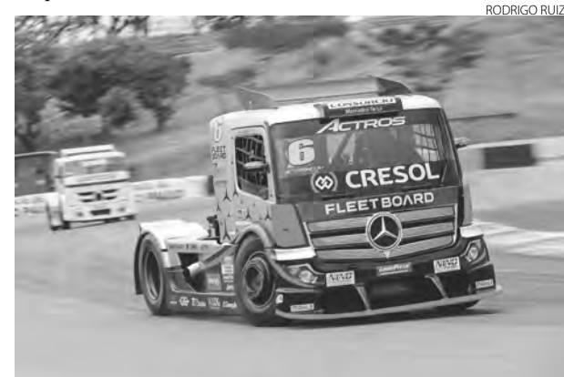
Wellington Cirino está apenas dois pontos atrás de Beto Monteiro

A programação em Goiânia terá dois treinos livres de 50 minutos na sexta-feira, às 11h e às 14h. No sábado, o terceiro treino livre acontece às 9h50 e o treino de classificação às 13h30. No domingo, a partir das 12h10, acontece a largada para as duas provas que marcam a quarta etapa. (Assessoria)