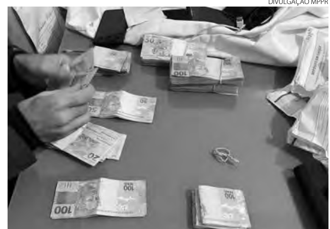
Foram apreendidos dinheiro, celulares e documentos, alguns deles falsificados

Os mandados foram cumpridos em seis Delegacias de Polícia, um escritório de advocacia, uma empresa e diversas residências em Curitiba, São José dos Pinhais, Piraquara, Toledo, Foz do Iguaçu, União da Vitória, Altônia, Guarapuava, Matinhos, Pontal do Paraná,