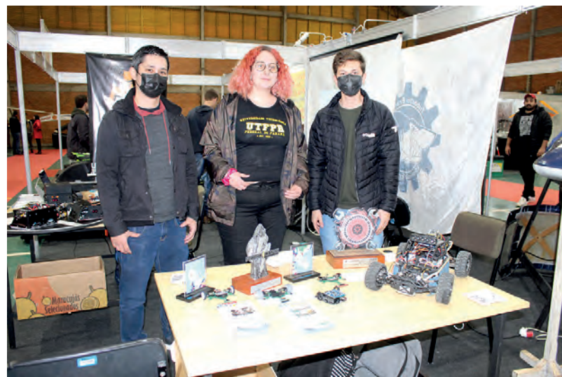
Integrantes do grupo de robótica Pato Bots, e alguns de seus projetos

O Pato Bots já possui dois troféus de segundo lugar na competição Robocore, além de um terceiro e um primeiro lugar na competição Face. Informações do grupo estão disponíveis no Instagram (@patobots).