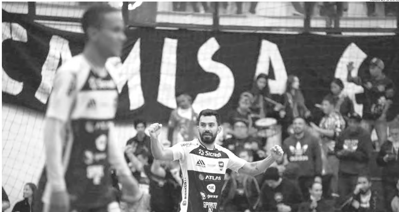
O Pato Futsal joga por vaga nas quartas de final da Copa do Brasil

O Pato Futsal tem mais um confronto decisivo na temporada. Nesta quinta-feira (2), o time pato-branquense enfrenta o Operário Laranjeiras, às 20h05, no Ginásio Dolivar Lavarda, em Pato Branco, por vaga nas quartas de final da Copa do Brasil Sicredi de Futsal 2022. Os ingressos estão à venda na Barbearia Vila Nova e no Café da Praça.