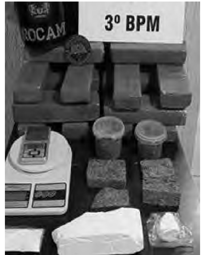
As drogas e demais objetos apreendidos pela equipe da Rocam

rante patrulhamento nas imediações do rio Paraná, equipe composta por agentes da Polícia Federal, militares da Marinha do Brasil e Exército Brasileiro, além do BPFron, encontraram mais de 500kg maconha depositada em ambiente de mata. Todo o ilícito foi apresentado na Delegacia de Polícia Federal em Guaíra-PR para as devidas providências.