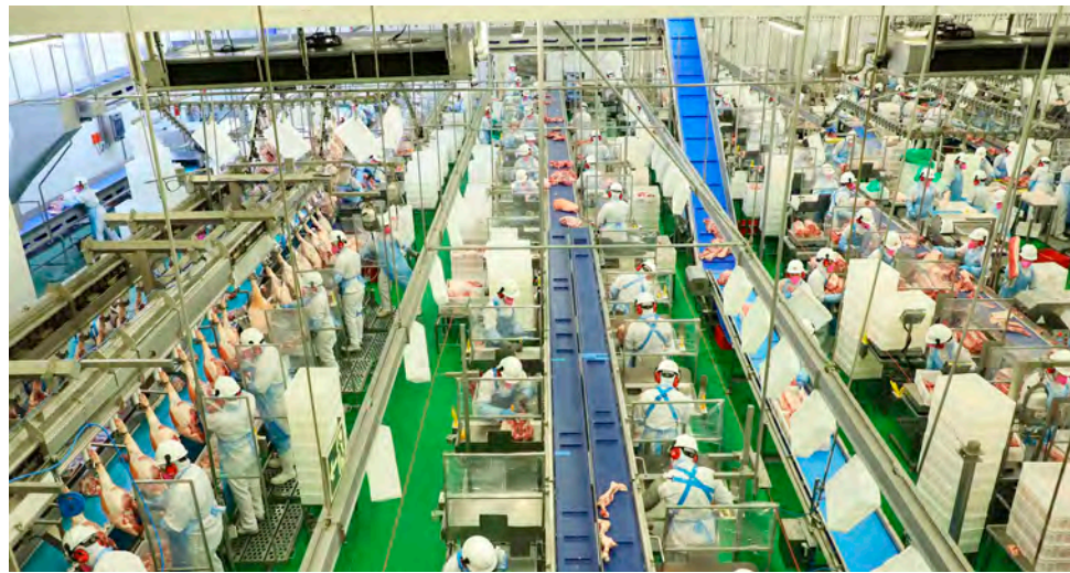
Excesso de oferta do setor gerou baixo preço nas prateleiras

Com essa crise se instalando na China, os produtores independentes do Brasil e as agroindústrias apostaram que a recuperação da China demoraria em torno de cinco anos e esses produtores brasileiros passaram a produzir suínos em maior quantidade para exportar a carne para a China e também assumir mercados antes atendidos por ela. Ainda segundo Dariva, no ano