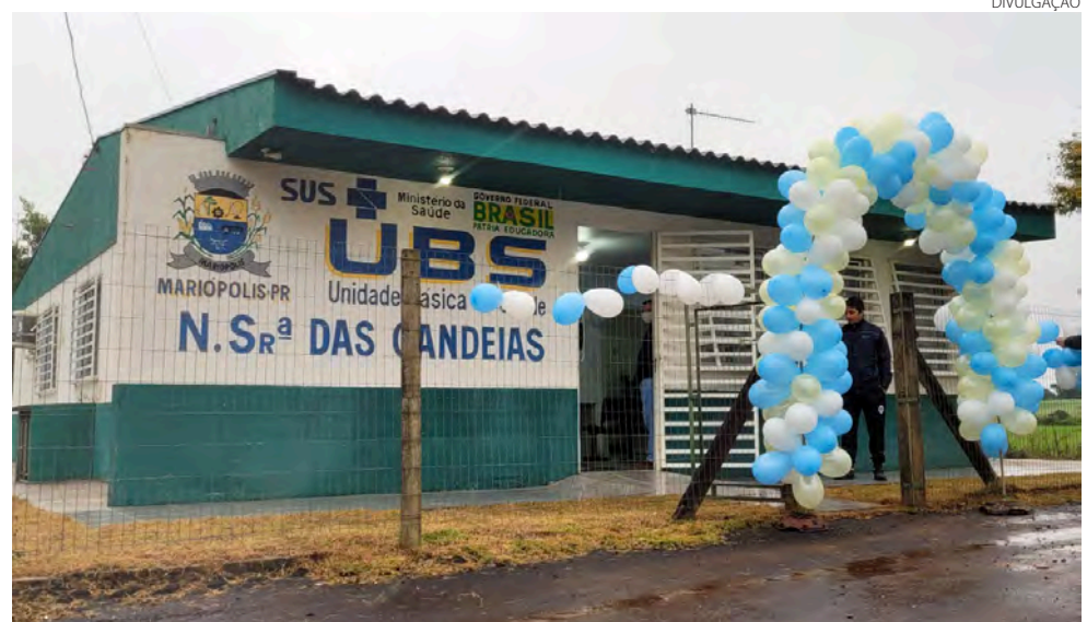
UBS fechou após início da pandemia

a administração reformou e reinaugurou a unidade, mas na pandemia ela acabou sendo desativada. “Neste período, infelizmente, o local sofreu diversos arrombamentos e fur-