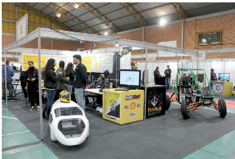
Projetos da universidade expostos na Feira de Profissões

Na exposição, acadêmicos e professores apresentam aos visitantes informações sobre o conteúdo dos cursos, sobre o mercado de trabalho, além de projetos e