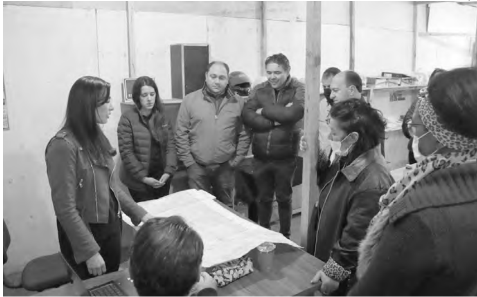
Nova previsão de conclusão da obra é para setembro

Não somente o valor da obra sofreu alterações, mas também o prazo de conclusão, o que em alguns momentos no auge da pandemia e covid-19,