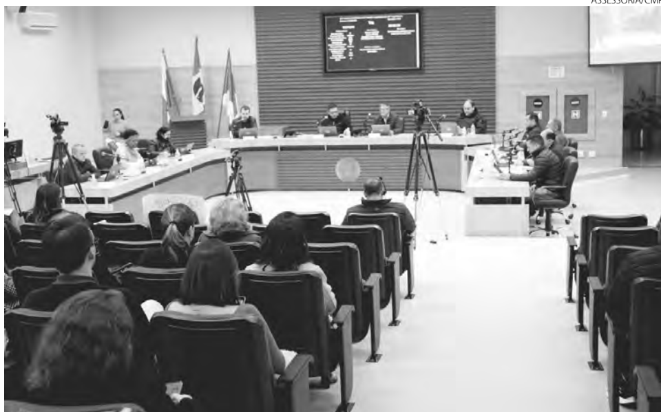
Através do requerimento os vereadores solicitam toda a documentação que envolve a construção da bacia de contenção

Na sessão de quarta (1º) também foi aprovado, em segunda votação, o Projeto de Lei nº 46, de 2022, de autoria do Executivo, que autoriza a abertura de crédito especial, no valor de R$ 3.599.999,98, para o pagamento de indenização