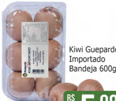
Kiwi Guepardo Importado Bandeja 600g