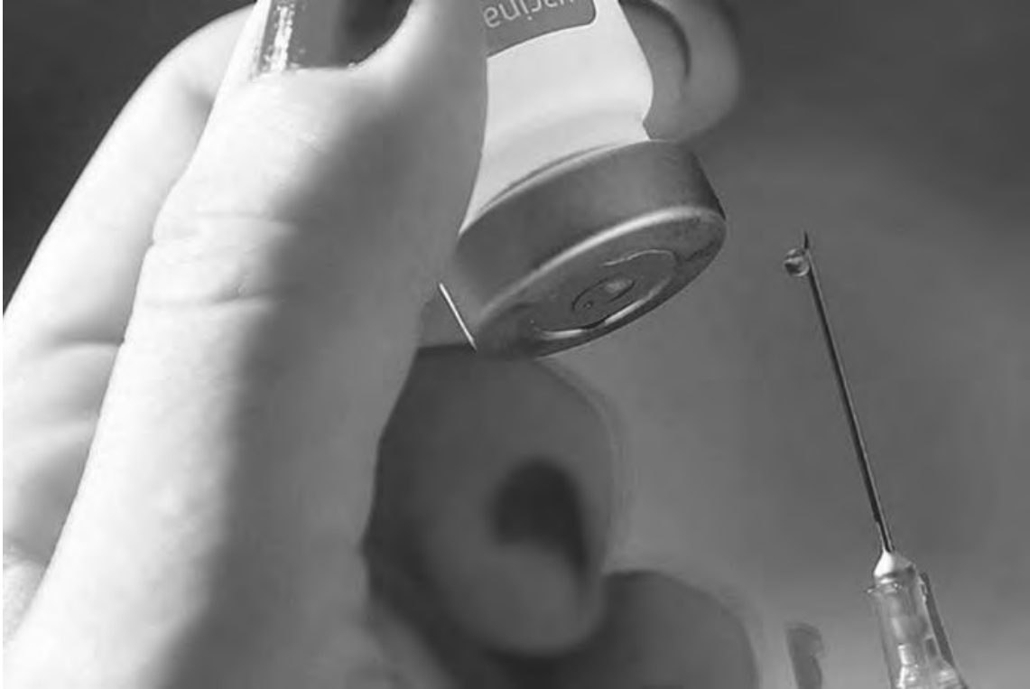
17,97% da população de Pato Branco recebeu a segunda dose do reforço