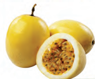
Maracujá Azedo Kg