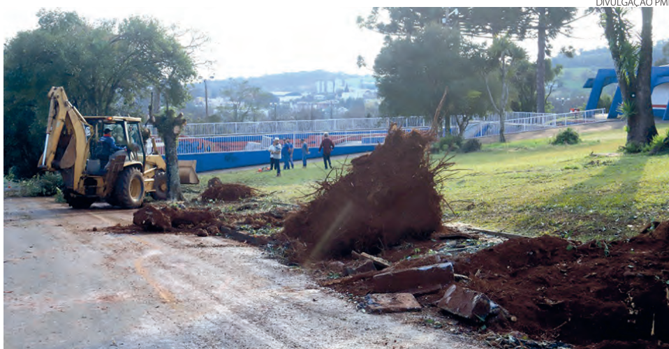
Somente no entorno do Ginásio Dolivar Lavarda, 58 árvores foram retiradas para substituição

Ainda de acordo com a arquiteta e urbanista, com a retirada das árvores que são qualificadas como impróprias, o Município deve em seguida iniciar a mudança da calçada, uma vez que as atuais lajotas estão em