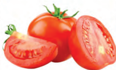
Tomate Longa Vida Kg