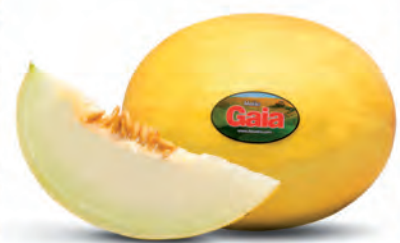
Melão Amarelo Gaia Kg