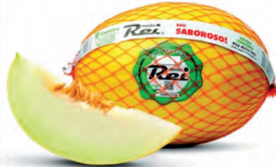
Melão Rei Kg