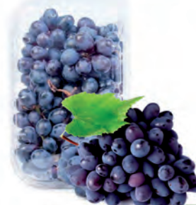
Uva Vitória Bandeja 500g