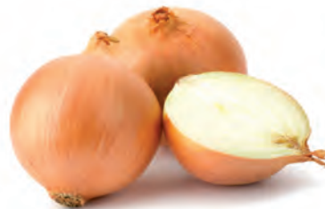
Cebola Importada Kg