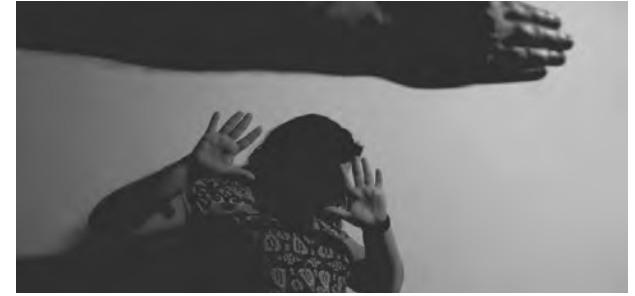
Brasil registrou um feminicídio a cada 7 horas, de acordo com Fórum Brasileiro de Segurança Pública