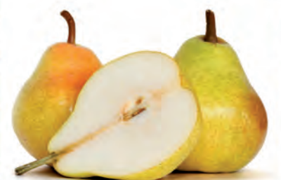
Pera Williams Importada Kg