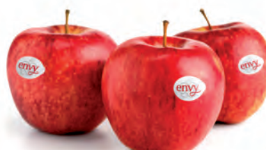
Maçã Envy Kg