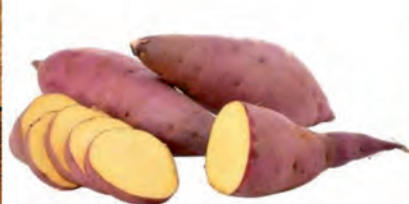
Batata Doce Roxa Kg