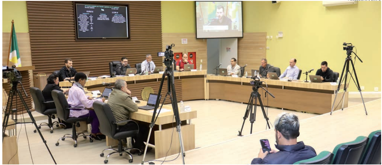
A aprovação do projeto em primeira votação ocorreu na sessão de segunda-feira (2)