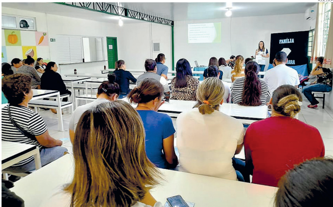
A Escola Municipal Irmã Neli, de Bom Sucesso do Sul, promoveu na quarta-feira (27) um encontro com os pais dos alunos para a entrega do novo uniforme escolar.