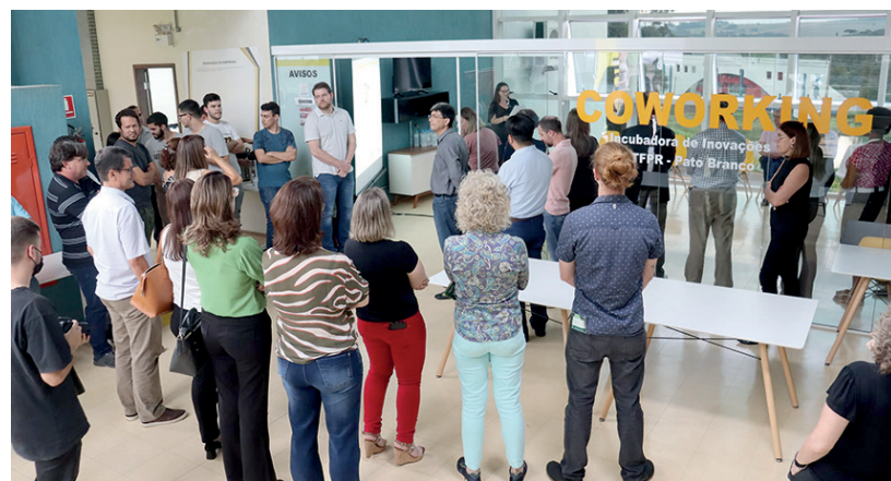
Centro foi inaugurado na última sexta-feira (29)