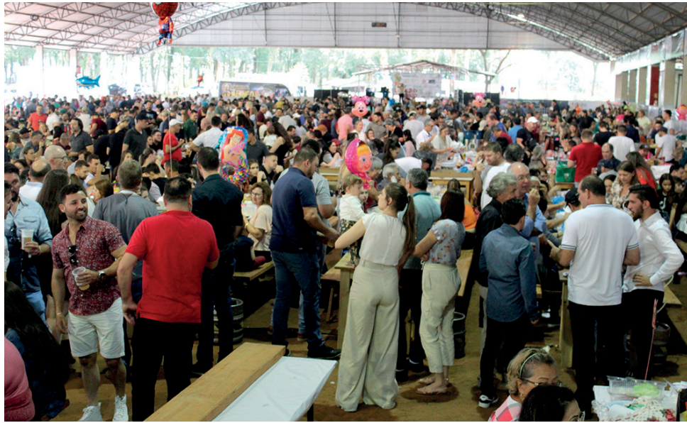
Para 17ª edição da Festa do Leitão Maturado, foram vendidos um total de 226 kits, suficiente para alimentar mais de 5,5 mil pessoas

Para o deputado federal Luiz Fernando Guerra, essa não é mais uma festa regional, mas estadual. "É um evento que mobiliza toda a comunidade, incluindo