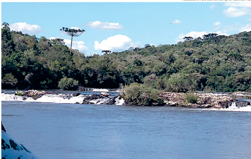
ASSESSORIA DE COMUNICAÇÃO CIVELÂNDIA

A professora afirma que todos os anos, entre março e abril, a equipe de gestão das unidades de conservação realiza o preenchimento de tábuas de avaliação