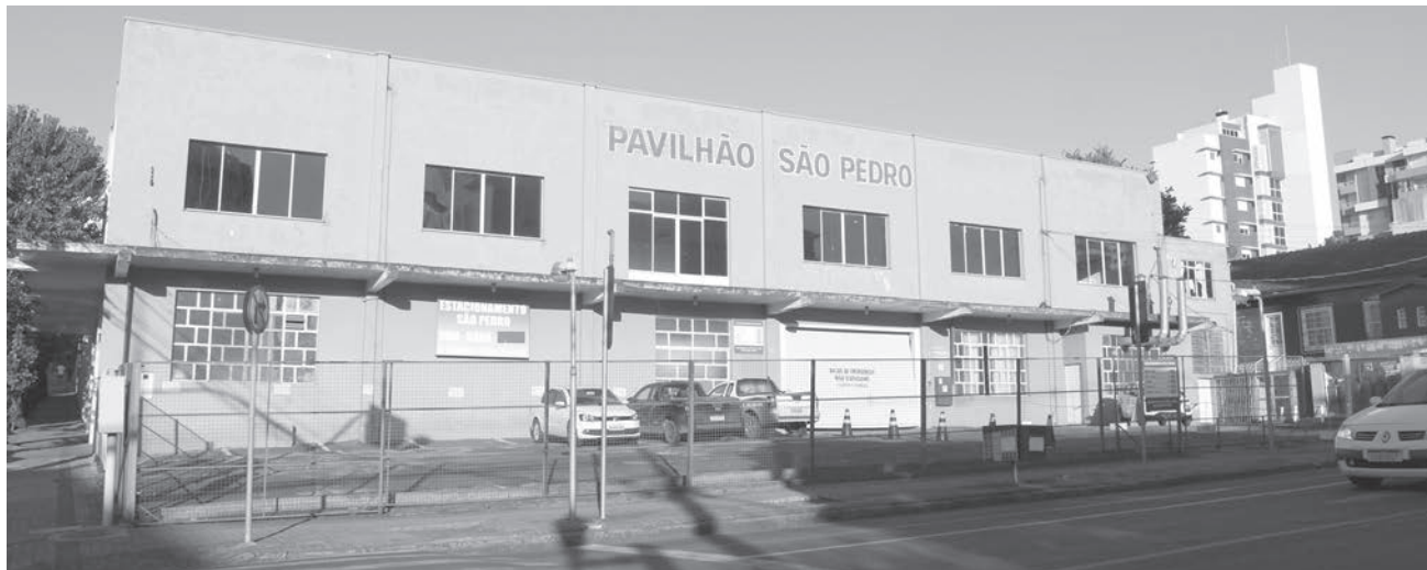
Grande parte da programação será no Pavilhão São Pedro