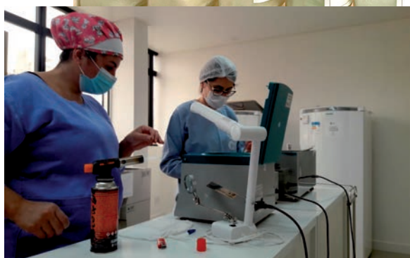
Coleta de Leite Humano

Você sabia que cerca de 200ml de leite humano pode alimentar até dez recém-nascidos? Sim! Diante disso que temos como objetivo intensificar o aumento de mãos doadoras a fim de abastecer os estoques dos Bancos de Leite Humano em todo nosso território brasileiro. O Brasil é uma referência internacional quando se fala em doação de leite humano, utilizando principalmente para a alimentação de bebês prematuros e com baixo peso internados em leitos neonatais.