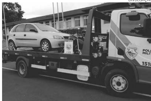
Os policiais recuperaram um carro, uma moto e diversos objetos que tinham sido furtados

Segundo a Polícia Militar, o furto ocorreu na tarde de domingo em uma residência. Os policiais levantaram informações com testemunhas sobre os possíveis autores do furto e durante as buscas encon-