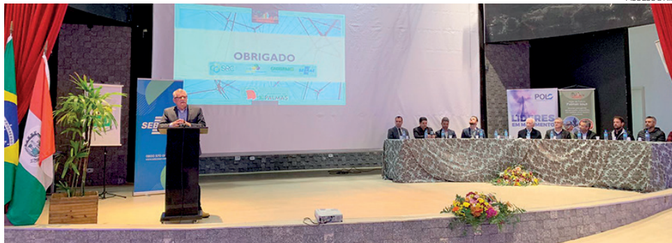
O lançamento da linha de crédito foi realizado na manhã dessa segunda-feira (23)

Deomar explicou que o recurso é oriundo do aporte feito ao Fundo Municipal, e que as cooperativas de crédito Sicoob Integrado, Sicoob Valcredi, Sicredi, Cresol e Uniprime irão operar