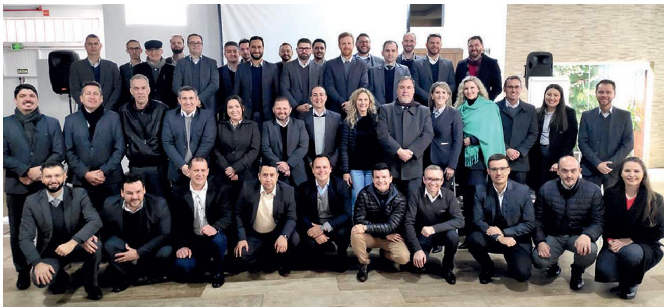
A equipe de gerentes da Sicredi Parque das Araucárias PR/SC/SP, que nesta semana esteve em Pato Branco participando de ações de integração e treinamento