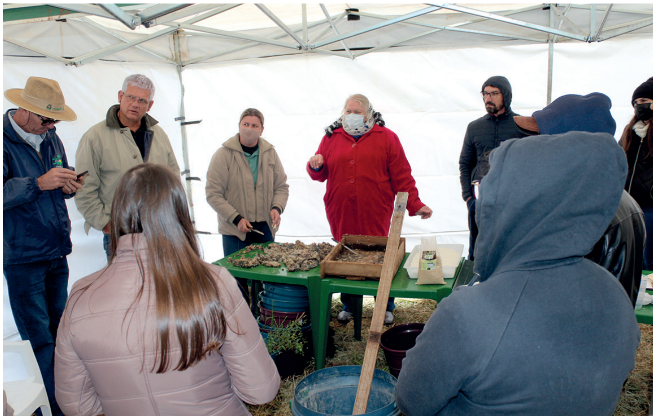
30 pessoas participaram da oficina