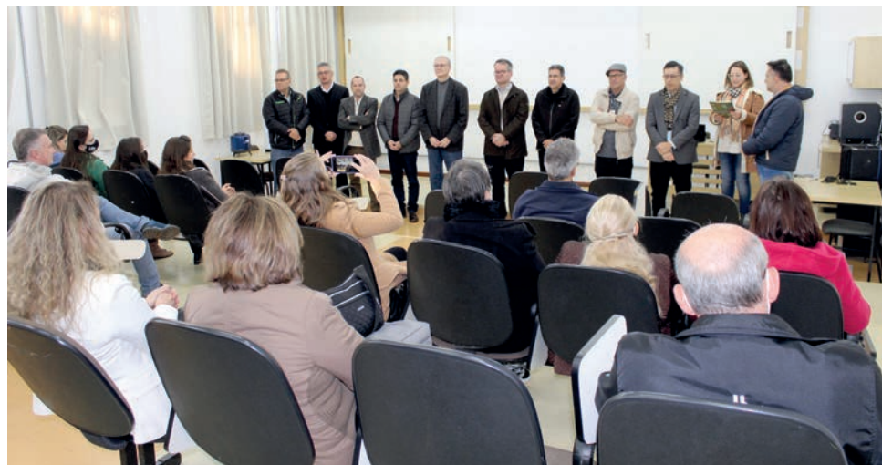
Repasse foi apresentado nessa terça-feira, na UTFPR

Além das universidades, os projetos contam ainda com a participação de agentes e entidades como o IDR-PR, Embrapa, Assessorar, UEL, UFPR, Unicamp, USP, Fiocruz e diversas outras do