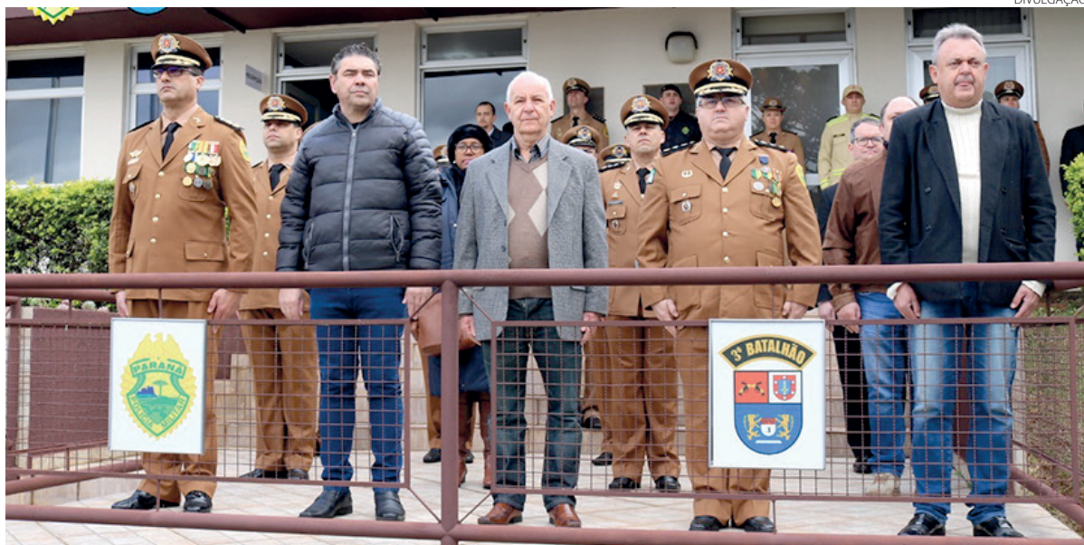
A solenidade contou com a presença de oficiais, praças, vereadores e amigos da Polícia Militar