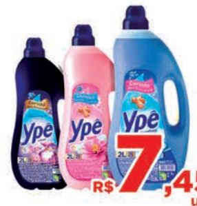
R$ 7,45 un.