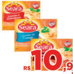
R$ 10,98 un.