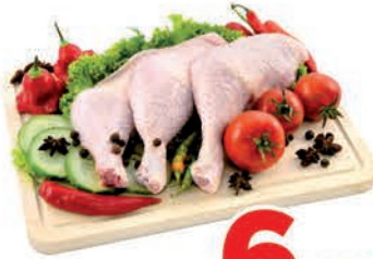
R$ 6,99 kg