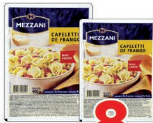
R$ 8,98 un.