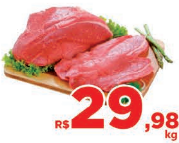
R$ 29,98 kg