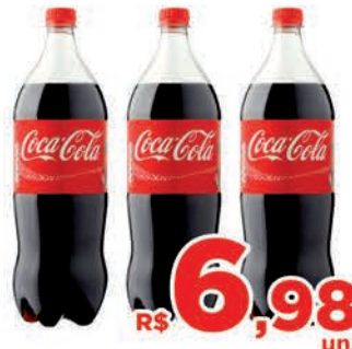
R$ 6,98 un.