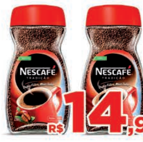
R$ 14,98 un.