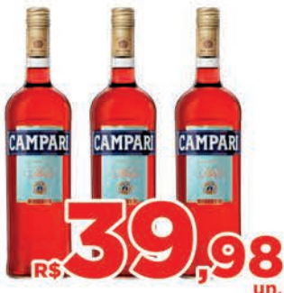
R$ 39,98 un.