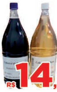
R$ 14,95 un.