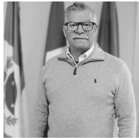
Elidio, de Mangueirinha; e Kosmos, de Palmas. Finalistas do Prêmio Prefeito Empreendedor

finalistas em 8 categorias: Desburocratização; Governança Regional e Cooperação Intermunicipal; Marketing Territorial e Setores Econômicos; Cidade Empreendedora; Empreendedorismo na Escola; Inovação e Sustentabilidade; Sala do Empreendedor; e Compras Governamentais.