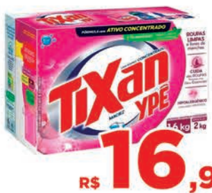
R$ 16,98 un.