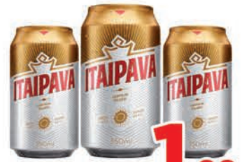
R$ 1,99 un.