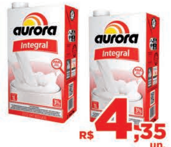
R$ 4,35 un.