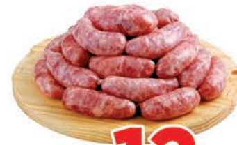
R$ 12,90 kg