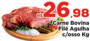
R$ 26,98 Carne Bovina Filé Agulha c/osso Kg R$ 21,98