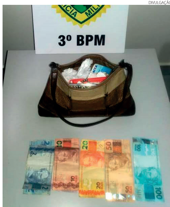
A bolsa e parte do dinheiro que foram recuperados pela Polícia Militar