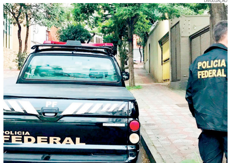
A operação foi no combate ao descaminho de vinhos argentinos para o Brasil

Os prejuízos causados pelo grupo são inestimáveis, pois há indícios de que praticam esse tipo de crime há muitos anos. Fora a sonegação de impostos e a concorrência desleal com os comerciantes que praticam esse comércio de forma legal, também existe risco ao consumidor, que, em eventual problema com o produto, não terá como assegurar seus direitos.