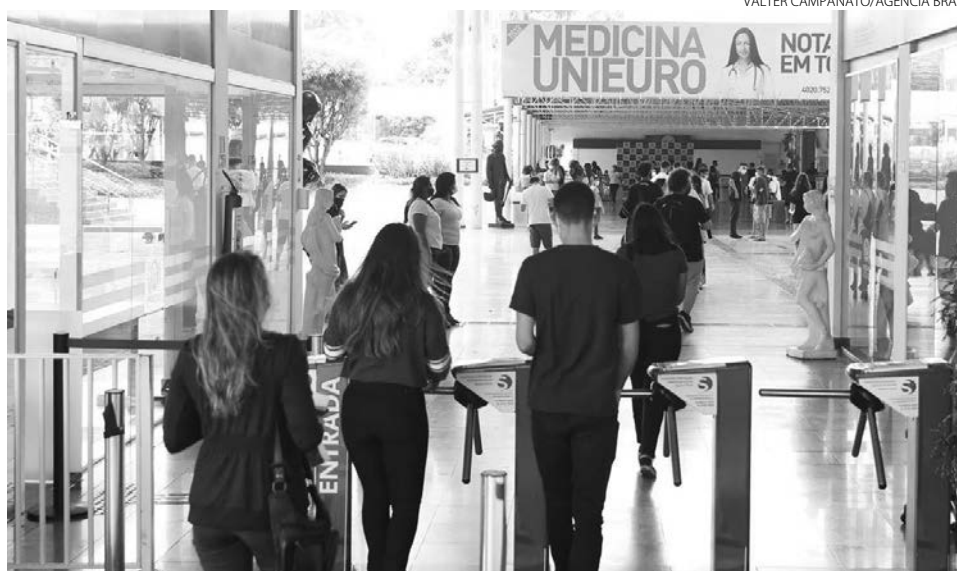
Taxa de inscrição poderá ser paga até dia 27