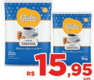
R$ 15,95 un.