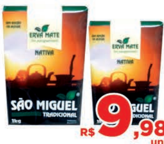
R$ 9,98 un.