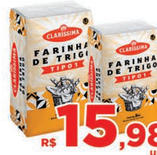
R$ 15,98 un.