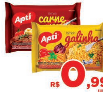
R$ 0,99 un.