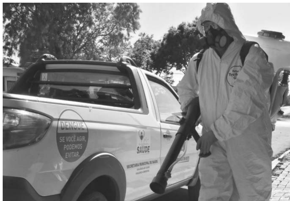
Até ontem, 27 casos de dengue foram confirmados