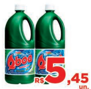
R$ 5,45 un.

46 3225-4911 - Pato Branco | Horário de atendimento: Segunda a sábado: 8h às 20h | Domingo das 8h às 12h