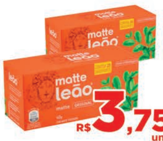
R$ 3,75 un.