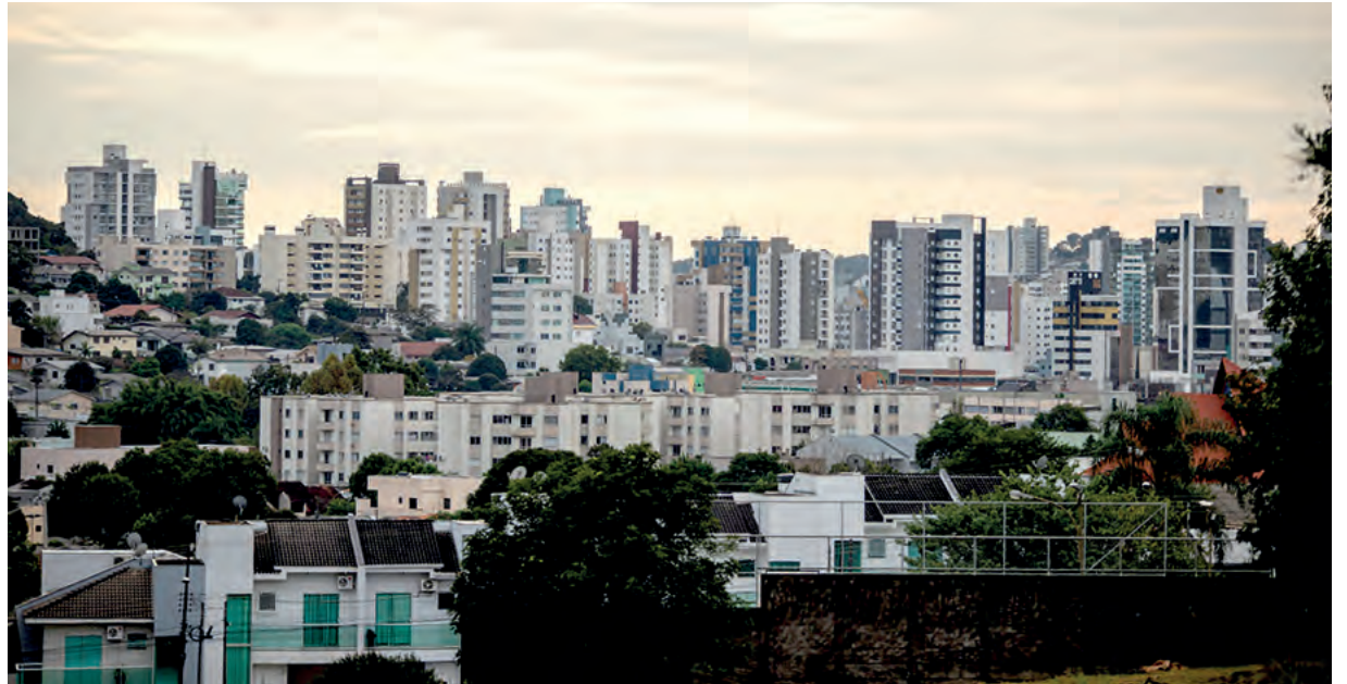
Ao todo, processo de seleção estão com quatro vagas disponíveis