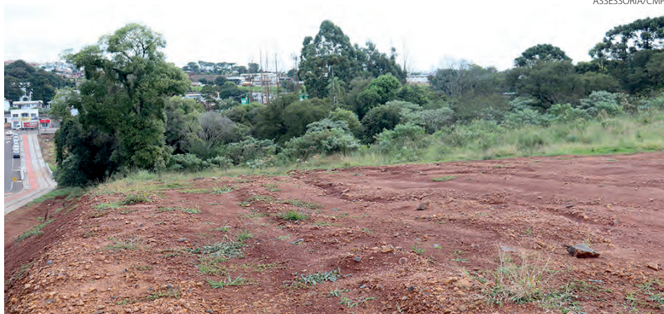
Terreno público apontado no Projeto de Lei a ser doado ao ISSAL para construção do Hospital Materno Infantil

No documento enviado, o MP descreve o que são “bens públicos”, de acordo com o Art. 99 do Código Civil, e envia suas considerações explicando que é dever do Ministério Público “a defesa da ordem jurídica, do regime democrático e dos interesses sociais e individuais indisponíveis”; bem como, “a função institucional de zelar pelo efetivo res-