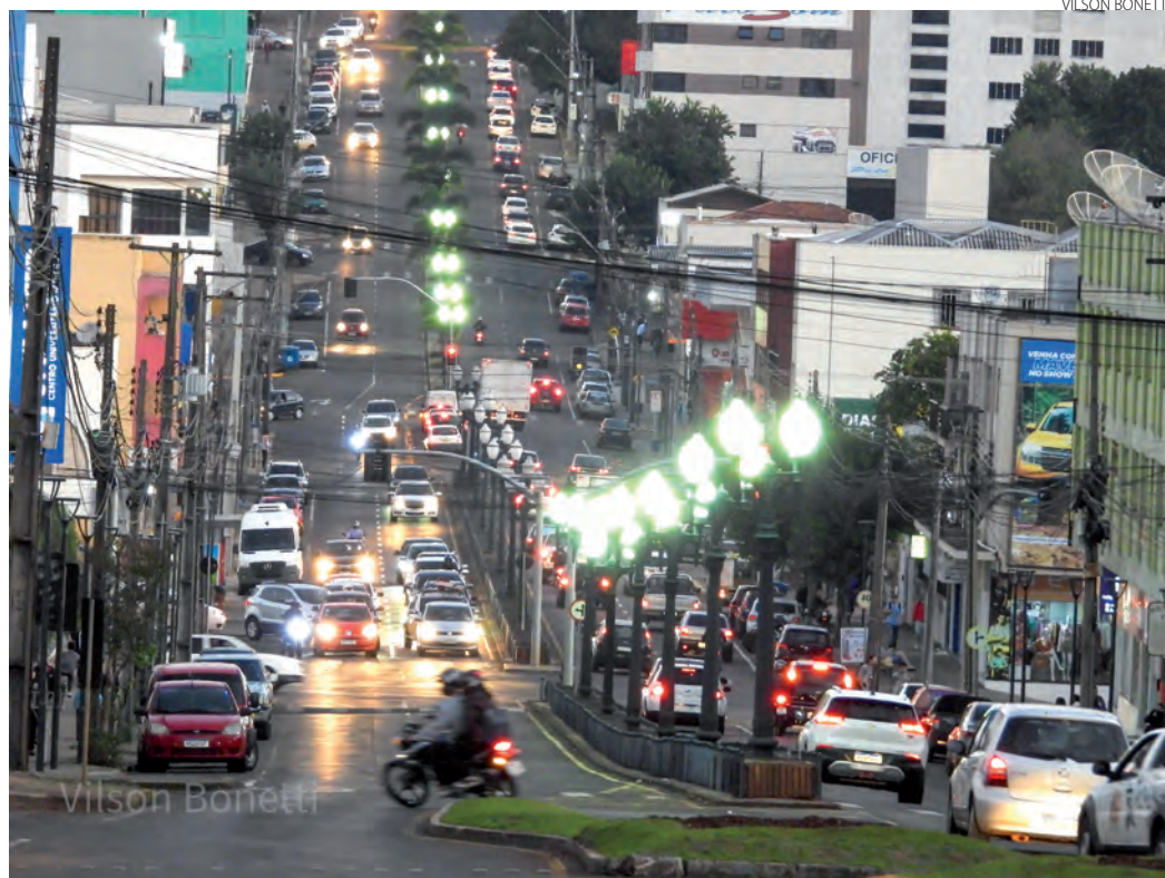
As luzes do anoitecer de segunda-feira (9), na avenida Tupi, baixada industrial, em Pato Branco