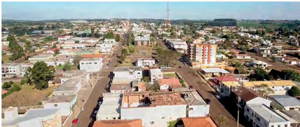
O auxílio beneficiará todos os servidores municipais com o valor de R$ 300,00