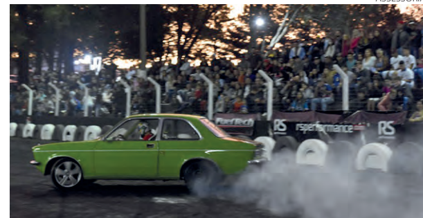
Evento contou com a participação de competidores da região