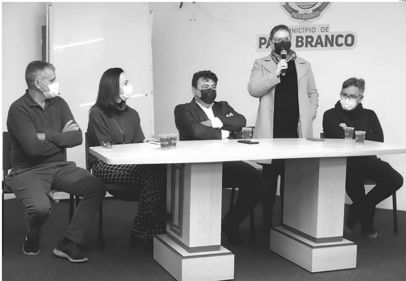
Anúncio dos recursos foi realizado na manhã desta terça-feira (24)

“Investimentos serão na construção, reforma e ampliação de Unidades Básicas de Saúde”