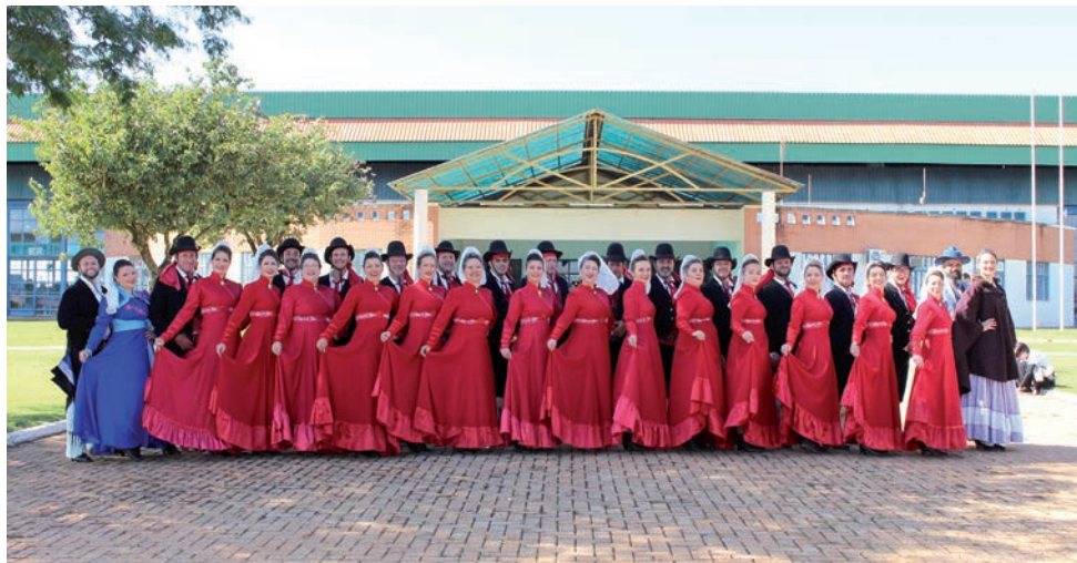
Invernada veterana conquistou o terceiro lugar e melhor entrada