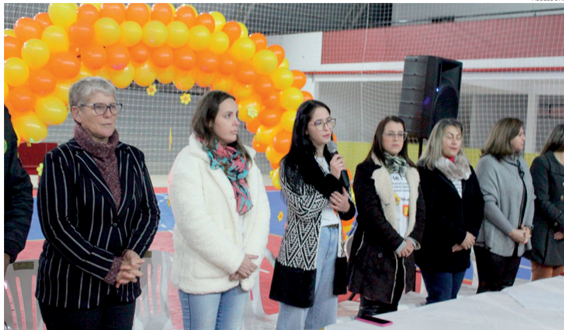
Ação foi promovida no ginásio Ademir Zílio, em Vitorino

A mãe inclusive autorizou o uso da imagem de sua filha no vídeo educativo produzido pela equipe da Secretaria de Desenvolvimento Social, como ferramenta de informação durante as