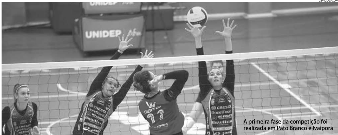
A primeira fase da competição foi realizada em Pato Branco e Ivaiporã

A primeira etapa do Campeonato Paranaense Adulto, Série B, foi realizada no final de semana, em Pato Branco e Ivaiporã. Com quatro rodadas no feminino e três no masculino, as equipes se enfrentaram em jogos equilibrados mostrando que a segunda etapa, marcada para agosto nas cidades de Paranaguá e Ivaiporã, será ainda mais disputada.