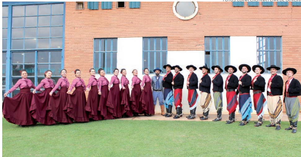
Invernada adulta ficou com o terceiro lugar e melhor entrada