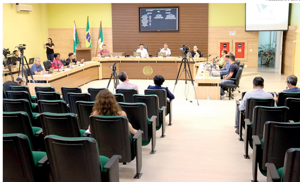
A Câmara Municipal de Pato Branco aprovou recentemente o Projeto de Lei nº 203, de 2021, de autoria do Executivo