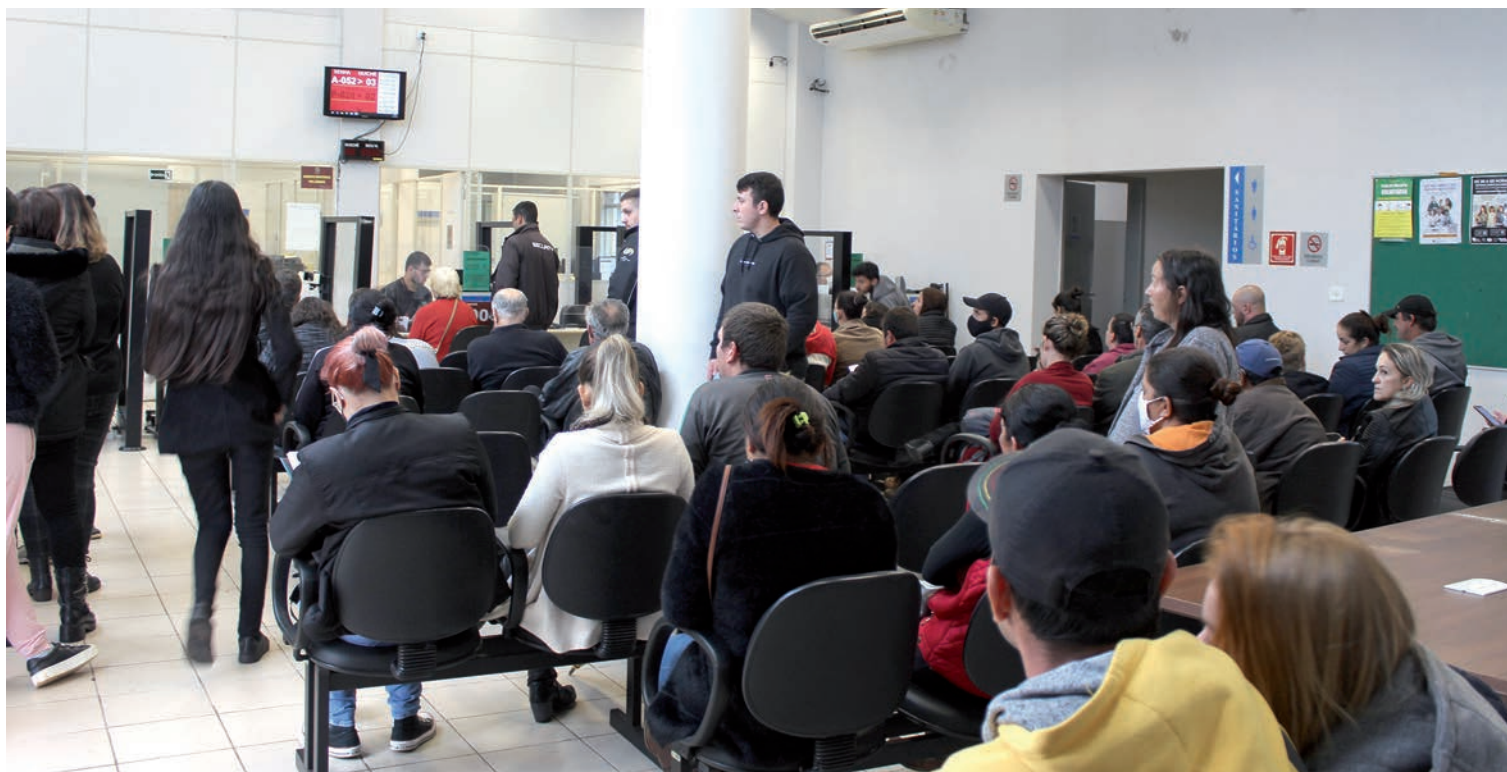
No último dia para a regularização eleitoral, que permite a população votar nas eleições de 2022, a procura foi alta no Cartório Eleitoral da Comarca de Pato Branco.