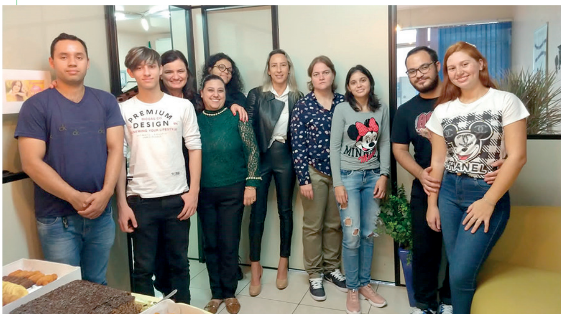
Parabéns estudantes da Perfil RH, pelo cerimonial de entrega de certificados dos cursos no sábado (30). Desejamos que continuem no caminho do sucesso: Gratidão a todos Matrículas abertas para todos nossos cursos www.perfilrh.net.br