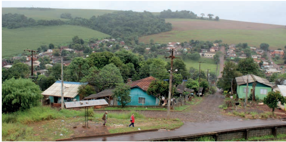
Pelo menos 691 famílias serão beneficiadas com a ampliação

As obras integram o montante de cerca de R$ 89 milhões, destinados as obras de saneamento básico em Pato Branco, que incluem ainda a construção de uma nova Estação de Tratamento de Esgoto (ETE) na