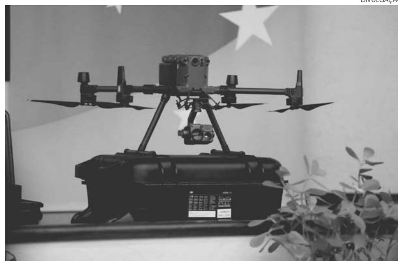
Três modelos de drones foram adquiridos para atender os diferentes perfis de unidades penais

Segundo ele, a aquisição dos equipamentos faz parte de uma sé-