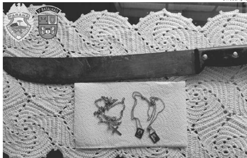
O facão e parte dos objetos recuperados pela Polícia Militar

A equipe policial prendeu o homem por receptação. Ele foi encaminhado, juntamente com os objetos recuperados, à Delegacia da Polícia Civil para as providências cabíveis ao fato.