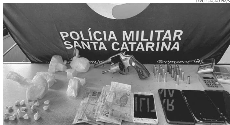
A droga, arma, munições e demais objetos que estavam com os acusados de cárcere privado

Segundo a Polícia Militar de Santa Catarina, familiares receberam mensagens das vítimas, de 15, 17 e 22 anos, pedindo ajuda, relatando que estavam sendo mantidas em cárcere privado sob ameaças de morte com uso de arma de fogo. Elas tinham saído de Palmas, no dia 20 deste mês, com o pretexto de passar o fim de semana na casa de uma amiga, quando deixaram de manter contato.