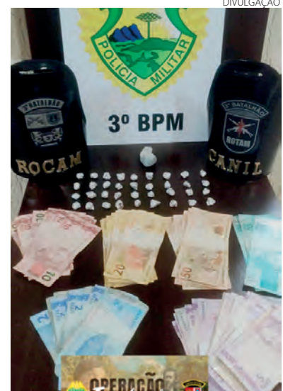
O crack, a maconha e o dinheiro apreendidos durante a ação policial

em flagrante por tráfico de drogas. Elas foram entregues, juntamente com o crack e a maconha, na Delegacia da Polícia Civil para as devidas providências. Já o rapaz, que estava com duas pedras de crack, foi encaminhado para a confecção de um Termo Circunstanciado. (AB)