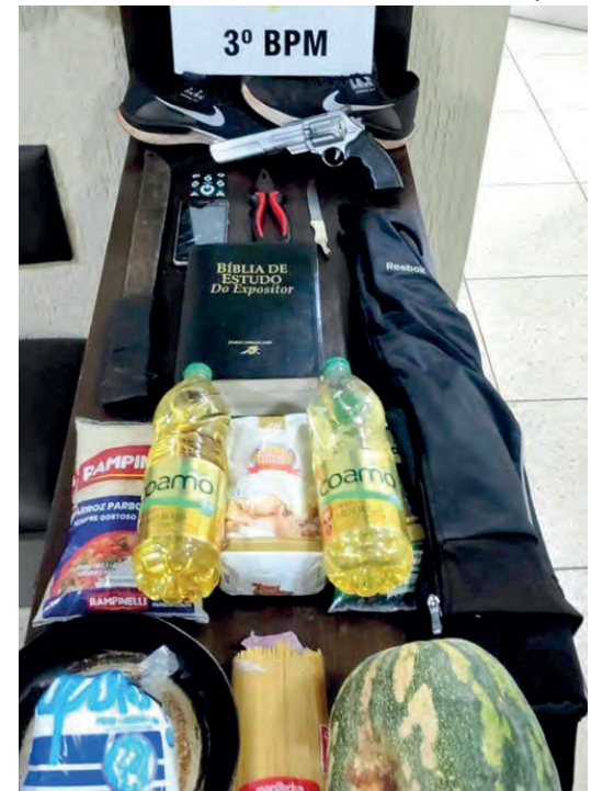
A arma de brinquedo e os alimentos e demais objetos que estavam com o investigado