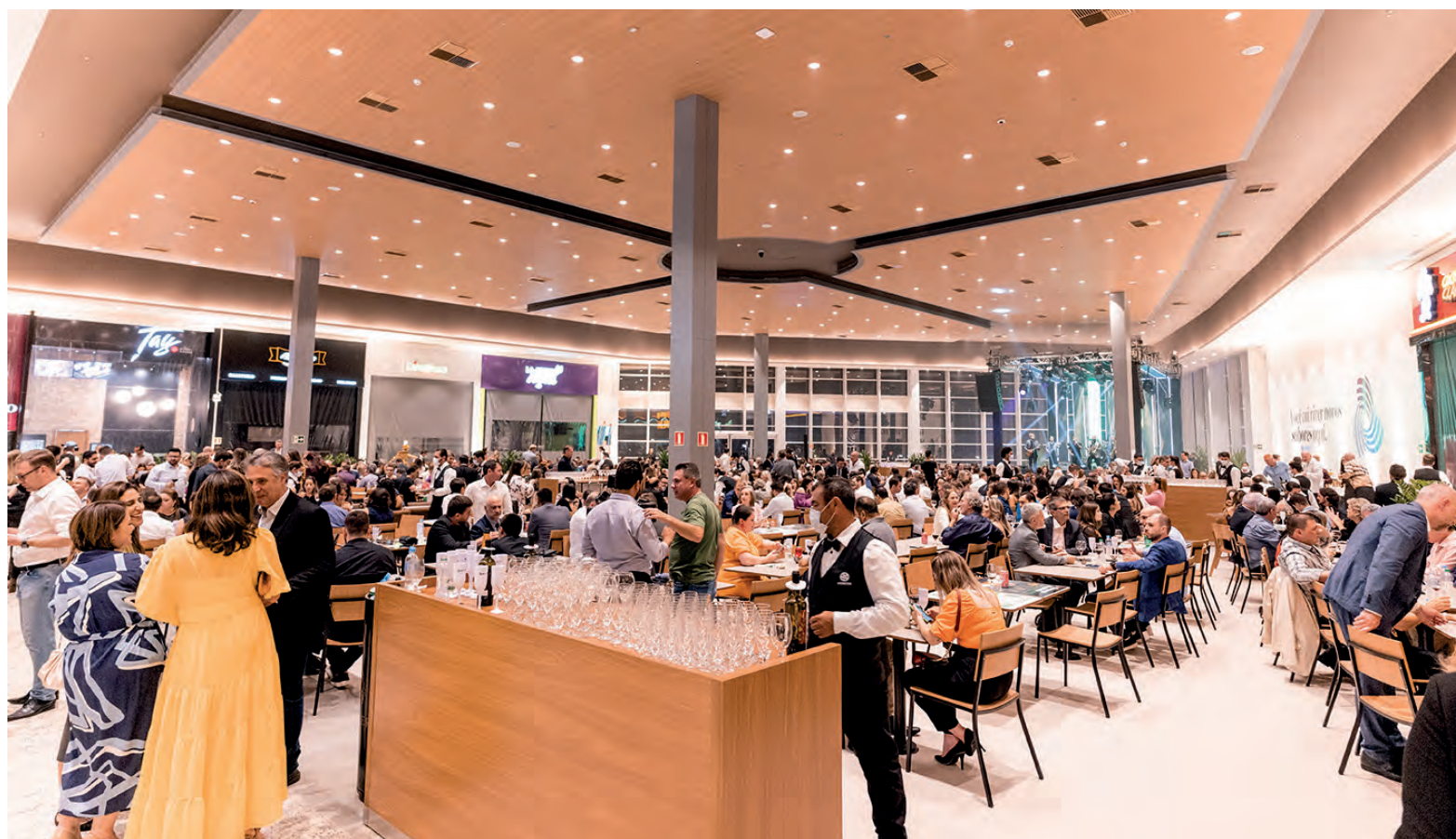
Praça de alimentação, tem capacidade para atender 900 pessoas

O horário de atendimento do PB Shopping é de segunda à sábado, das 11h às 22h. No domingo, as lojas atendem ao público das 13h às 21h, enquanto a praça de alimentação estará aberta das 11h às 22h.