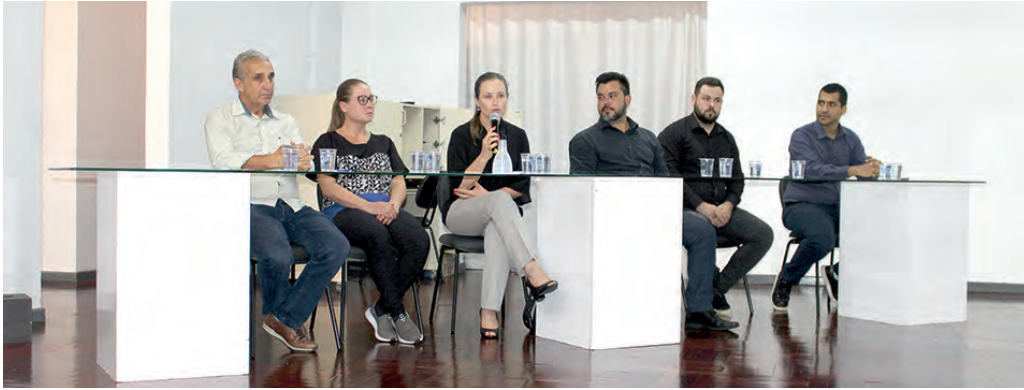
Lideranças locais participaram do evento

Nelson da Luz Junior nelson@diariosudoeste.com.br