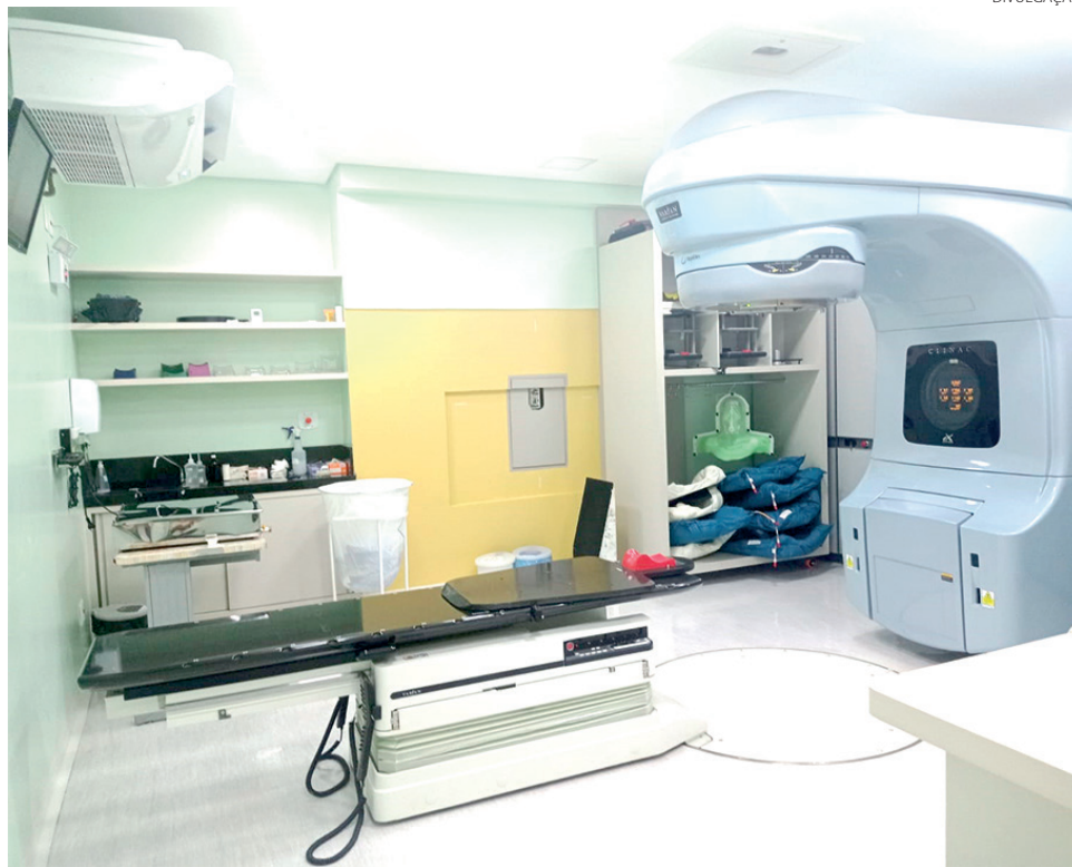
Acelerador linear traz maior eficácia ao tratamento do câncer

O acelerador linear possibilitou ao Hospital do Câncer de Pato Branco a realização da radiocirurgia. A primeira vez que o procedimento foi realizado no município foi em 30 de dezembro de 2021. “Apesar do nome ‘cirurgia’, ela é uma técnica não invasiva,