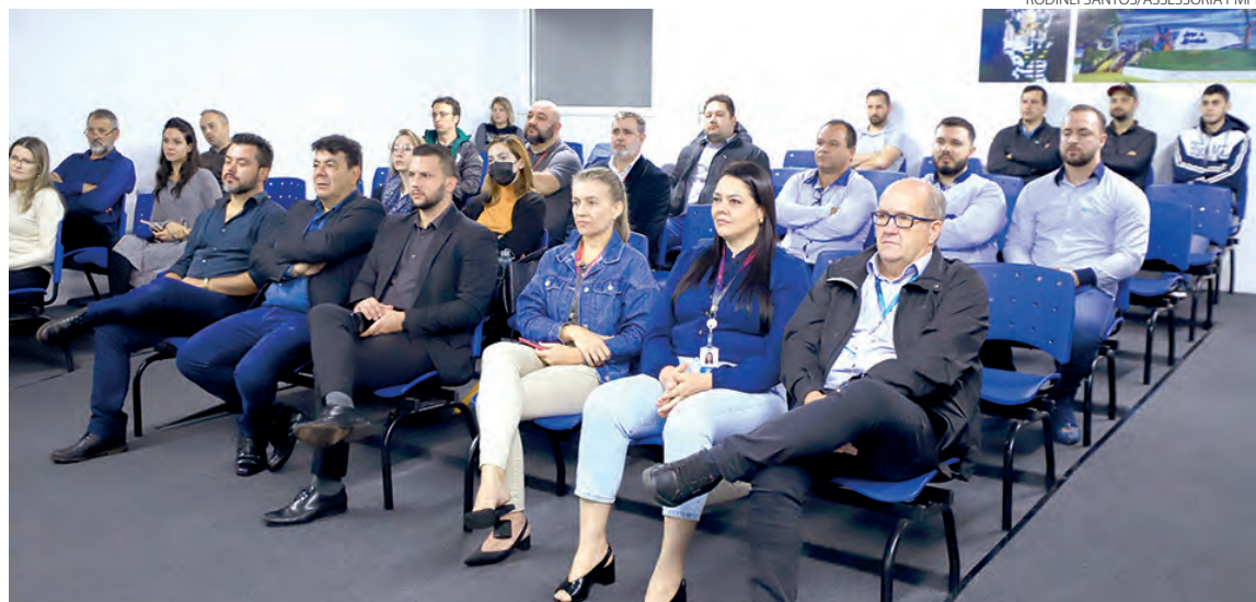
Até o final de 2024, devem ser ofertados aproximadamente 30 cursos