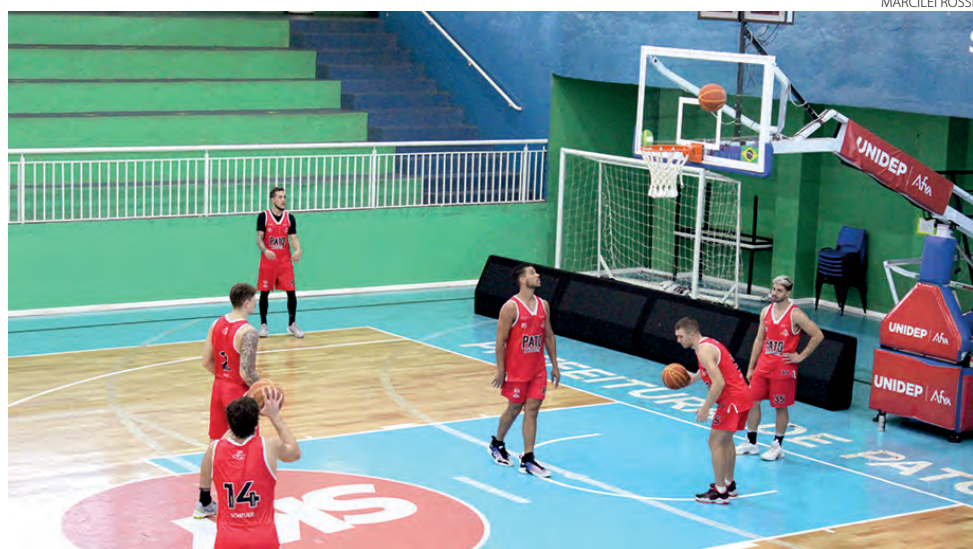
O Pato Basquete quer vencer os dois jogos em casa para não depender de outros resultados

Os dois jogos vão definir a classificação do Pato Basquete aos playoffs do NBB, sendo confrontos diretos. O time pato-branquense ocupa a 10ª colocação, com 11 vitórias em 30 jogos. O Caxias vem em seguida, com 10 vitórias, em 28 partidas e o Corinthians é o 12º colocado, com dez vitórias em 29 confrontos. Como os adversários tem jogos a menos, o Pato Basquete precisa vencer os confrontos diretos para se classificar sem depender de outros resultados.