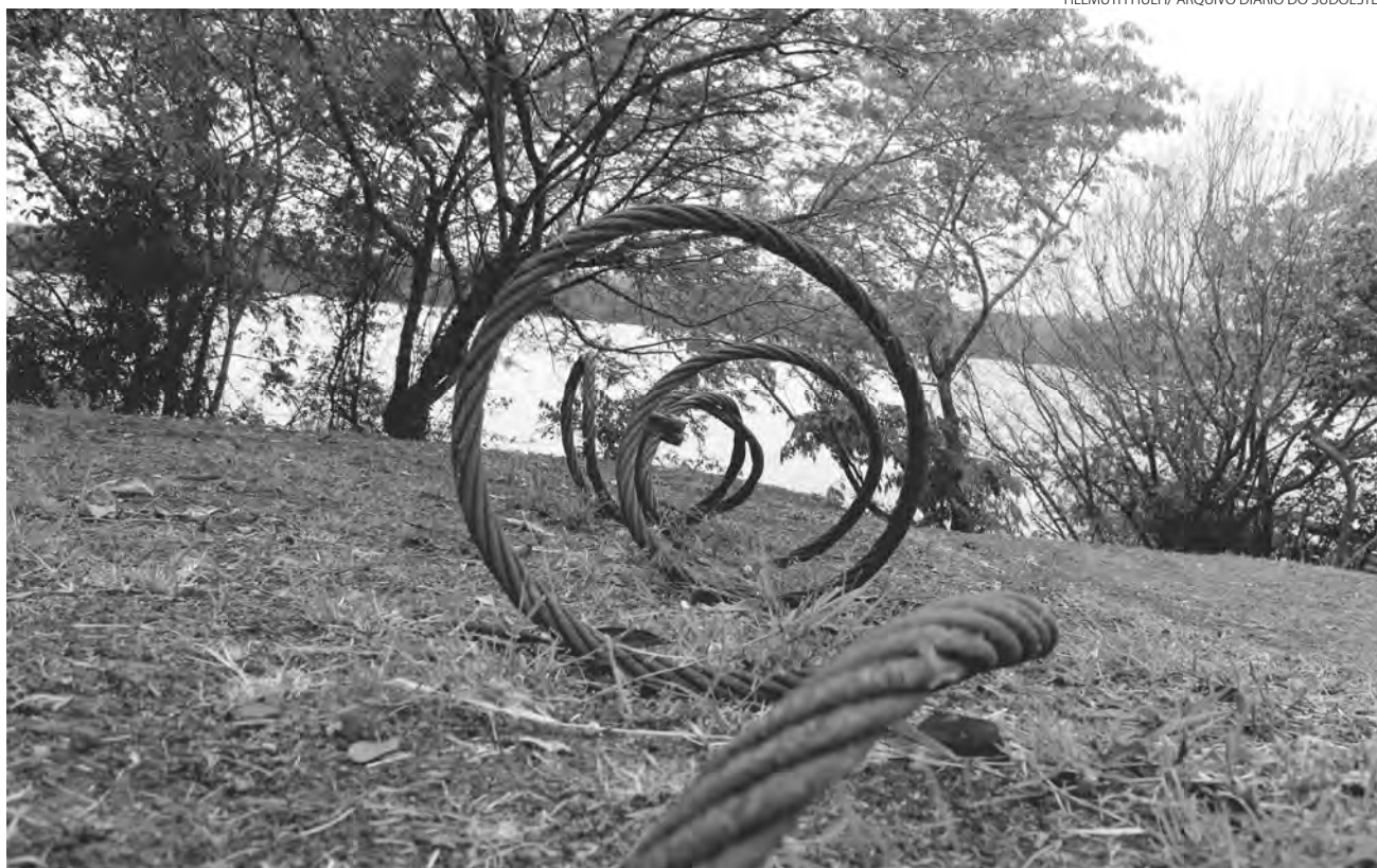
Em Capanema, na região do antigo Porto Moisés Lupion, hoje o turismo é de aventura

As represas formadas com a construção das usinas hidroelétricas ao longo do