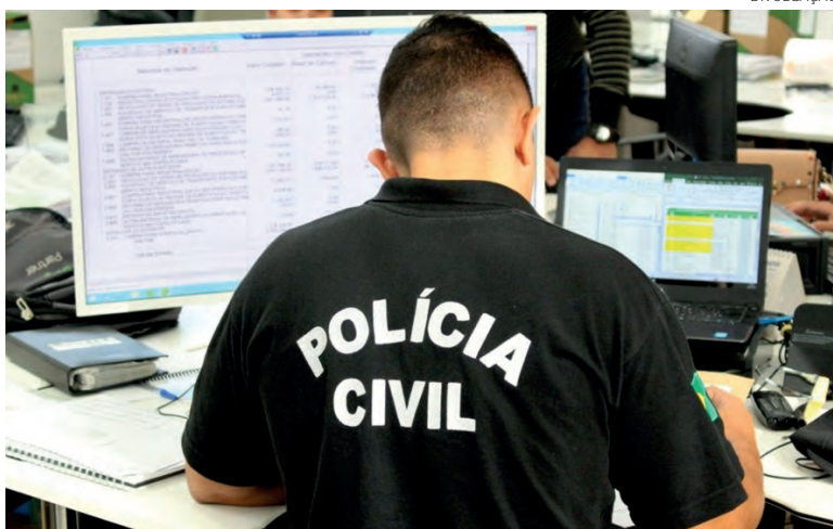
Desde a sanção da lei, há um ano, foram registradas 4.570 ocorrências deste crime no Paraná

A Polícia Civil solicita que, caso o cidadão sinta-se ameaçado ou perceba que está sendo perseguido, que vá até a delegacia mais