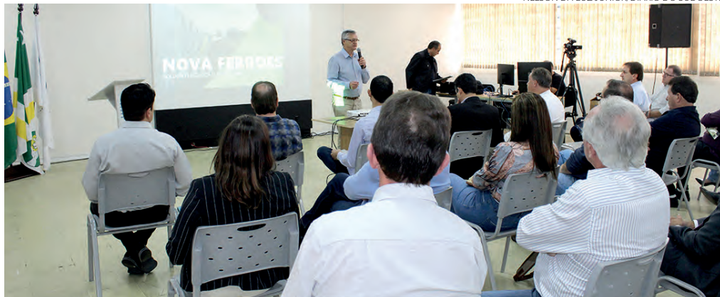
Encontro aconteceu na Casa da Indústria, e reuniu lideranças locais