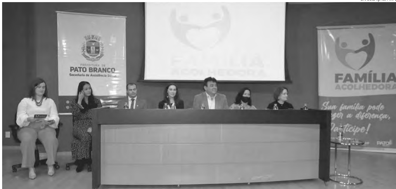
Lançamento aconteceu no auditório do Sesc e contou com a presença de autoridades locais

Um dos objetivos do programa é possibilitar que crianças e adolescentes recebam atendimento individualizado e possam se desenvolver em convívio familiar e em comunidade. Com isso, as famílias devem proporcionar um ambiente seguro e acolhedor, além de amor e carinho, para que vi-