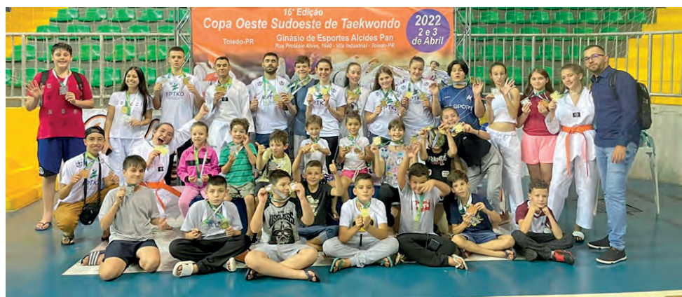
Equipe somou 341 pontos em competição que reuniu atletas de vários municípios

Ao todo foram 37 medalhas de ouro, 20 de prata e quatro de bronze. O evento foi realizado pela Federação Paranaense de Taekwondo e abre as portas