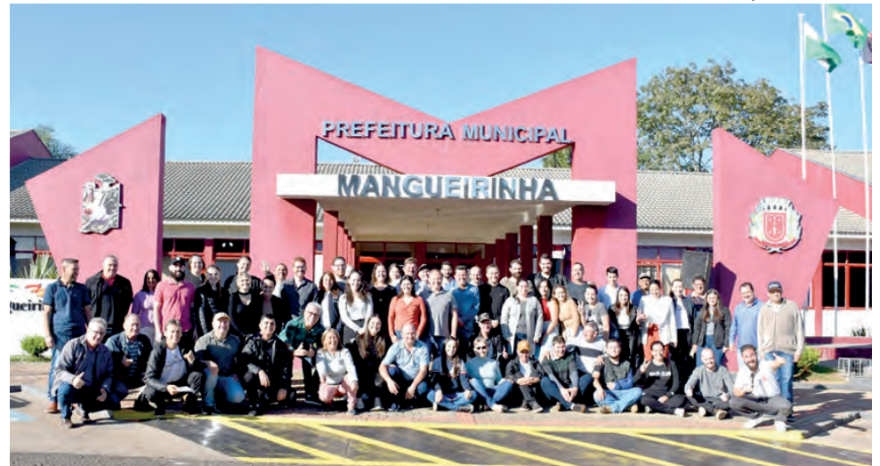
Mais de mil documentos foram depositados no novo monumento, entre eles, o registro dos servidores municipais