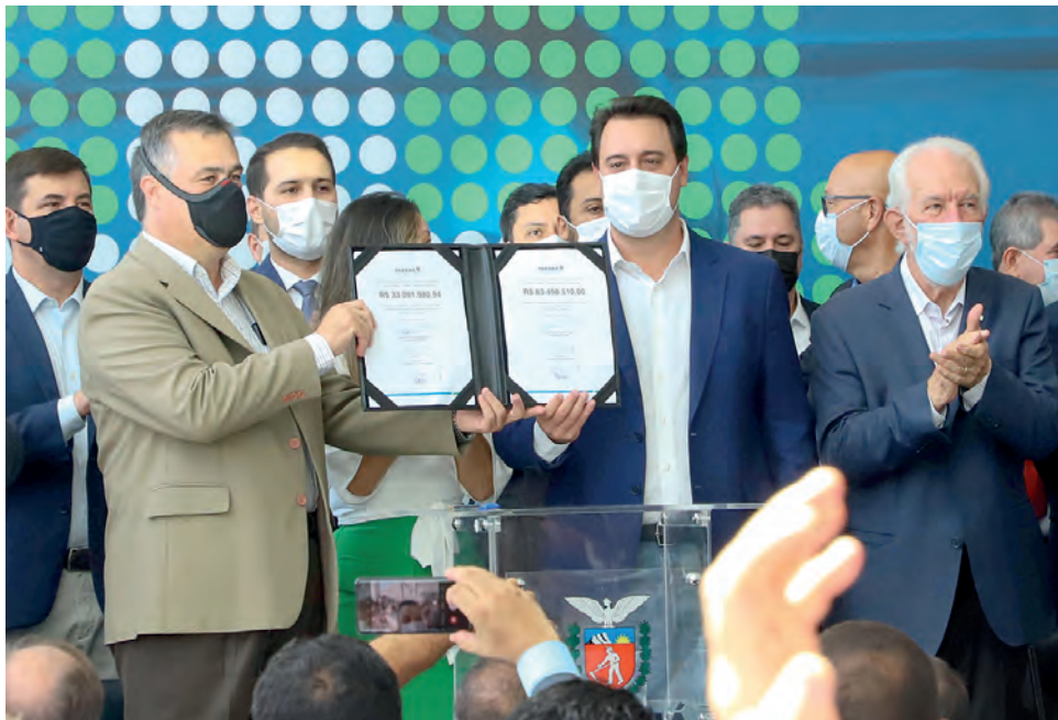
Recursos do Estado auxiliam municípios para desafogar a alta demanda na saúde após pandemia

Esses recursos estão distribuídos em to-