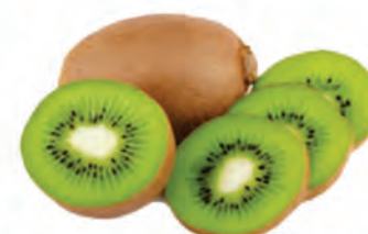
Kiwi Importado Kg