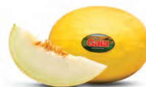
Melão Amarelo Gaia Kg