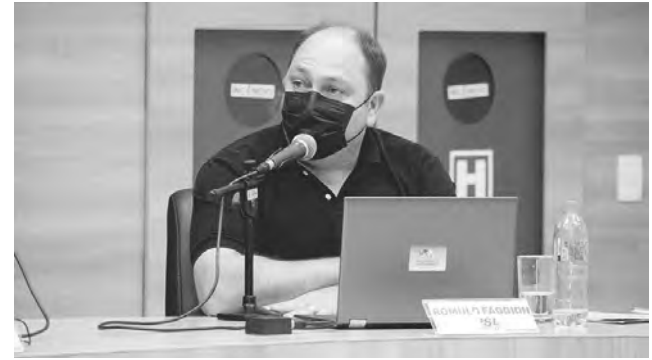
Vereador Romulo Faggion (União), ex-PSL