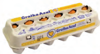
Ovos Vermelho Gralha Azul Dúzia