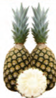
Abacaxi Pérola Extra Unidade