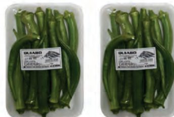
Quiabo Lotti Bandeja 250g