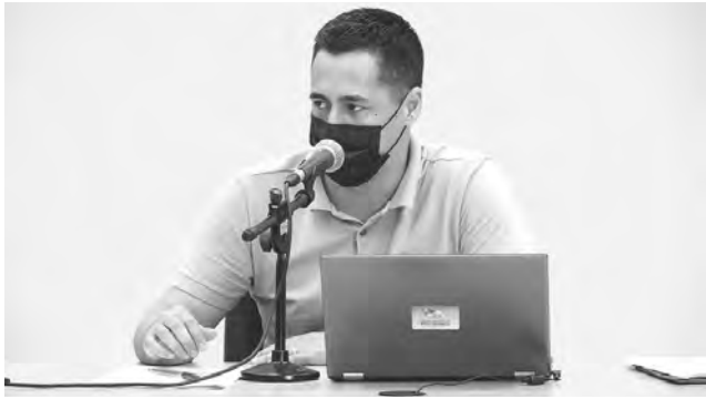
Vereador Lindomar Brandão (PP), ex-DEM