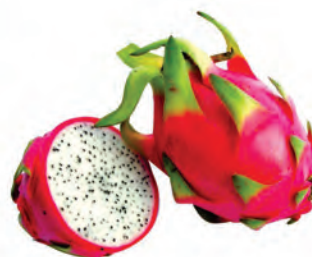
Pitaya Branca Kg