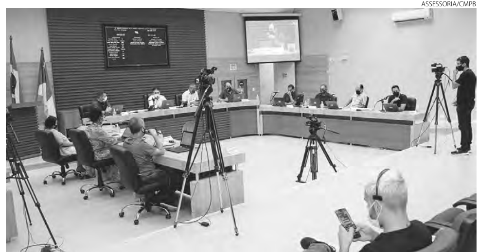
Na sessão de ontem (9) também foi aprovado em segunda votação relatório final da CEI do Depatran

veis irregularidades na aquisição do terreno da pedreira por parte dos agentes públicos, na sessão dessa quarta (9) a CEI foi formada.