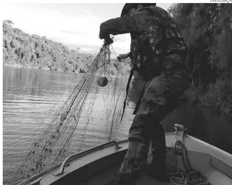
No período de quatro meses foram apreendidos mais de 17,8 mil metros de redes de pesca

cia Ambiental, por meio das cinco companhias, resultou na apreensão de 320 quilos de camarão, 465 quilos de peixes de diversas espécies e 444 caranguejos. No total, foram registradas 162 ocorrências de pesca irregular e apreendidos, ainda, 17.873 metros de rede e 44 tarrafas.