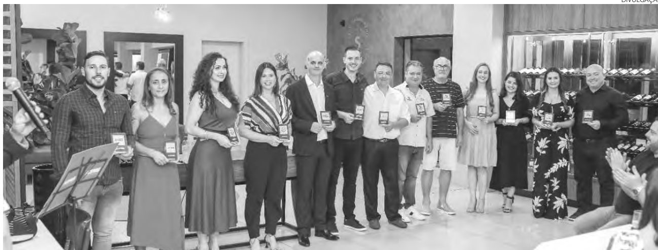
Sete núcleos setoriais tiveram a troca de coordenações