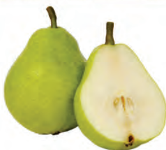
Pera Nacional Yari Kg