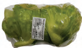
Alface Americana Lotti Bandeja C/2 Unid.