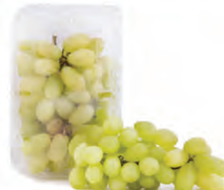
Uva Thompson Bandeja 500g