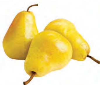
Pera Importada Willians Kg