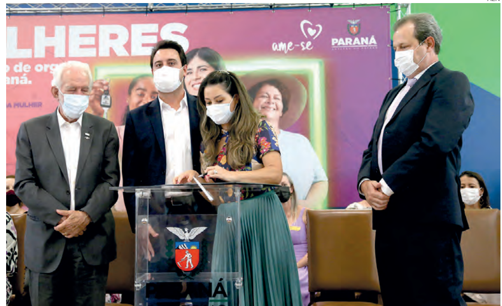
Programa para financiar projetos voltados às lideranças femininas foi lançado pelo Governo