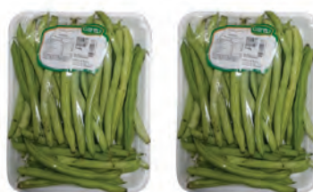
Vagem Cantu Trad. Bandeja 500g