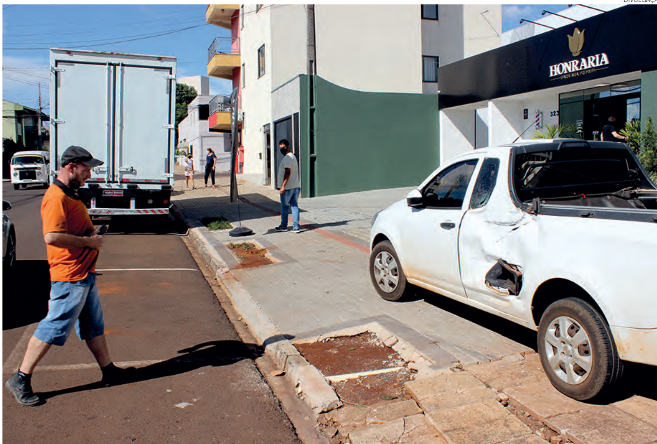
Um caminhão atingiu dois veículos na tarde de quarta-feira (9) na rua Procópio de Lima, esquina com a Caramuru, em Pato Branco. Felizmente ninguém ficou ferido, somente danos materiais.