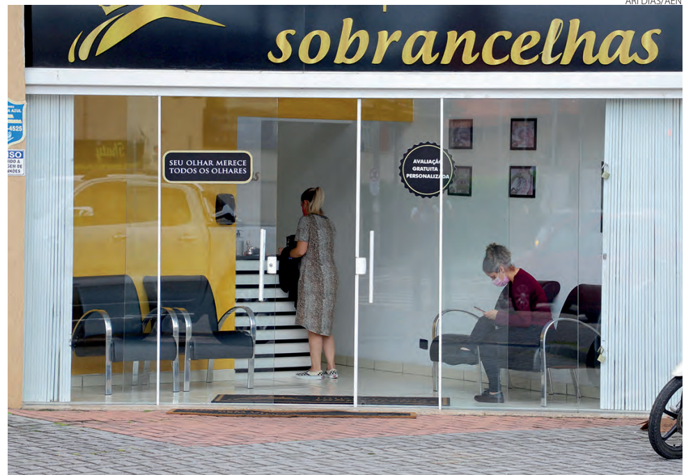
O setor de serviços, foi o que mais empregou em fevereiro em Francisco Beltrão

de pessoas do sexo feminino, enquanto que, 165 do sexo masculino.