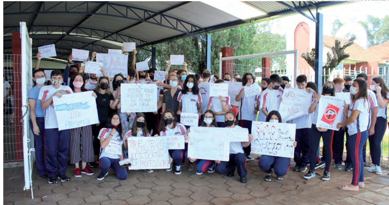
Protesto aconteceu em frente a escola, e contou com a participação de pais e mães de alunos

Nelson da Luz Junior nelson@diariosudoeste.com.br