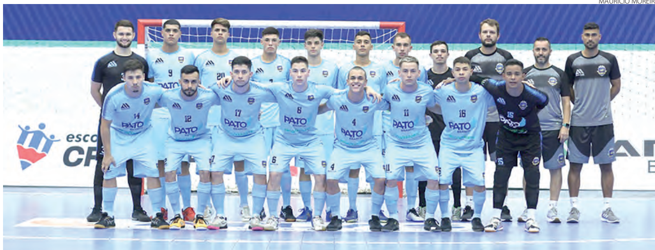
Elenco Sub-21 do Pato Futsal que vai disputar a competição

O Pato Futsal está confirmado na Etapa Nacional da Copa Mundo do Futsal Sub-21. A competição reúne as principais equipes do país na categoria e será realizada de 24 de abril a 1º de maio, no Ginásio da Unigran, em Dourados (MS).