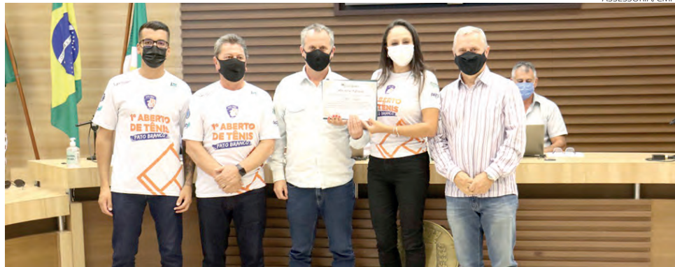
A homenagem ocorreu na sessão ordinária de segunda-feira (28)

Atualmente, o Projeto Tênis para Vida atende 25 crianças e adolescentes, com idade entre 10 e 17 anos,