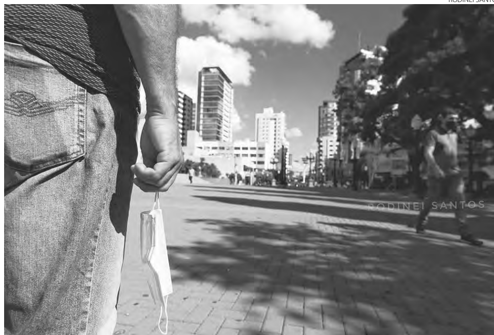
Obrigatoriedade do uso das máscaras estava prestes a completar dois anos

multa de uma Unidade Padrão Fiscal do Paraná (UPF/PR) a cinco UPF/PR, para pessoas físicas que não cumprissem o decreto, para as pessoas jurídicas a pena podia variar de 20 a 100 UPF/PR.