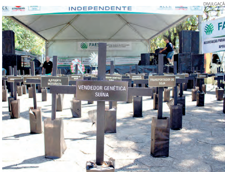
Altos custos de produção e inviabilidade da atividade motivaram o protesto nacional pedindo medidas urgentes

Conforme levantamento da ACCS, o prejuízo atual do suinocultor independente passa dos R$ 300 por animal vendido. Hoje, o preço pago pelo quilo do suíno vivo é de R$ 5 e o custo de produção passa dos R$ 8. Esse cená-