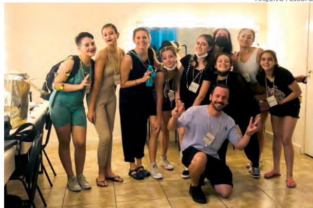
Comitiva que representou Pato Branco no Brasil Circus Festival