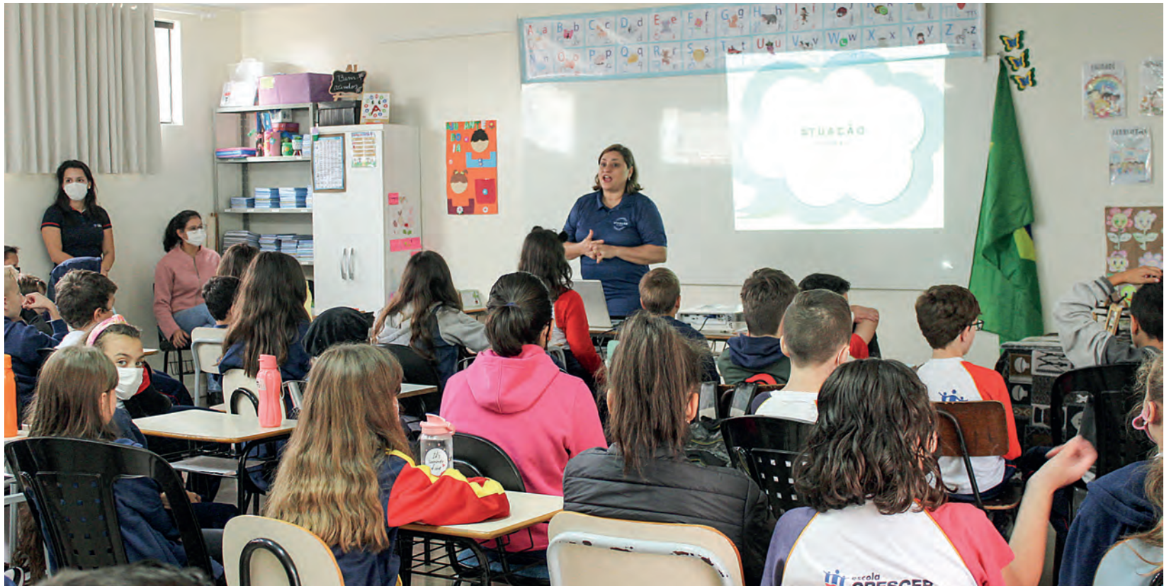
Os alunos da Escola Crescer aprenderam sobre a cultura e a realidade socioeconômica das crianças da África

“Outra diferença é a maneira como eles processam e professam a sua fé. Muitas vezes elas divergem da nos-