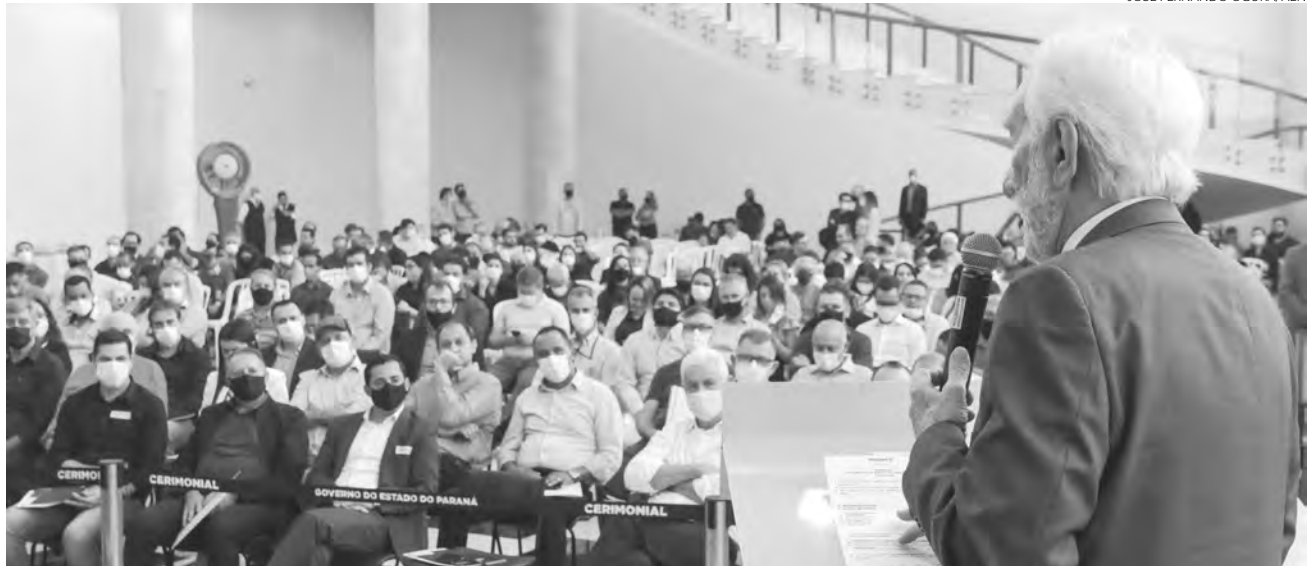
Premiado, programa Caixa D'Água Boa vai beneficiar 1,5 mil paranaenses de 51 municípios em 2022

De acordo com a proposta, a Sanepar disponibiliza uma caixa d'água de 500 litros e um kit de instalação. Já a Sejuf oferece subsídio financeiro de R$ 1 mil para