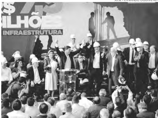
O governador Carlos Massa Ratinho Junior anunciou nesta terça-feira (29) mais de R$ 2,5 bilhões em investimentos em infraestrutura

nior assinou seis ordens de serviço: a primeira delas no valor de R$ 1,4 milhão para a construção de uma passarela na PR-445, em Londrina; outra no valor de R$ 680 mil para elaboração de projeto de pavimentação na PR-990, em Rebouças; outra no valor de R$ 33,6 milhões para a construção de um viaduto na BR-376, em São José dos Pinhais, próximo à Rua Joinville e Alameda Bom Pastor.