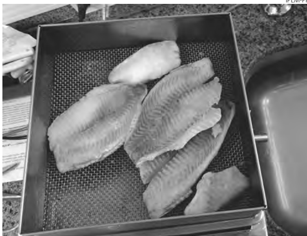
Os peixes podem ser adquiridos por quilo, previamente embalados ou pesados no momento da compra

O peso da embalagem não pode fazer parte do peso do produto. No caso dos congelados, a camada de glaceamento, uma fina camada externa de gelo que serve de proteção, não pode compor o peso do