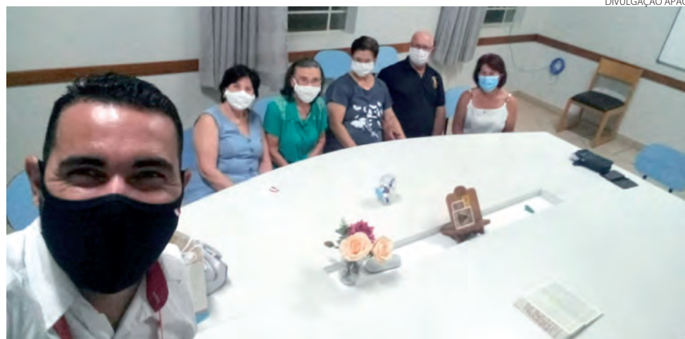
Inspeção acontece a cada seis meses no município