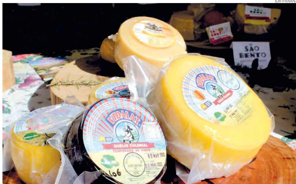
Rota do Queijo Paranaense lança mapa das queijarias e recebe agentes de viagens

“Este conjunto de forças, graças à união entre setores do Governo e prefeituras, ganha um contor-