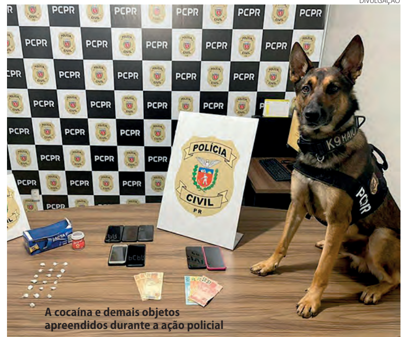
A cocaína e demais objetos apreendidos durante a ação policial

As duas mulheres foram autuadas em flagrante. Elas foram encaminhadas à Cadeia Pública de Pato Branco para as devidas providências.