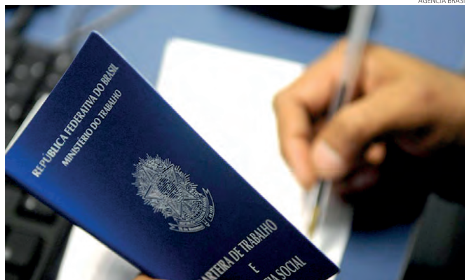
Volume de postos de trabalho criados no Sudoeste no primeiro mês de 2022, ficou abaixo dos índices do mesmo período de 2021

Marcilei Rossi com agências marcilei@diariosudoeste.com.br