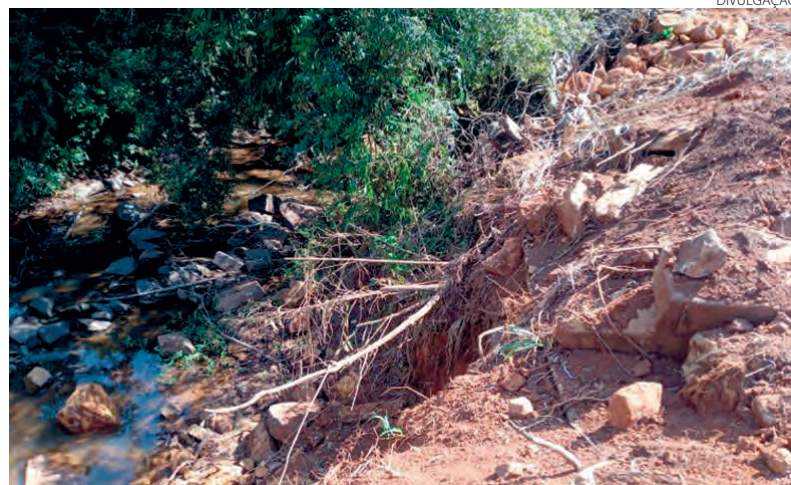
Os policiais constataram desmatamento em áreas de nascentes

A Polícia Ambiental realizou fiscalização quarta-feira (9) em propriedades rurais da região. Dois agricultores foram autuados por danos em nascentes de água e outros crimes ambientais.