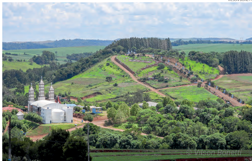
Belíssimo registro do Morro do Calvário, morada de Nossa Senhora do Perpétuo Socorro, em Vila Milani, São Domingos (SC)