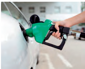
A variação do preço da gasolina é de R$ 0,44 por litro

Apesar da disparada dos preços do petróleo e seus derivados em todo o mundo, nas últimas semanas, como decorrência da guerra entre Rússia e Ucrânia, a Petrobras informou