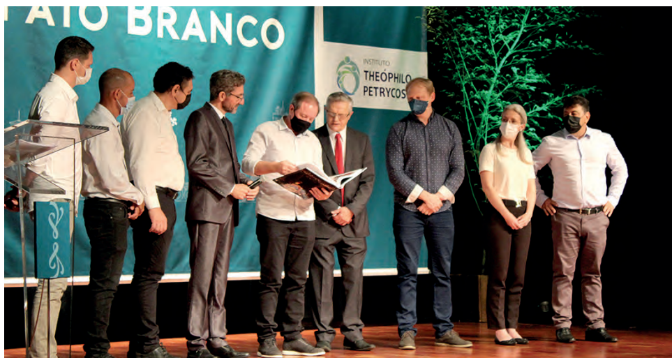
Pato Branco, segundo o autor revela "o esforço comunitário para levantar a cidade, construir o município"

O autor destaca o respeito e o comprometimento das pessoas com o livro. "Fui muito bem recebido em Pato Branco, tanto na cidade quanto nas comunidades rurais. Na questão histórica, o desenvolvimento da cidade, a partir de uma peque-