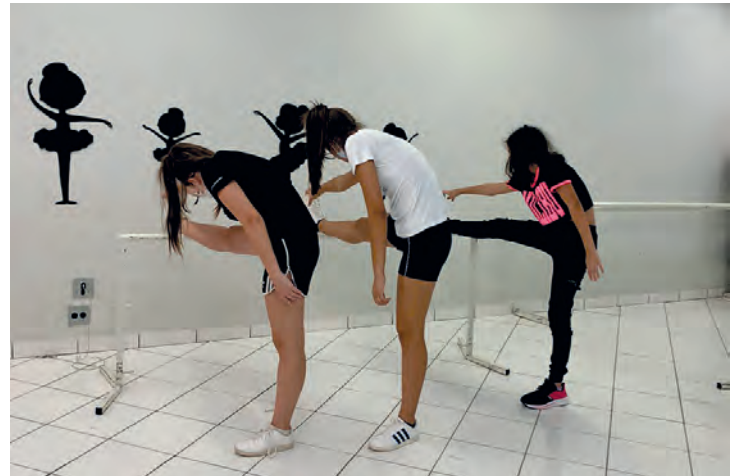
Oficina está disponível para população a partir de 10 anos