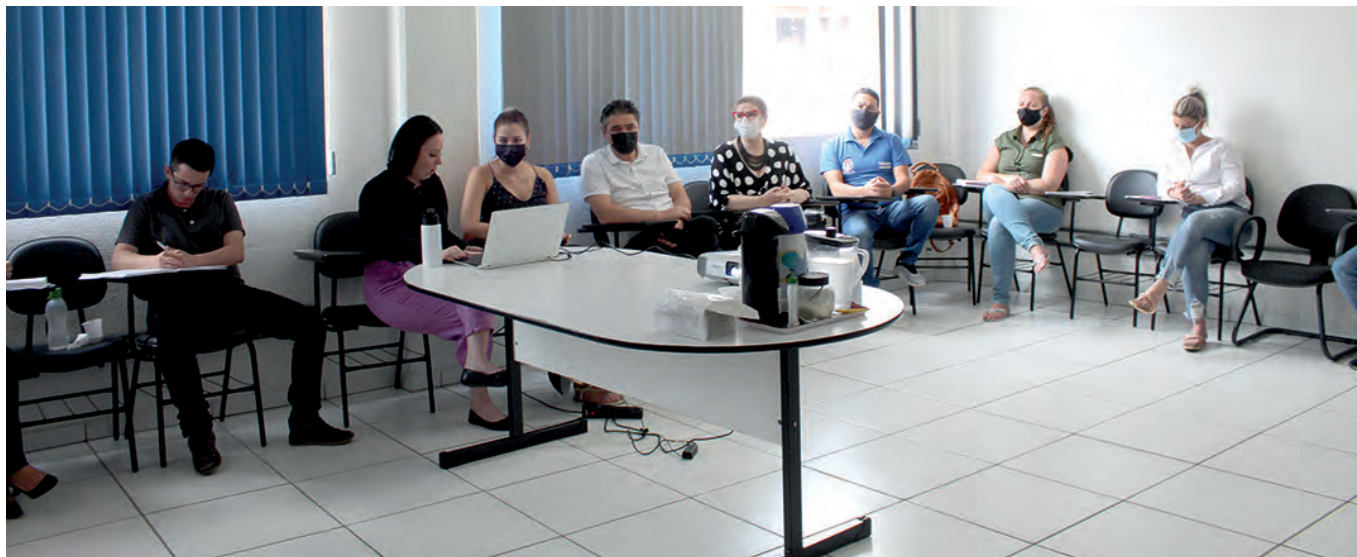
Reunião dessa quinta, debateu a flexibilização do uso de máscara, e o alto índice de dengue

Devido aos baixos índices de transmissibilidade, a intenção inicial do comitê era ampliar a medida estadual, estendendo a desobrigação do uso de máscara em ambientes de trabalho e comércio em geral. No entanto, a prioridade foi seguir a alteração no decreto estipulado pelo governo do Es-