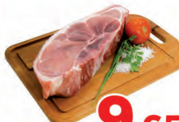
Carne Bovina Costela Grossa c/osso Kg