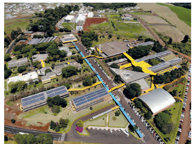
Evento será no anfiteatro, com transmissão pela internet

O evento é gratuito e aberto a toda a comunidade, e as inscrições podem ser realizadas pelo link: https://forms.gle/wZrzL5JXGh9kT8YSA . Para participação presencial é obrigatório o passaporte vacinal ou carteira de vacinação.