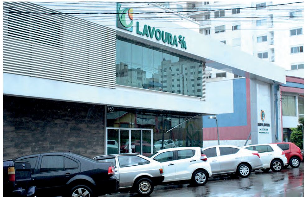
Uma nova assembleia de credores poderá ser realizada

os termos foram apresentados no processo e utilizados não são necessariamente o que está prescrito em lei. "No começo do ano passado houve uma alteração na lei que passou a admitir os termos de adesão, mas somente para a substituição da assembleia geral de credores. Ou seja, a recuperanda, o grupo Lavoura, teria que, obrigatoriamente, colher termos de adesão em número necessário para que a assembleia não ocorresse. Esse número equivale a 50% dos credores de cada classe. Eles infelizmente não atingiram esse número. Foi solicitado que os termos de adesão fossem utilizados como votos na assembleia, o que foi autorizado pelo juiz de primeiro grau, o que levou ao resultado de aprovação. Porém, o tribunal entendeu diferente, e por esse motivo determinou a anulação do processo", detalhou no vídeo o administrador judicial.