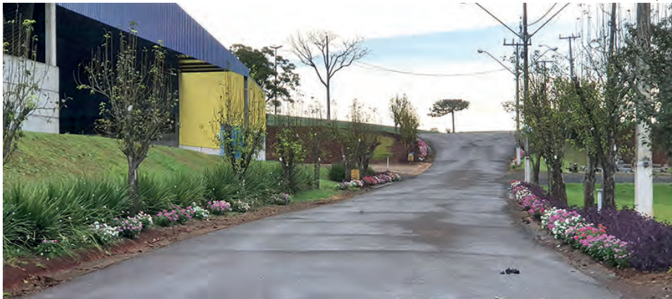
Atividades serão no Parque de Eventos Arnaldo Weiss