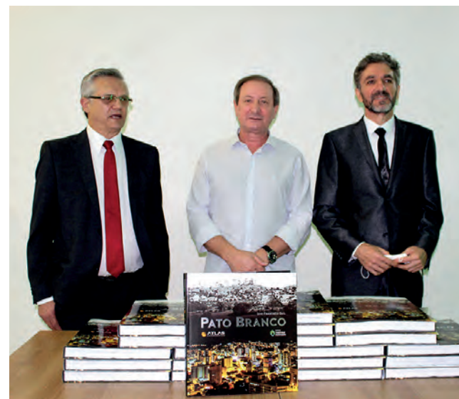
Trabalho de pesquisa do livro iniciou ainda em 2019