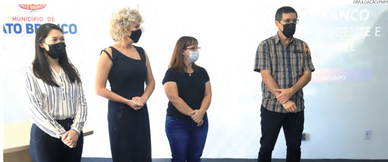
Programa “Rotas no Campo” foi lançado na manhã desta terça-feira