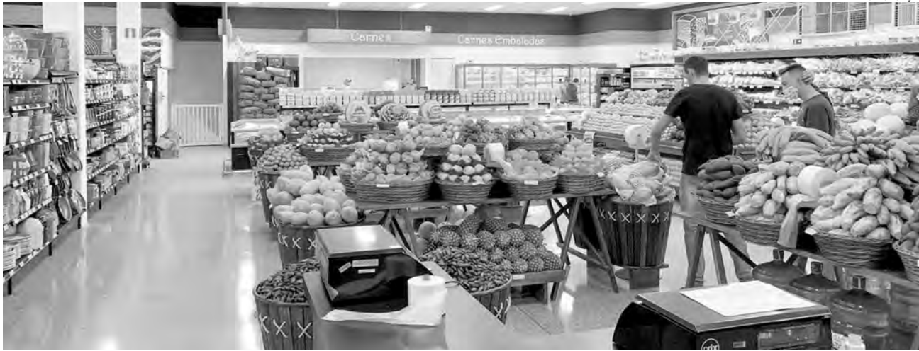
O supermercado Manfroi registrou crescimento de 7,5% durante a pandemia