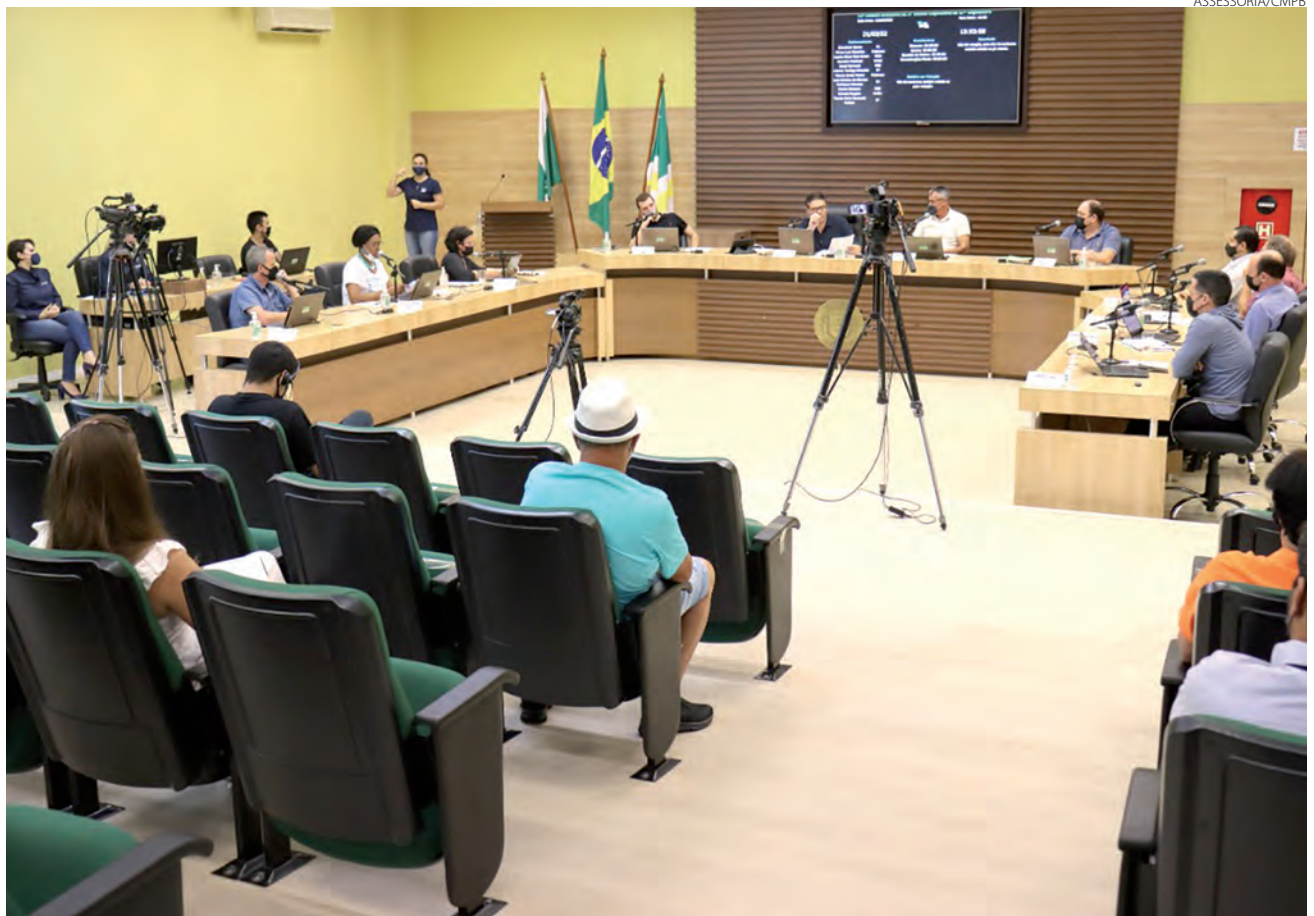
O Projeto de Lei que solicita autorização para doação do terreno, foi apresentado em plenário na segunda-feira (21)

"Além disso, 6% das gestantes são classificadas como risco intermediário, tendo a necessidade de um acompanhamento mais rigoroso, dispensando maior número de consultas em menor intervalo de tempo, intercalando com o clínico geral de atenção primária. Com isso, se fazem necessárias consultas semanais de risco habitual, médio e alto risco, hoje distribuídas em três pontos de atenção – Mãe Pato-branquense, Ambulatório do Ins-