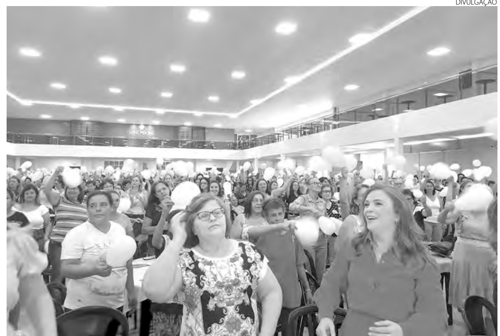
Evento em comemoração ao Dia da Mulher foi marcado pela presença feminina do município