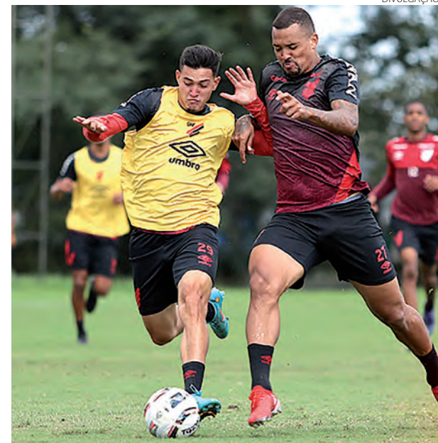
O Furação se preparou e quer abrir vantagem no primeiro jogo da semifinal do Estadual