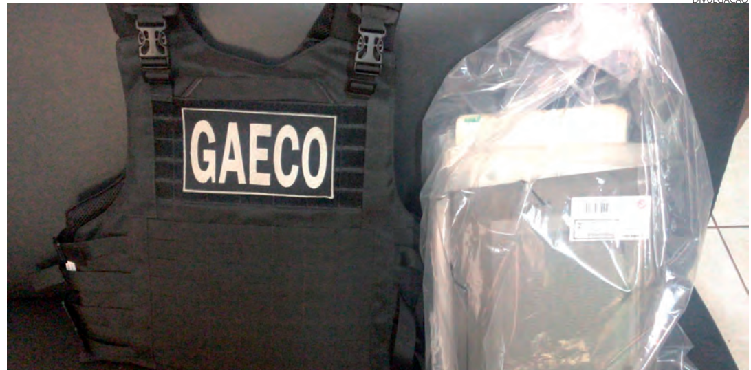
Durante as buscas foram apreendidos documentos e vários celulares que serão analisados

A investigação teve início em agosto de 2019, quando o Gaeco recebeu denúncia anônima, com imagens, de que as máquinas do município de Mariópolis estavam realizando trabalho em propriedade particular de forma irregular. A partir de então, o Gaeco passou a apurar a possível utilização de má-