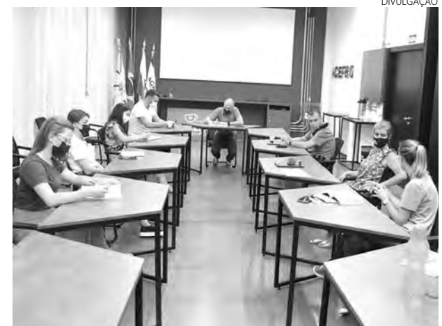
A definição das atividades aconteceu em reunião nessa terça-feira (22)

O trabalho envolverá a prefeitura, através da Secretaria Municipal de Saúde, Setor de Endemias, secretaria de Viação e Obras e secretaria municipal de Educação, Associação Empresarial, através da Câmara Técnica de Saúde do Condef e do Núcleo de Pesquisa e Extensão, universidades, 8ª Regional de Saúde, lideranças comunitárias, Polícia Militar e Debetran.