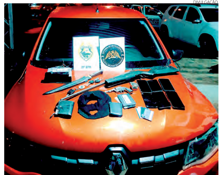
As armas e demais objetos apreendidos com os integrantes da quadrilha

Segundo a Polícia Militar, um dos acusados havia sido liberado no sábado (19) em audiência de custódia, mas voltou a ser preso na segunda-feira. Os policiais descobriram que havia dois mandados de prisão contra ele expedidos pela Vara Criminal da Comarca de Capaneva. O masculino foi localizado em Barracão e encaminhado ao Pelotão da Polícia Militar para a confecção do Boletim de Ocorrência. Em seguida, ele foi entregue na Delegacia da Polícia Civil de Santo Antônio do Sudoeste, estando à disposição da Justiça. (AB)