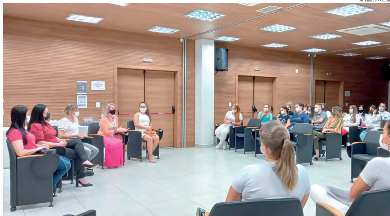
Encontro debateu vários assuntos relacionados a enfermagem

O evento contou com a participação de alunos das demais turmas dos cursos técnico de enfermagem; técnico de radiologia e técnico em segurança do trabalho (TST).