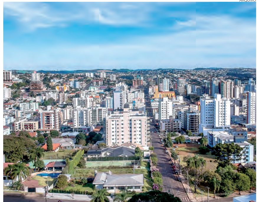
O Decreto Nº 9.173, de 3 de Março de 2022, regulamenta a apresentação de artistas de rua nos espaços públicos do Município de Pato Branco