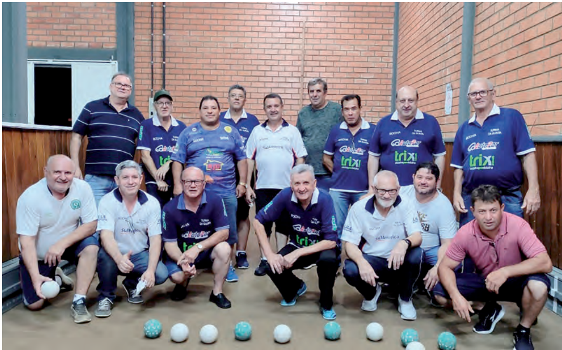
Turma de bocha da quinta no La Salle iniciou suas atividades