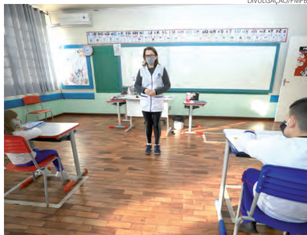
Medida atende a demandas de escolas do município

O edital vai ser lançado na próxima quarta (23) e a partir do momento que os profissionais forem chamados, devem se apresentar, fazer todas as consultas, para que depois estejam aptos para irem para as escolas. Este processo levará em torno de 10 a 15 dias.