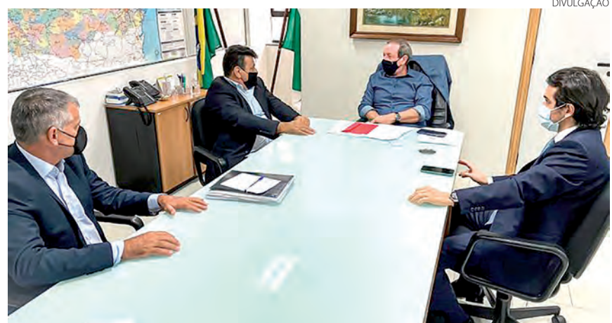
A reunião ocorreu na tarde de terça-feira (22)