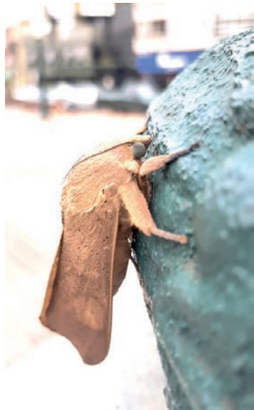
Registro de dezenas de mariposas marrons na praça Presidente Vargas, em Pato Branco, na sexta-feira (25)