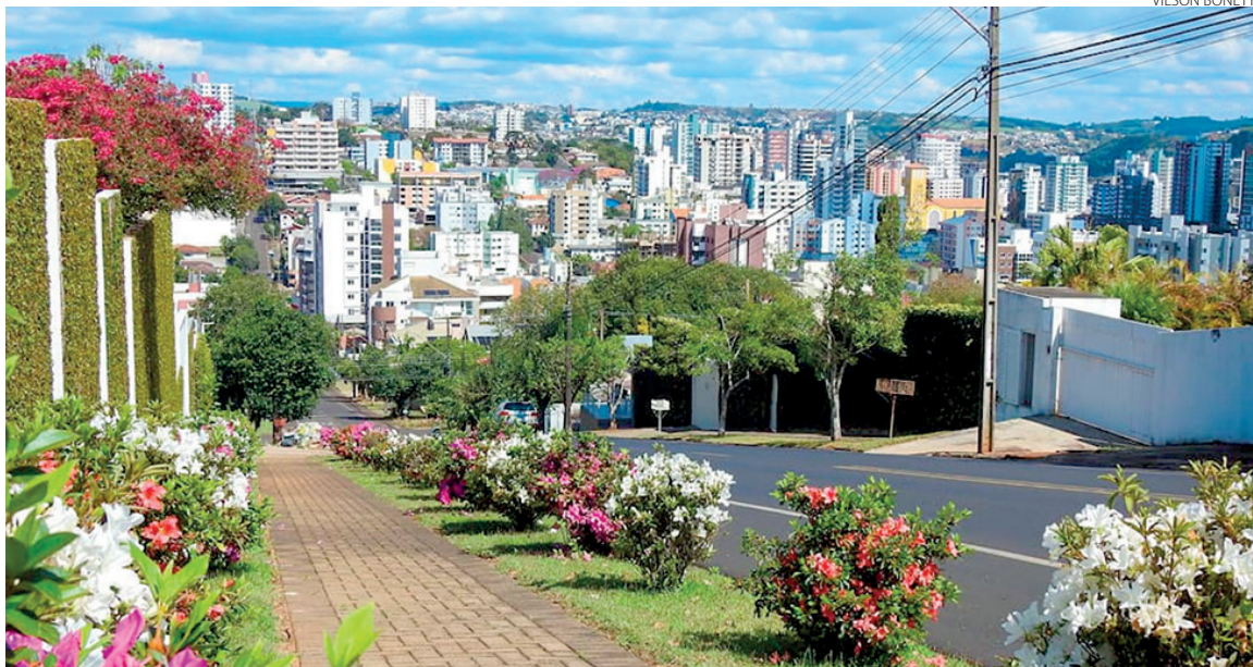
Inflação alta também afeta decisão de compradores via financiamento