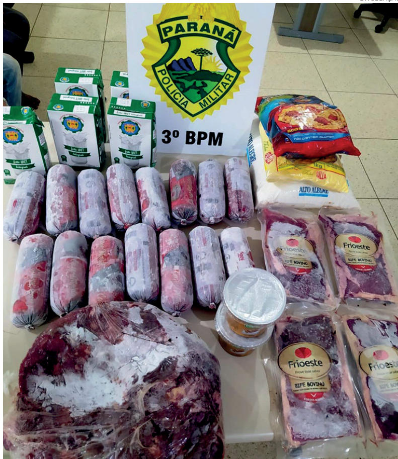
Os produtos que tinham sido furtados do estabelecimento de ensino

O golpe teria sido feito na mesma data. Na ocasião os golpistas subtraíram R$ 47 mil de uma vítima, entretanto, a PCPR conseguiu bloquear e recuperar R$ 35 mil, que foram enviados para uma casa de câmbio em Campinas (SP). Durante essa ação foram apreendidos ainda um veículo, máquinas de cartões, celulares, dinheiro e objetos pessoais. Outros dois estelionatários conseguiram fugir durante a abordagem policial.