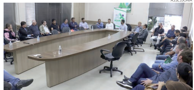
A reunião ocorreu na manhã de sexta-feira (25), na sede da Amsop, em Francisco Beltrão

O Comitê foi formado durante audiência pública que aconteceu no último dia 11, e teve como principal pauta os frequentes problemas causados por quedas de energia elétrica na região. Para dar sequência aos trabalhos, cada município deverá fazer um relatório de dados dos problemas da falta de energia, a fim de encontrar soluções