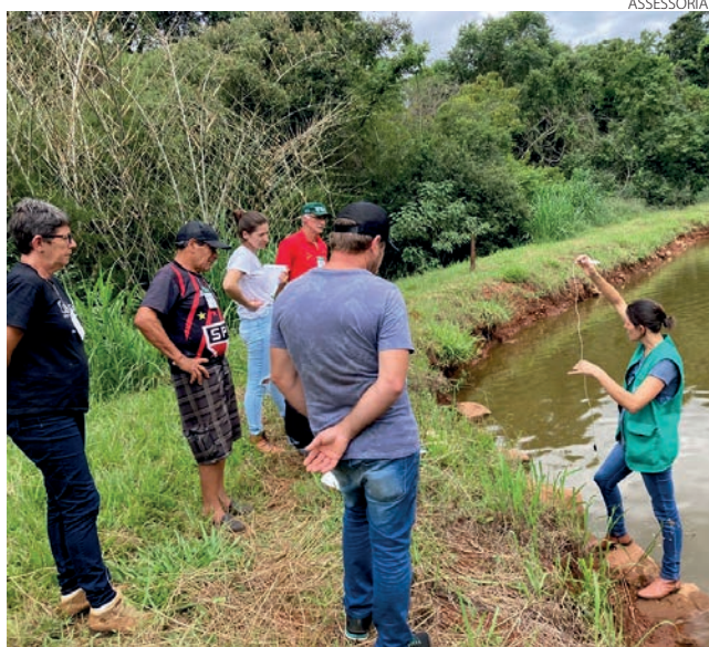
Durante o curso os produtores puderam colocar em prática os conhecimentos adquiridos

pal de Agricultura, Pecuária e Meio Ambiente para o ano de 2022, a fim de fomentar a agricultura familiar e qualificar os produtores rurais.