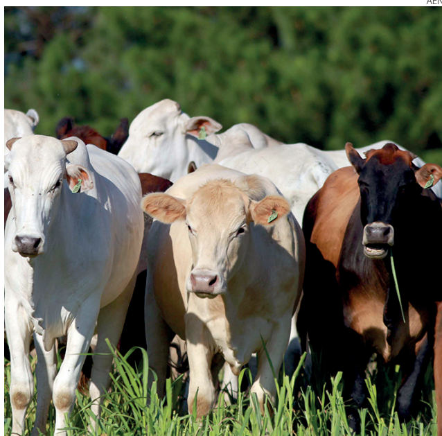
O Estado interrompeu a imunização contra a aftosa em 2019