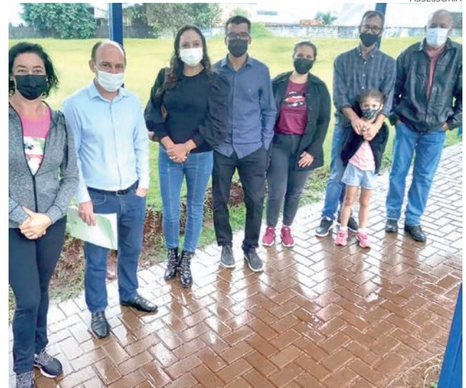
A visita a Escola Municipal Jardim Primavera ocorreu na quinta-feira (24)

A emenda impositiva individual estabelecida pelo vereador para a instalação da quadra de tênis soma recursos ao Projeto de Lei nº175/2021, que estima a receita e fixa a despesa do Município de Pato Branco para o exercício financeiro de 2022.