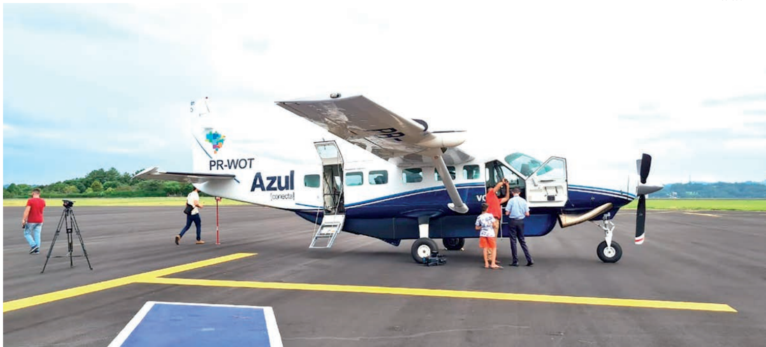
Nessa segunda-feira (24), foi realizado o voo inaugural da linha Curitiba/Francisco Beltrão, pela companhia Azul