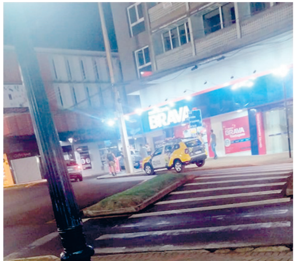
A ação durou poucos segundos

Em uma ação rápida, que durou apenas alguns segundos, o grupo levou aproximadamente R$ 2 mil.