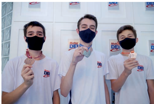
Dos cinco alunos que se destacaram na olimpíada de 2021, três seguem no colégio