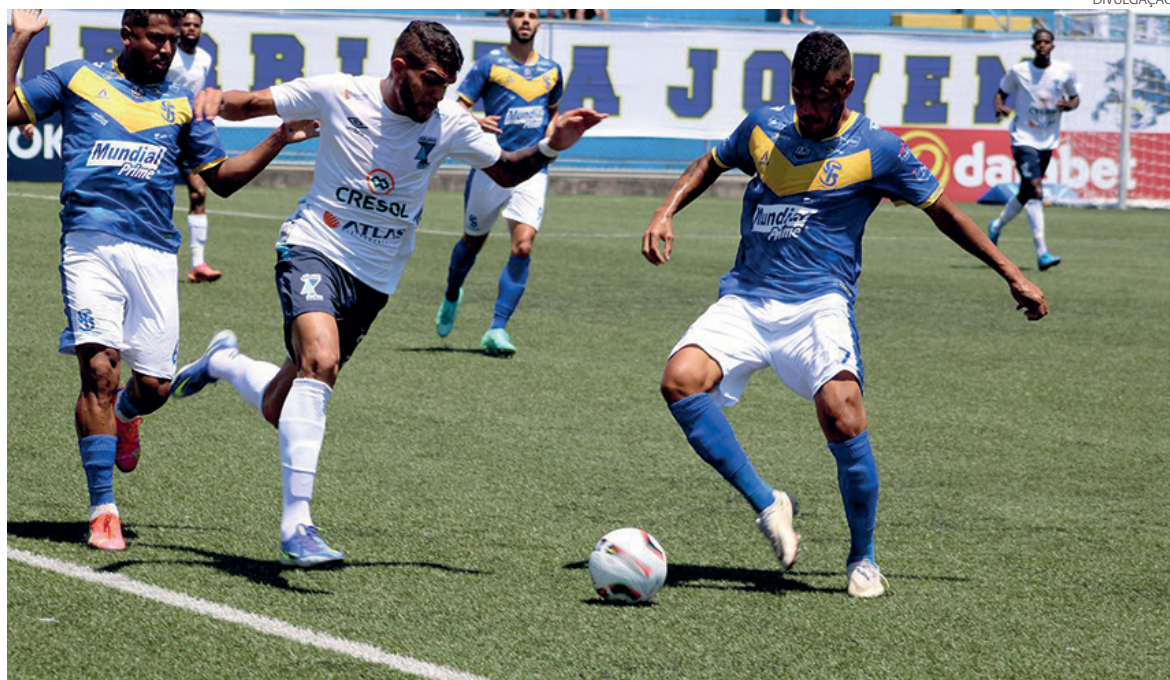
Na estreia do estadual, Azuriz soma um ponto ao empatar com o São Joseense