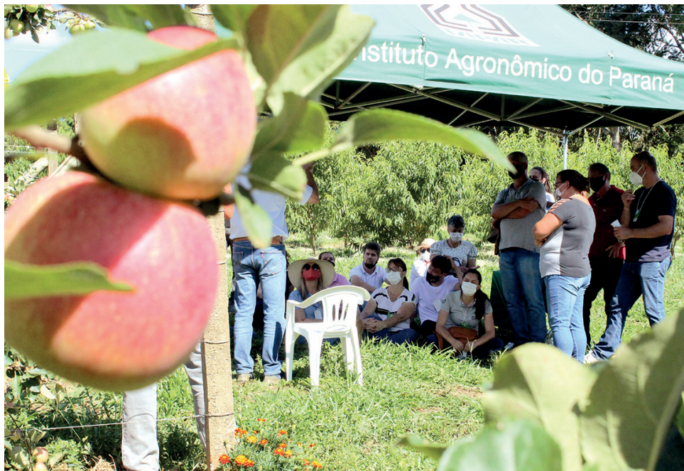
Exigência do consumidor e legislação são alguns dos fatores que estimulam o desenvolvimento da pesquisa

macieira tem destaque nos campos de Palmas, onde o clima mais frio contribui para a produção das variedades lá estabelecidas, no manejo tradicional.