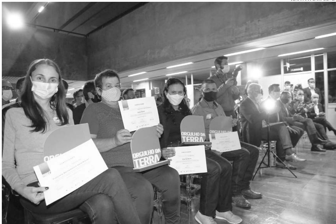
Premiação reconhece as melhores práticas econômicas, ambientais e sociais do agronegócio paranaense