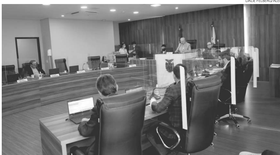
Projeto de lei complementar 12/2021, de autoria do Poder Executivo, foi aprovado em sessão extraordinária

O Governo diz, na justificativa da matéria, que o projeto propõe "a exclu-