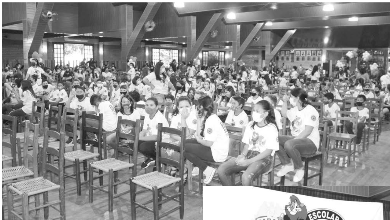
Participaram do programa estudantes da Rede Municipal de Ensino

O evento contou com a presença do leão Daren, o conhecido mascote do programa, e da banda do Proerd, formada por policiais que integram o programa e