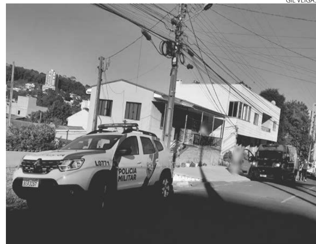
Em Francisco Beltrão, o crime ocorreu no bairro Industrial