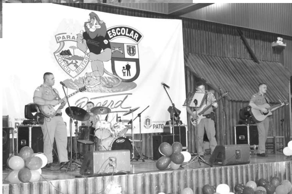
A banda formada por policiais militares se apresentou no evento

“Formatura também teve sorteio de brindes e premiação de concurso de redação”