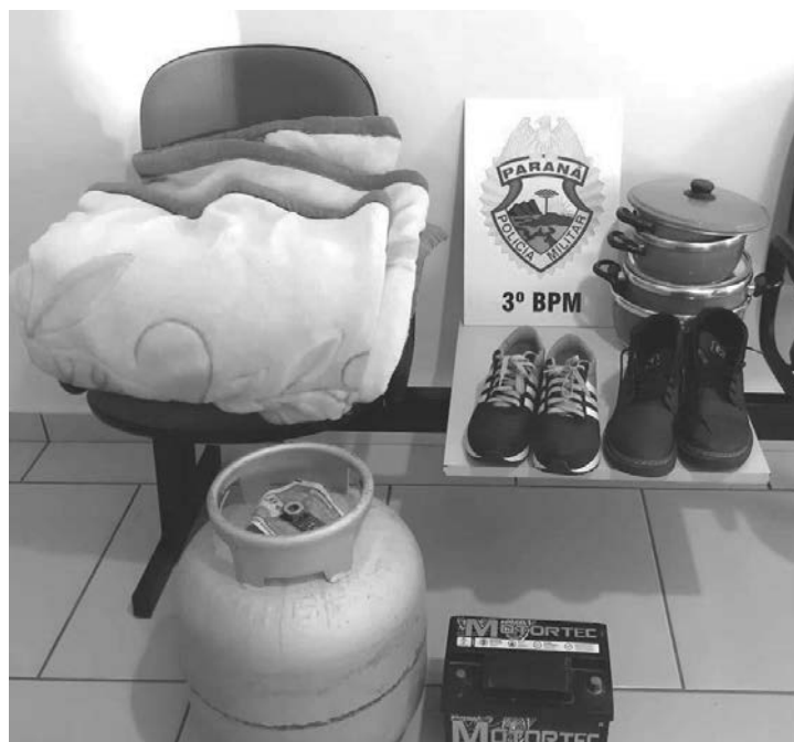
Os objetos que foram recuperados pela Polícia Militar

lação de domicílio, a Polícia Militar abordou um homem, que estava no interior do imóvel. Ele foi identificado e os policiais constataram que era procurado pela Justiça. O preso, que tem 60 anos, foi entregue no Departamento Penitenciário (Depen). (AB)