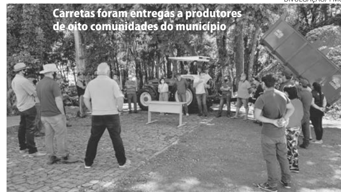
Carretas foram entregadas a produtores de oito comunidades do município

Os referidos implementos tratam-se de dois convênios com Seab. Em um deles foi adquirido as carretas, com um investimento de aproximadamente R$ 270 mil, tendo uma contrapartida de R$ 59.538,00 do Município. Foram beneficiadas com as doações as associações das comunidades de Passo Liso, Capinzal, Bugre, Palmeirinha do Iguacu, Linha Aparecida, Gramados, São Luiz e Linha Gressana.