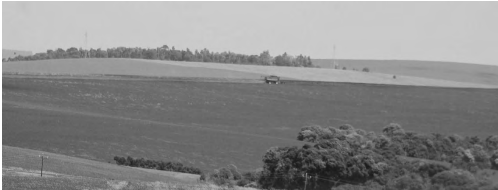
As perdas da safra atual na microrregião de Pato Branco estão estimadas em R$ 1,606 bilhões para a soja

Em projeção realizada pela Secretaria Estadual de Agricultura e Abastecimento (Seab) em 9 de fevereiro de 2022, as perdas da safra atual na microrregião de Pato Branco estão estimadas em R$ 1,606 bilhões para a soja, R$ 173,1 milhão para o milho e, para o feijão, estima-se perdas de R$ 26,6 milhões. A produção de leite também foi prejudicada, marcando perda de até 20% nos últimos quatro meses, o equivalente a diminuição de R$ 46 milhões no faturamento. Até o momento, a Seab estima, no total, perdas de R$ 1,85 bi-