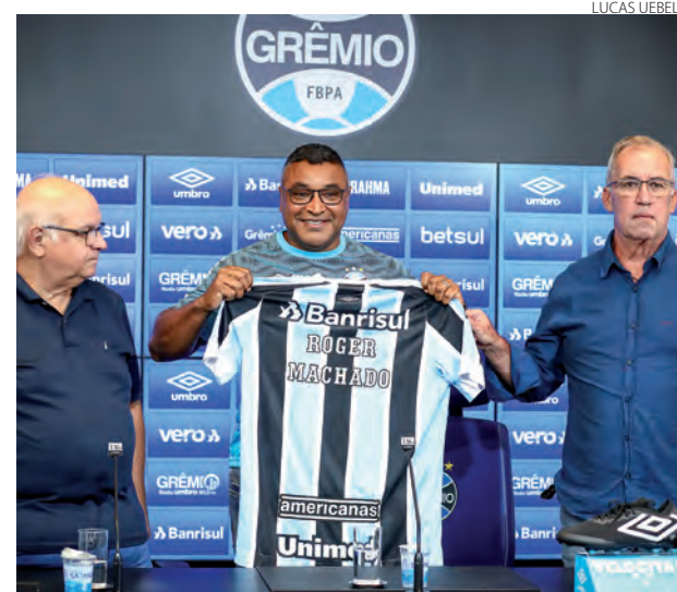
Roger Machado disse durante a apresentação que é bom voltar pra casa