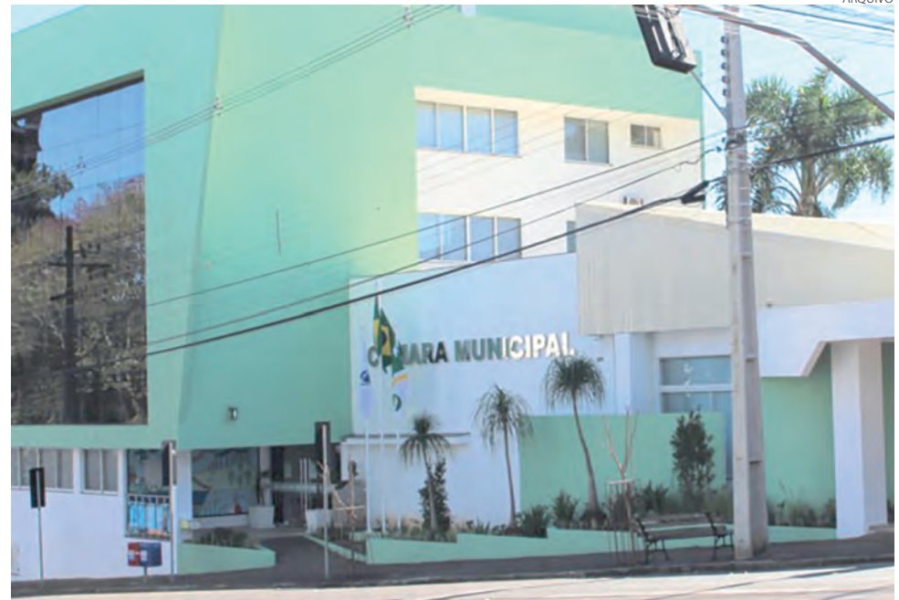
O documento completo está disponível na Câmara, através do link: https://sapl.patobranco.pr.leg.br/materia/17272

No pedido protocolado, os parlamentares também