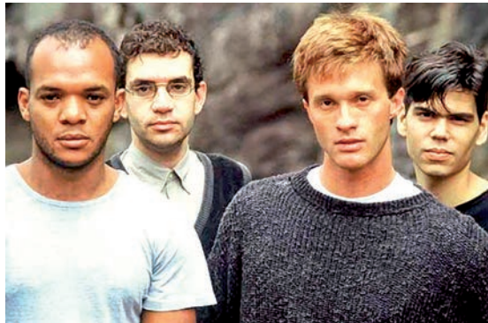
"Tempo Perdido", da Legião Urbana está entre as mais ouvidas

O fim de 2021 está se aproximando e, com ele, a gente já começa a montar aquela playlist cheia de nostalgia para lembrar dos melhores momentos. Pensando nisso, o Spotify revelou uma lista com as músicas dos anos 1980, 1990, 2000 e 2010 mais ouvidas na plataforma no Brasil. Assim, já dá para preparar a playlist com sucessos garantidos para ouvir, lembrar e dançar. Confira abaixo as músicas mais ouvidas das últimas quatro décadas e capriche na sua seleção.