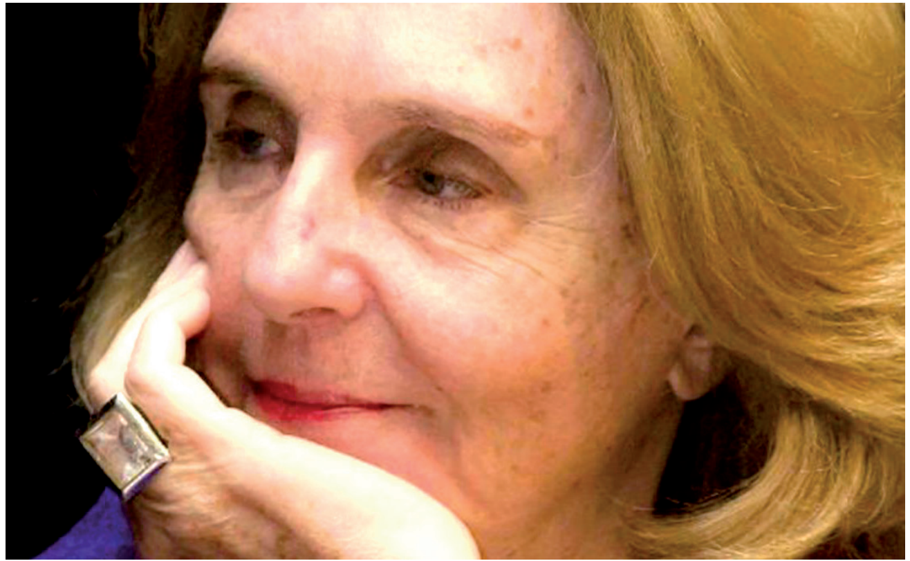
A escritora enfrentava um melanoma