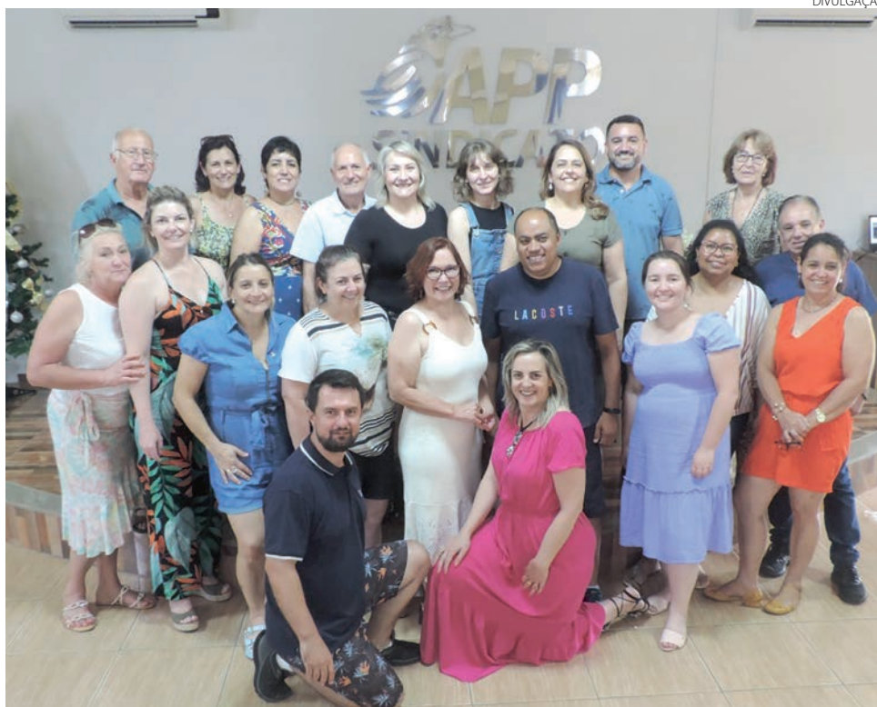
Nova diretoria do NS de Pato Branco