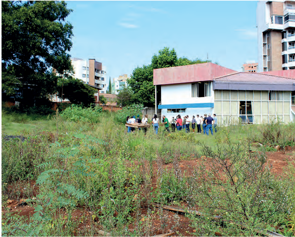
Empresa cogitou um reequilíbrio de R$ 2 milhões, mas nunca apresentou uma planilha comprovando o aumento, segundo secretário de obras

Com a notificação da empresa realizada no início de fevereiro, Vladimir afirma que agora será necessário entrar em contato e cancelar efetivamente o contrato para então licitar novamente a obra e reiniciar a