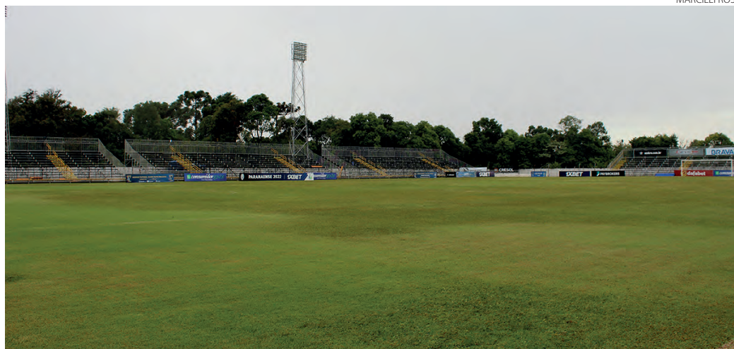
O Estádio Os Pioneiros foi liberado na tarde de terça-feira para o jogo histórico da Copa do Brasil

Ele acrescentou que agora a parte do Azuriz é fazer o ingresso a R$ 10,00 para ter lotação total do estádio e êxito no campo. "A gente sabe que a equipe não está na melhor fase no Paranaense, mas é uma nova competição, a maior a nível nacional, um momento histórico para o Azuriz, para Pato Branco e toda a região ter um time na Copa do Bra-