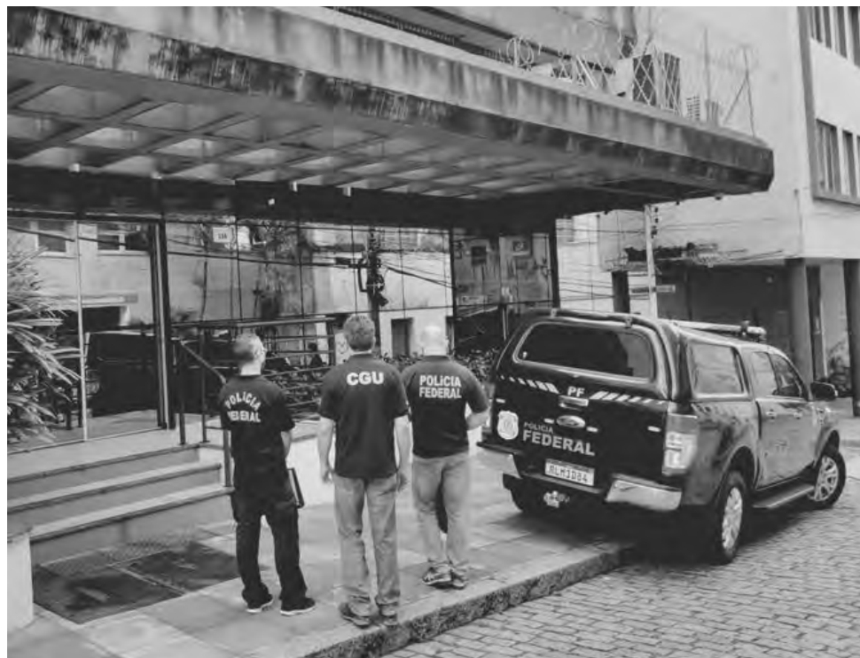
Objetivo é apurar irregularidades na aplicação de recursos públicos do DNIT no Paraná, além de atos de corrupção e lavagem de dinheiro

obra causam grande prejuízo à população e ao setor produtivo, já que a BR-163/PR é uma das rodovias mais importantes para o estado do Paraná e para o país em razão de sua importância estratégica para o escoamento da produção agrícola e integração das regiões Sul e Norte.