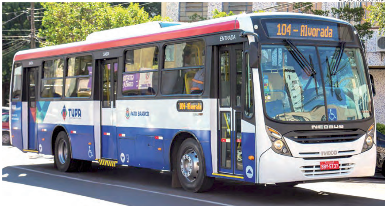
Participação da Catani no serviço de transporte público de Pato Branco é de 46,6%

“Quando os ônibus não têm cobrador, é o motorista, por exemplo, que ajuda pessoas que precisam de ajuda no embarque e desembarque; um cadeirante que precisa usar o elevador, é o motorista que sai do volante do veículo e auxilia essa pessoa; além da questão do trânsito, que em Pato Bran-