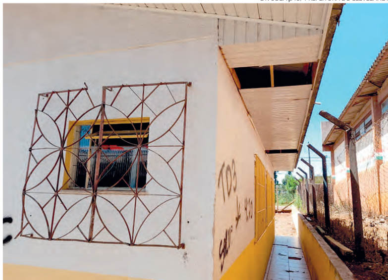
Escola foi assaltada seis vezes em menos de dois meses

Jéssica Procópio com assessoria jessica@diariosudoeste.com.br