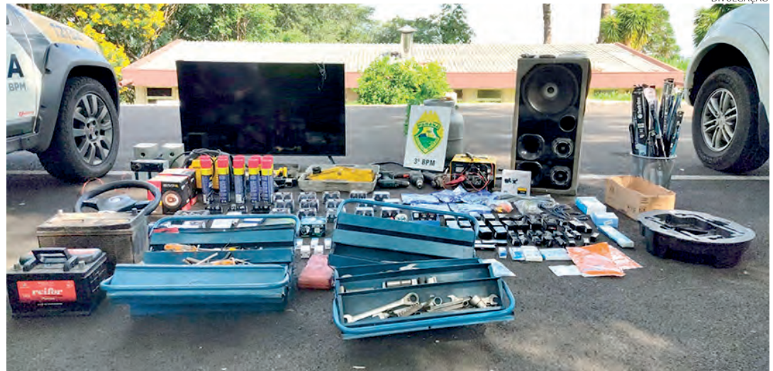
Objetos recuperados pela Polícia Militar

Uma equipe passou a acompanhar a região, e percebeu a chegada de um veículo com três ocupantes, que começaram a descarregar objetos. Equipes de apoio foram chamadas e a