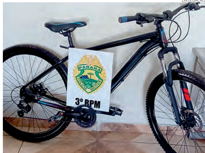
Bicicleta recuperada pela Polícia Militar

Diante das evidências, os abordados foram encaminhados ao plantão policial para as providências legais cabíveis, juntamente com a bicicleta recuperada. O caso foi solucionado na manhã desta quinta-feira (10). (Redação)