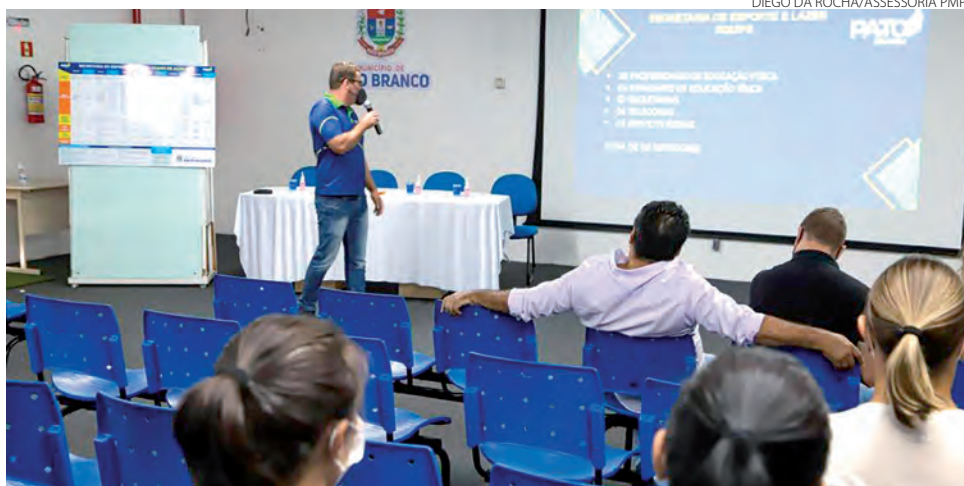
Além de modalidade amadores, calendário contempla competições de rendimento

Mesmo tendo sido apresentado, o calendário pode sofrer alterações. E estas mudanças podem ocorrer devido a competições oficiais que Pato Branco deve sediar