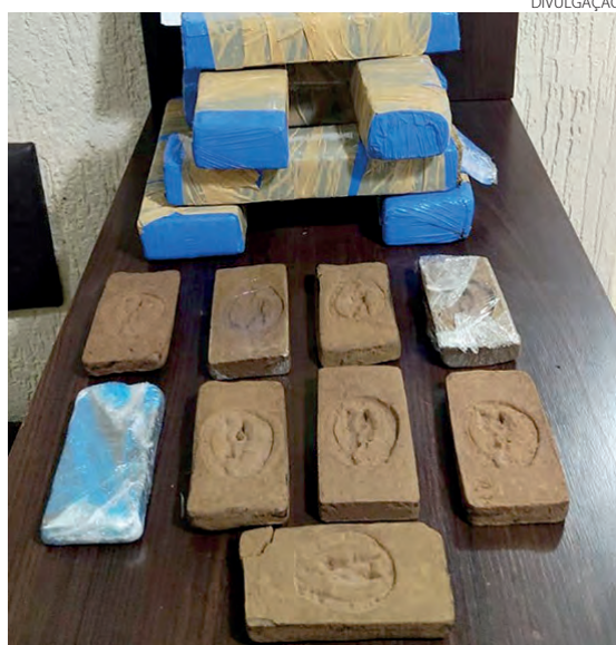
Homem levaria a droga até União da Vitória

Os policiais conseguiram realizar a abordagem do suspeito, e em revista ao veículo encontraram uma carga de vinhos oriundos da Argentina, sem o devido desembaraço aduaneiro. O condutor foi liberado após confecção do Boletim de Ocorrências, e a carga foi entregue a Receita Federal.