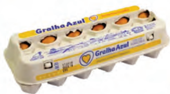
Ovos Vermelho Grelha Azul Dúzia