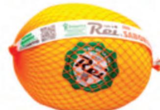
Melão Rei Kg