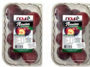
Ameixa Nova Campo Belo Bandeja 600g