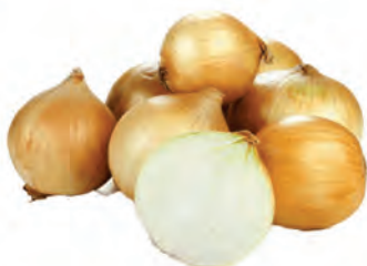
Cebola Nacional Kg