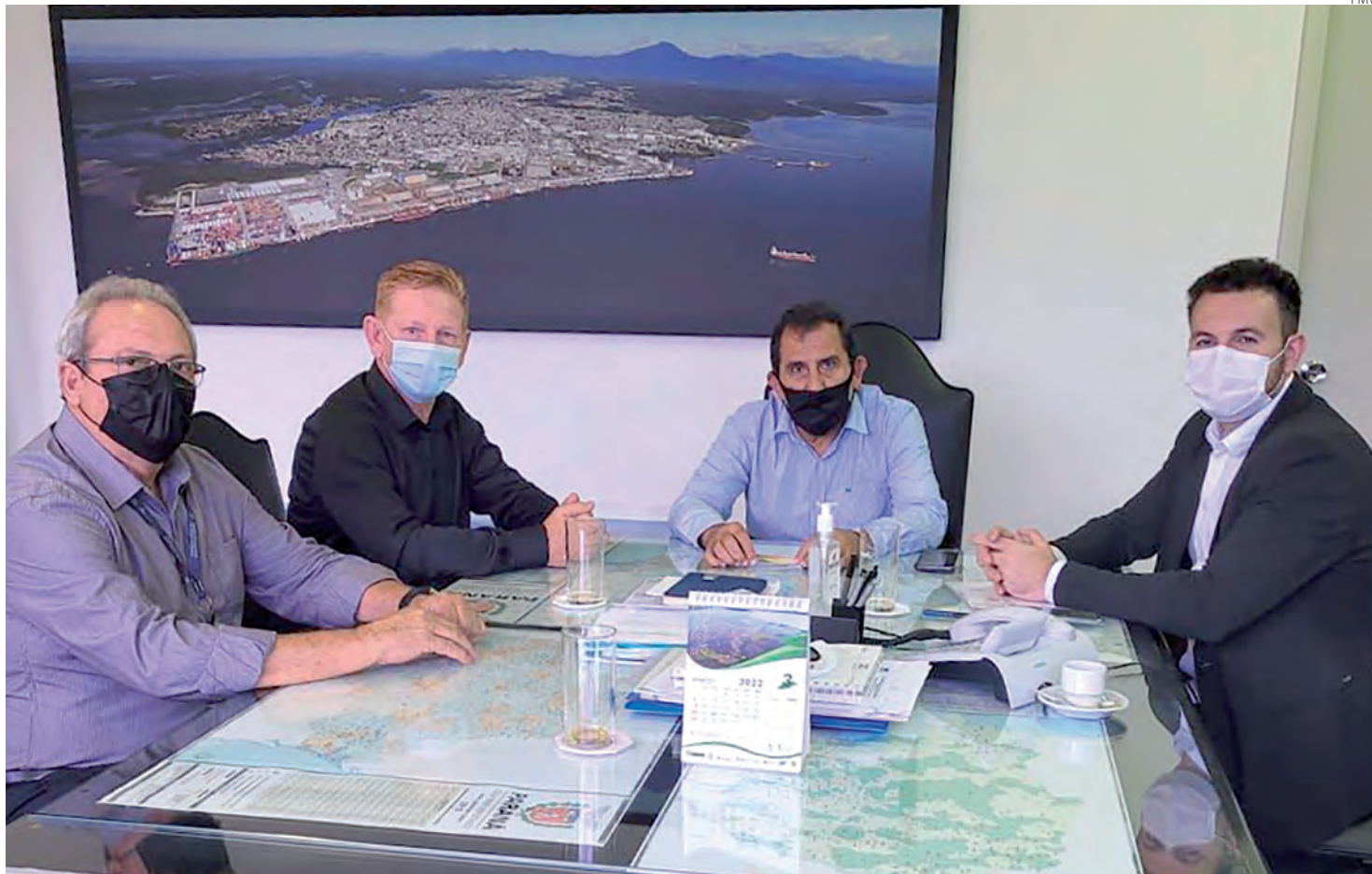
Vottri conversou com lideranças estaduais sobre demandas de Vitorino