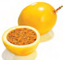
Maracujá Azedo Kg