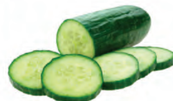
Pepino Salada Kg