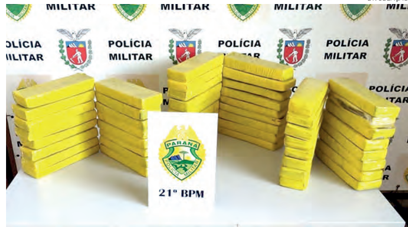
A droga estava nas bagagens de um rapaz em um ônibus

Um carro carregado com mais de 100kg de maconha foi apreendido por policiais militares