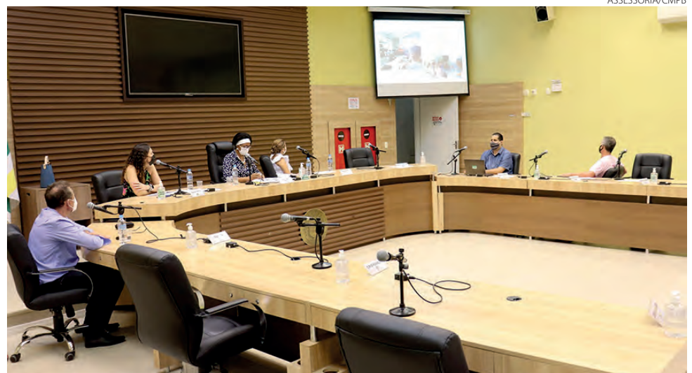
As audiências públicas foram realizadas no plenário da Casa de Leis

A Secretaria Municipal de Assistência Social de Pato Branco promoveu na tarde de terça-feira (22), no Plenário da Câmara Municipal de Pato Branco, a Audi-