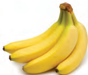
Banana Caturra Kg