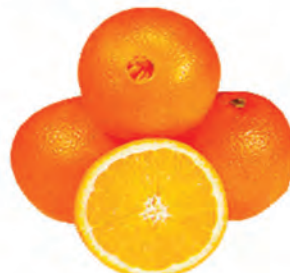
Laranja Bahia Importada Kg