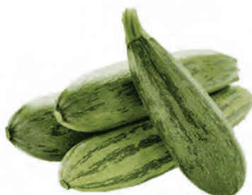
Abobrinha Verde Kg