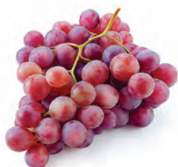
Uva Rosada Kg