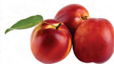
Nectarina Importada Kg