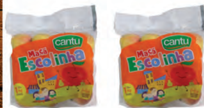
Maçã Escolinha Cantu 1Kg