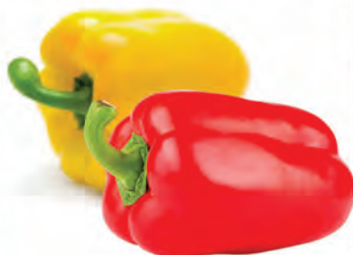
Pimentão Sol e Vermelho Kg