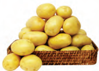
Batata Monalisa Kg