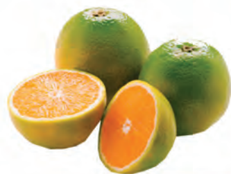
Laranja Pera Kg