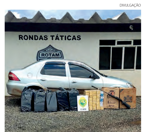
Foram retirados de circulação mais de 400 maços de cigarros e um rifle

Em continuidade as buscas aos arredores de uma mata na rua Primo Zeni, em Coronel Vivida, a equipe PM visualizou uma residência com as portas abertas e no chão, na parte externa, havia uma carteira com documentos e um celular. Nenhum morador foi encontrado no local, porém no interior da residência foi localizado um rifle de calibre 22, com numeração suprimida, silenciador e carregador com dez munições e mais 38 cartuchos do mesmo calibre. Arma e munições foram apreendidas e encaminhadas para os procedimentos da Polícia Civil. (AB com assessoria)