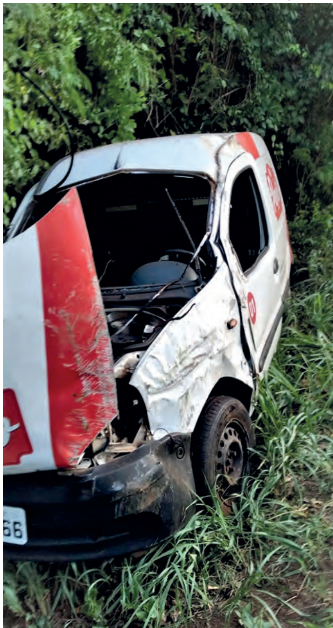
O motorista do Renault/Kangoo morreu no local do acidente