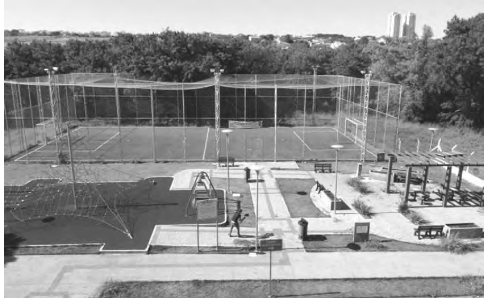
“Meu Campinho” construído no município de Maringá