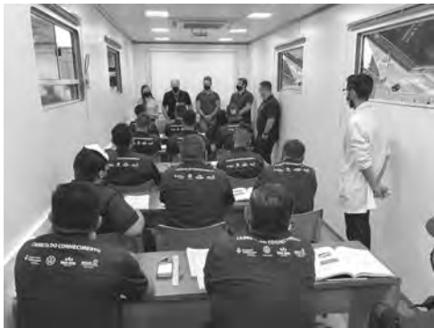
Ao final do curso serão 54 novos mecânicos industriais no município

O programa do Governo do Estado em parceria com a Volkswagen e o Senai-PR, vai oferecer gratuitamente, 1.884 vagas para cursos profissionalizantes em 30 municípios do Paraná, Palmas é um dos municípios que participará do programa, recebendo o curso de Mecânica Industrial.