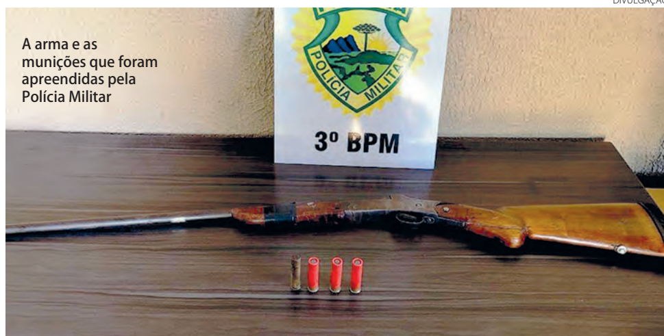
A arma e as munições que foram apreendidas pela Polícia Militar

Colabore com o trabalho da Polícia Militar. Denuncie ligando 181, 190, ou baixe o APP 190 no Play Store. Sua identidade será preservada. (AB)