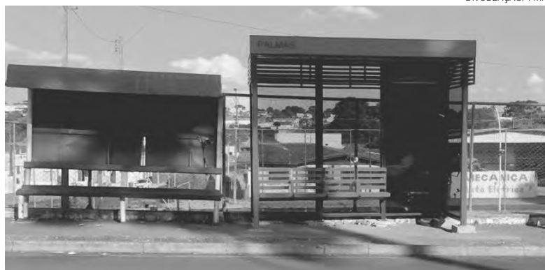
Ponto de ônibus antigo e o novo modelo instalado

Com investimento de R$ 800 mil, Município adquiriu 30 pontos de ônibus que estão sendo espalhados por locais estratégicos