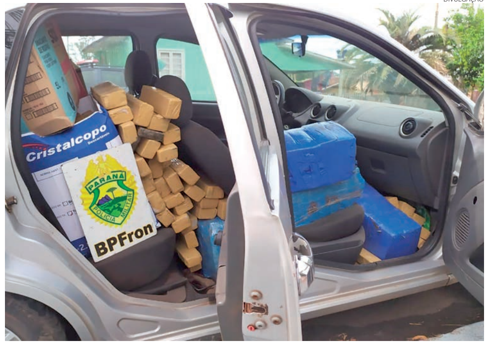
A maconha estava sendo transportada para Novo Hamburgo (RS)

As equipes policiais realizaram buscas nas imediações, mas não encontraram nenhum suspeito. A maconha foi apreendida e encaminhada à Delegacia da Polícia Federal de Guaíra.