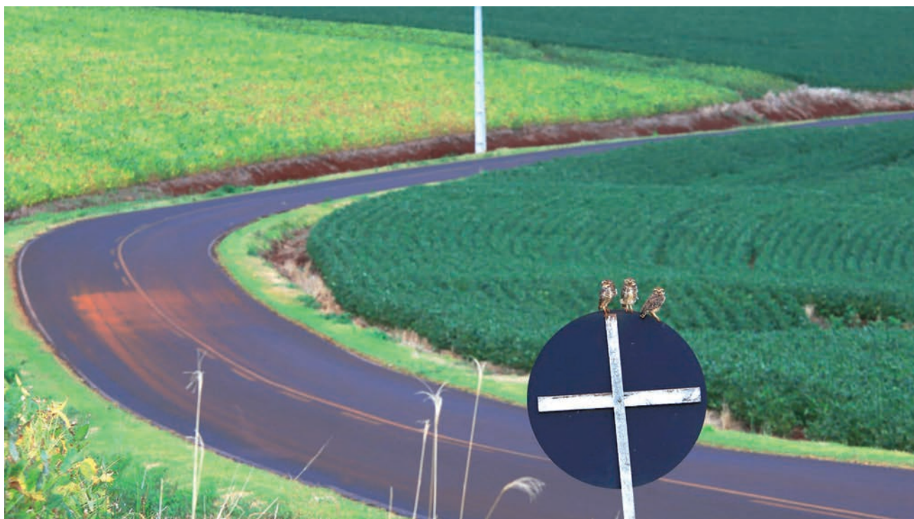
O fotógrafo Rodinei Santos registou nessa terça-feira (4), uma família de corujas