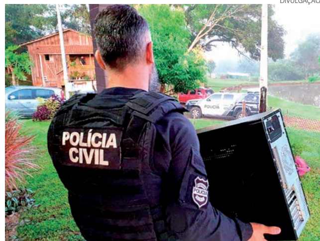
As ações têm como foco principal a desarticulação de organizações criminosas

operação de repressão qualificada foi a que resultou na prisão de 41 integrantes de organização criminosa responsável por aplicar golpes do falso empréstimo, gerando vítimas em todo o Brasil.