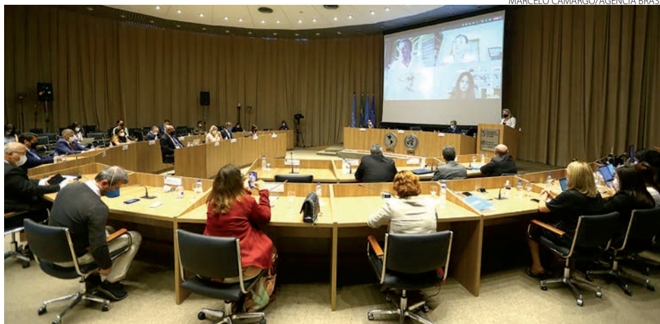
Ministério da Saúde deve anunciar hoje seu posicionamento