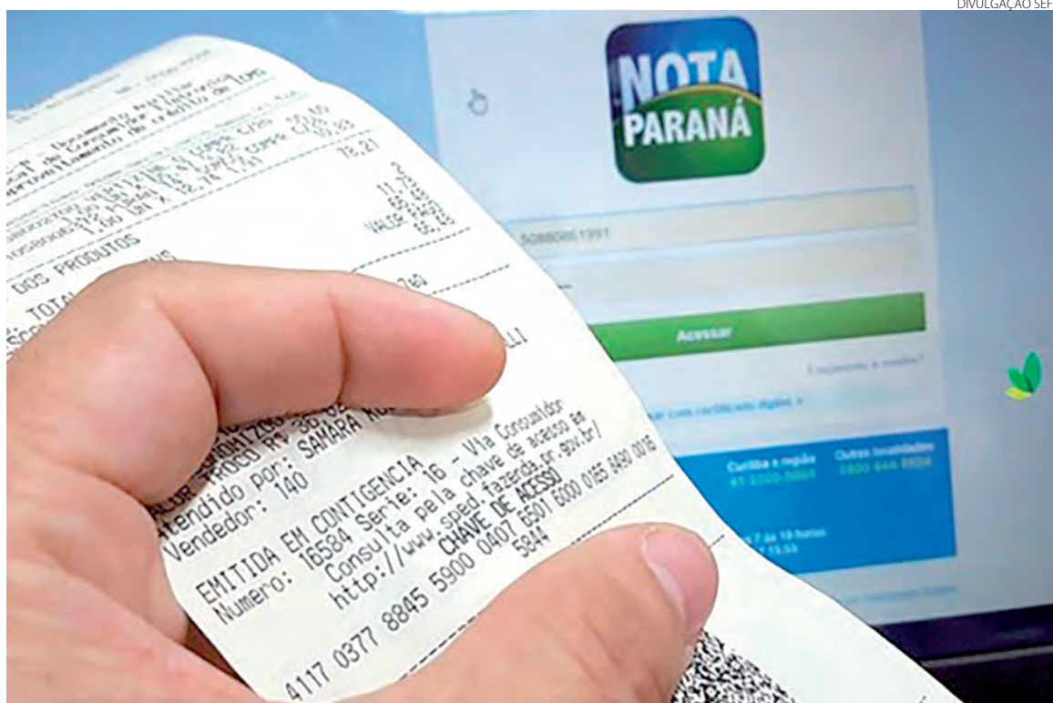
Dinheiro devolvido vem de parte do ICMS pago pelo contribuinte que colocou CPF na Nota e, também, de prêmios mensais