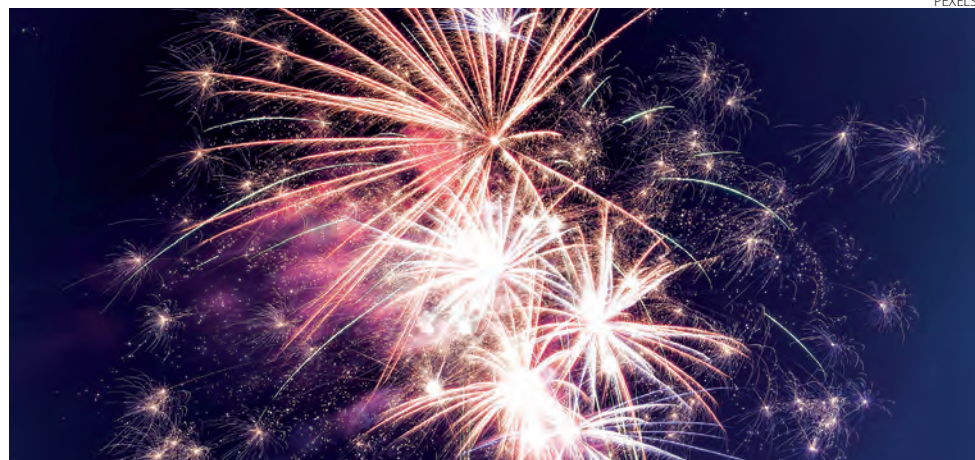
Chiaparini informa que grande parte do material com estampido é adquirida para ser utilizada em locais mais reservados

Conforme a Lei, são proibidos os fogos de vista com estampido; os de estampido; os foguetes, com ou sem flecha, de apito ou de lágrimas, com bomba; as baterias; os morteiros com tubos de ferro; rojões; e demais fogos de artifício que contenham acima de 25 centigramas de pólvora, por peça, em eventos de qualquer natureza, em que a Prefeitura de Pato Branco seja promotora ou tenha qualquer tipo de participação, parceria ou colaboração; e em eventos realizados em espaços públicos e privados, independentemente de serem fechados, como edificações, ou abertos, como vias públicas ou praças.