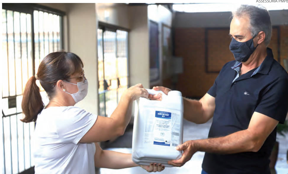
Representantes das 33 comunidades rurais de Pato Branco receberam o bioinseticida