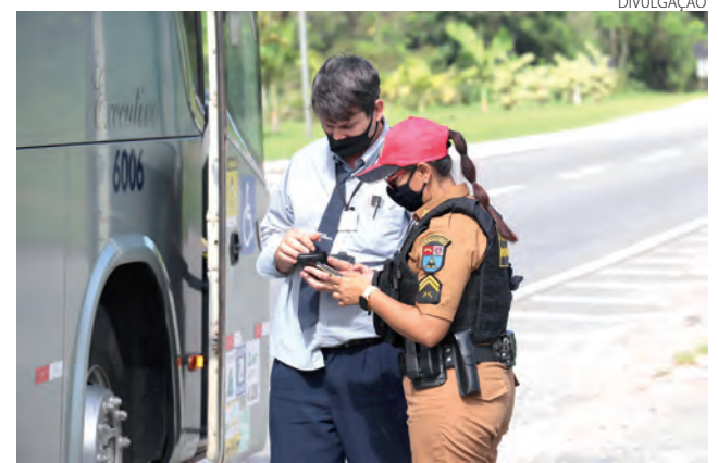
Mais de 160 acidentes foram atendidos pelas policiais rodoviárias no estado

Foram registradas 406 ultrapassagens irregulares durante o feriado, representando mais de quatro flagrantes por hora de operação. Esse tipo de ultrapassagem é responsável pela maioria dos aciden-