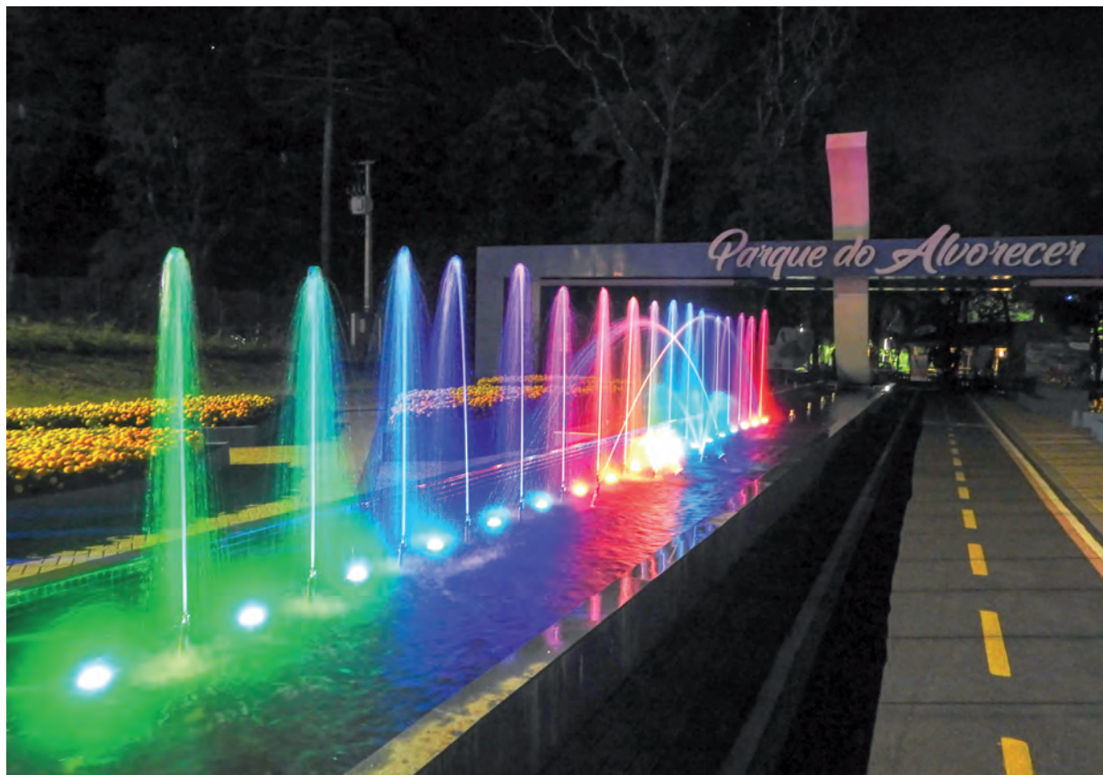
Vilson Bonetti fez este belo registro do Parque do Alvorecer