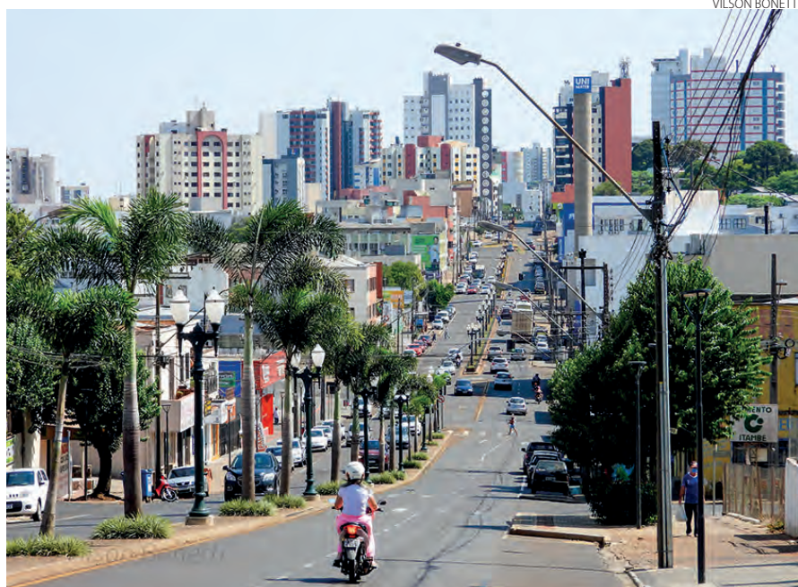
Avenida Tupi, na região da Baixada Industrial, em Pato Branco, na manhã de quinta-feira (17). Ao fundo os edifícios da região central