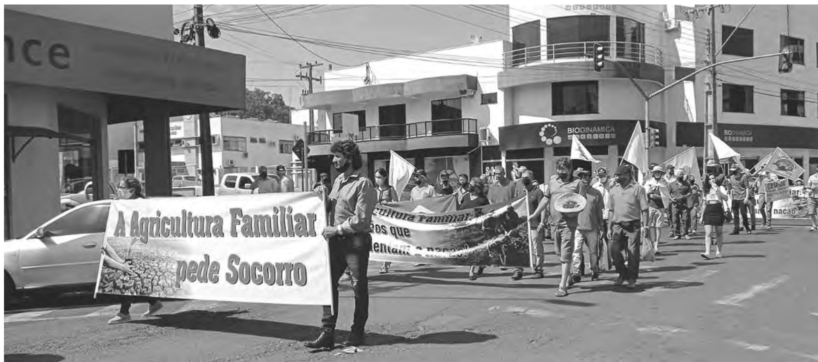
Centenas de agricultores participaram de ato em Coronel Vivida

O principal objetivo desta mobilização é sensibilizar o governo para que no-