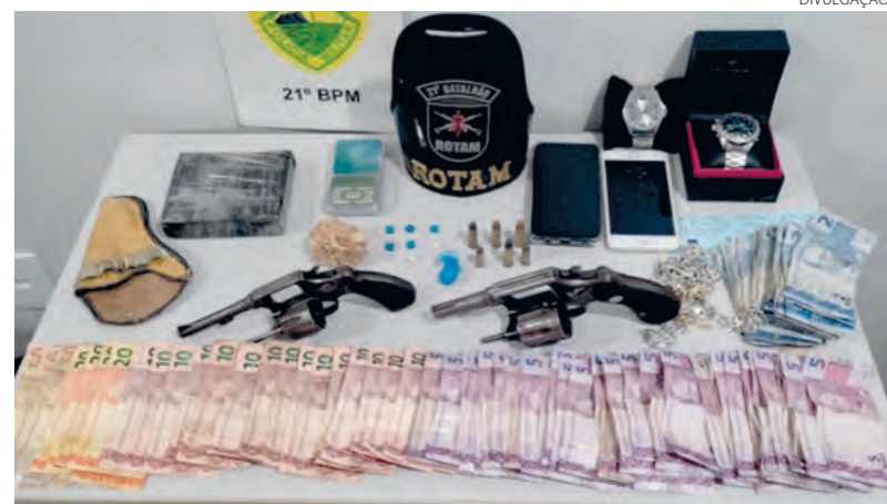
As drogas, dinheiro e demais objetos apreendidos em Dois Vizinhos

Outra apreensão de drogas ocorreu quarta-feira à noite no bairro Alto da Glória, em Itapejara D'Oeste. A Polícia Militar abordou uma Parati, ocupada por dois homens, sendo que o passageiro es-