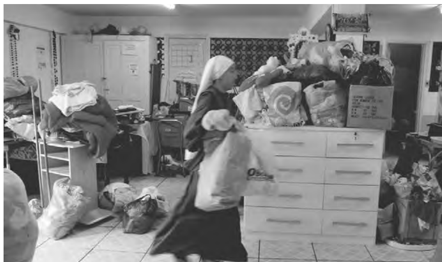
Entidades recebem donativos para atendimento as vítimas

Os bairros mais atingidos foram Quitandinha, Alto da Serra, Castelânea, Centro, Coronel Veiga, Duarte da Silveira, Floresta, Caxambu e