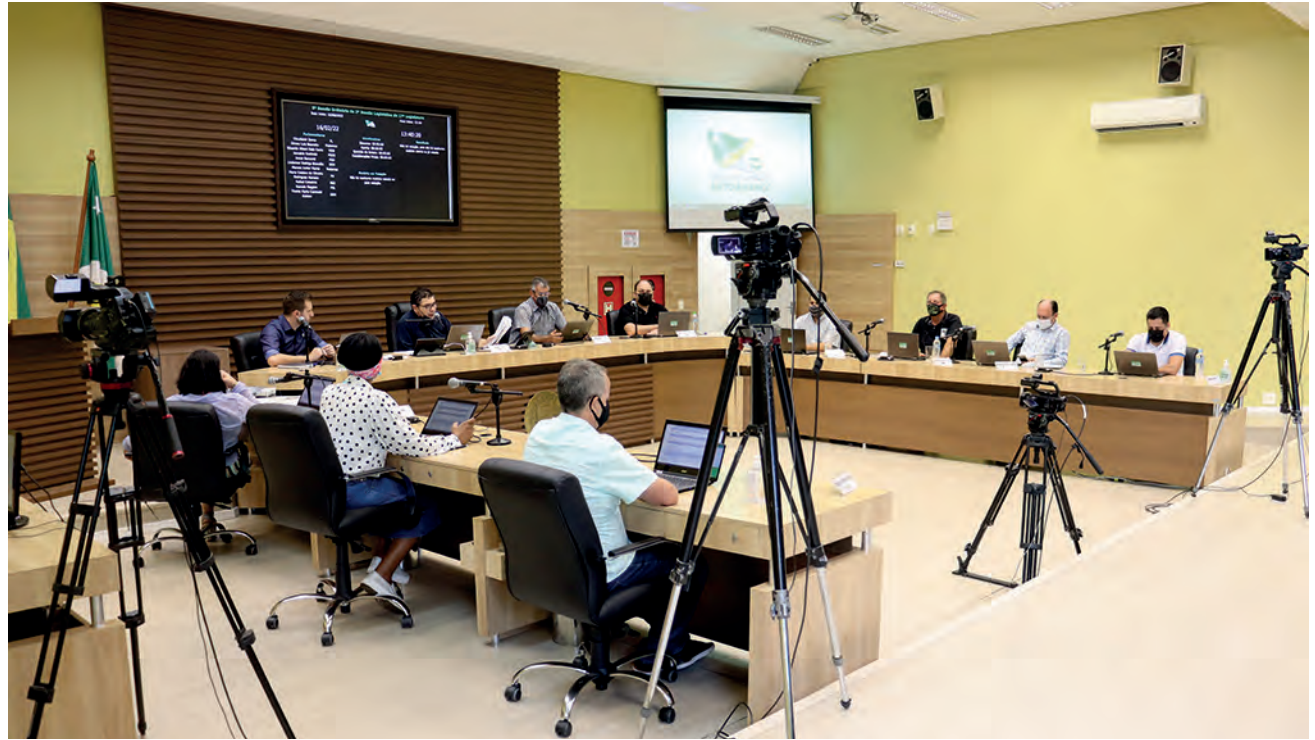
O Requerimento nº 96 de 2022 foi apresentado na sessão de quarta-feira (16)