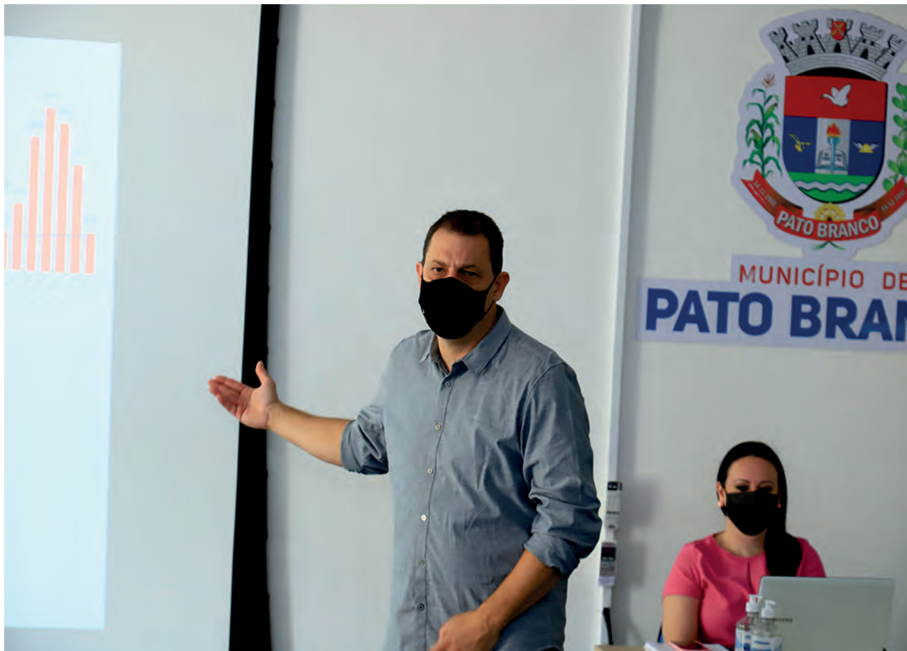
Dados de queda de contaminações contribuíram para a decisão de desmobilização da central de testagem do Dolivar Lavarda

Esta sexta-feira (18), será a última data que o centro de testagem do Dolivar Lavarda atenderá a população, após sua desmobilização, os testes disponibilizados pelo Município passam a ser realizados apenas na Unidade de Pronto Atendimento (UPA), por sua vez, os servidores que estavam atuando naquela unidade de testagem vão retornar aos atendimentos em seus seto-