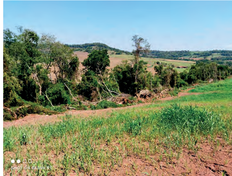
Uma das áreas em que foi constatado crime ambiental

cola (Capanema) será apreendida quando da sua colheita para doações a entidades assistenciais. Além das medidas administrativas, os autores responderão criminalmente pelo ato e em ação civil pública com vistas a recuperação da área, sendo que em ambas as situações caberão, de acordo com o entendimento da justiça, a aplicação além da pena, a de multas pecuniárias. (Assessoria)