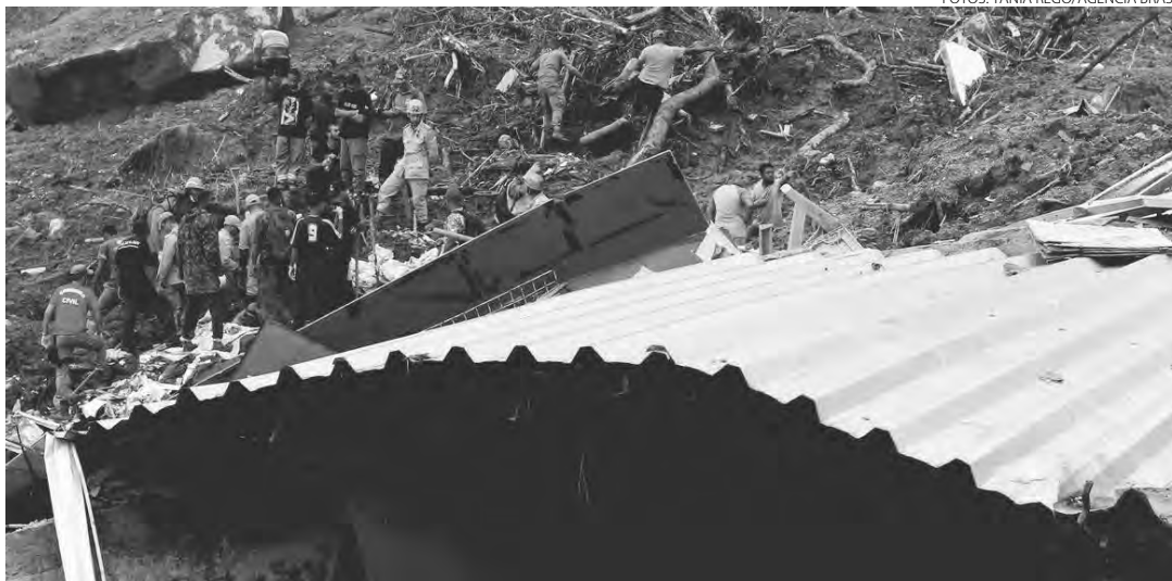
Moradores buscam sobreviventes dos deslizamentos