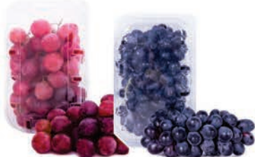
Uva Red Globe e Vitória Bandeja 500g