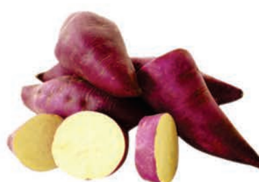
Batata Doce Roxa Kg