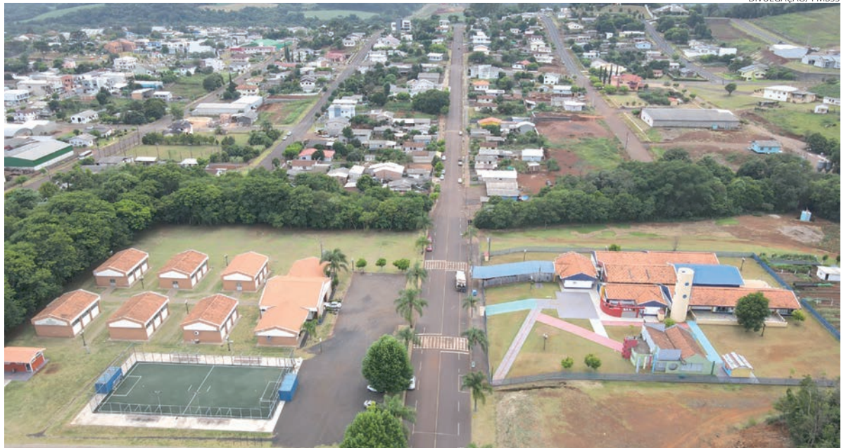
Área onde será construída a nova escola