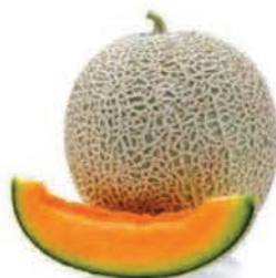
Melão Orange Cantaloupe Kg