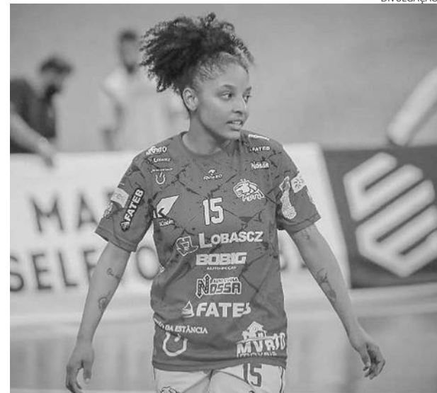
A ala Kawane Pelé chega para ajudar as Patinhas na busca por títulos

A Unidep Futsal também vai valorizar as jogadoras de Pato Branco e região, que serão avaliadas em seletivas de 24 a 28 de janeiro, categorias Sub-11, Sub-13, Sub-15, Sub-17, Sub-20 e adulta. As equipes de base da Unidep vão disputar o Campeonato Paranaense em várias categorias, entre elas, a Sub-20.