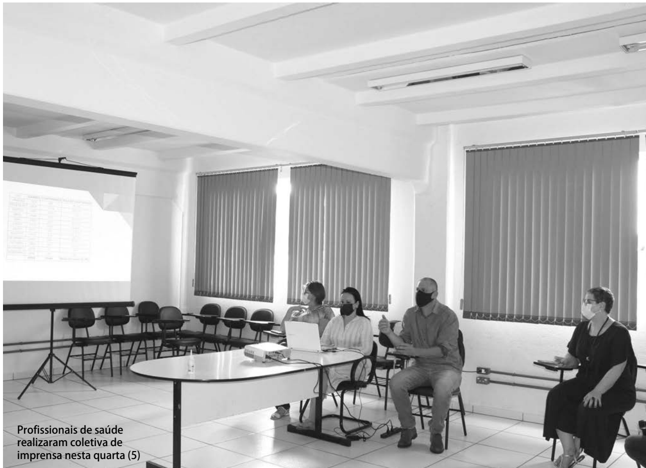
Profissionais de saúde realizaram coletiva de imprensa nesta quarta (5)

Nelson da Luz Junior nelson@diariosudoeste.com.br