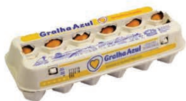
Ovos Vermelho Gralha Azul Dúzia