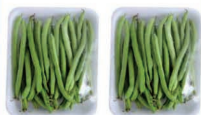
Vagem Lotti Bandeja 300g