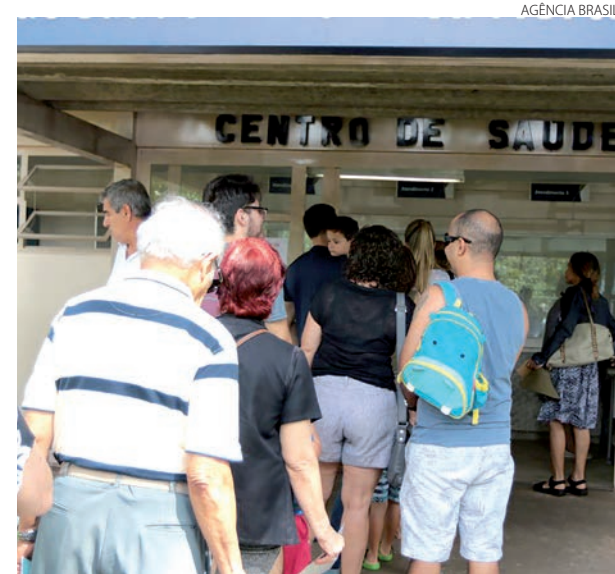
Em alguns bairros os estoques já estão zerados

Nesta semana, a Secretaria de Saúde reconheceu que há aumento no número de casos de gripe no DF, mas considera a situação controlada, descartando que haja surto da doença em Brasília.