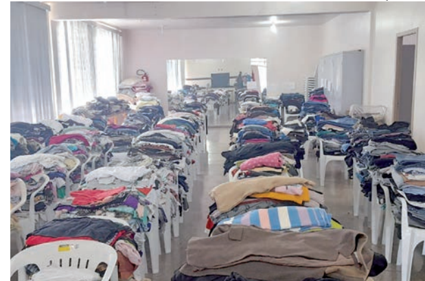
Roupas arrecadas em campanha beneficente organizada pelas secretarias de Assistência Social e Meio Ambiente de Clevelândia