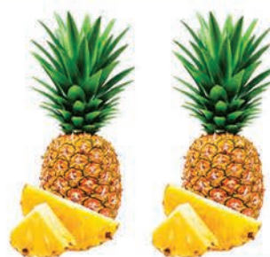
Abacaxi Hawai Tradicional Unid.