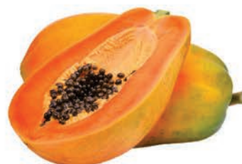
Mamão Papaya Kg