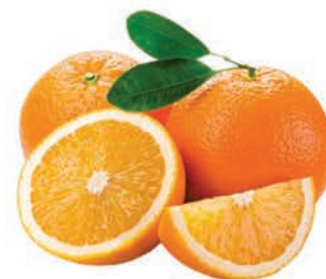
Laranja Bahia Importada Kg