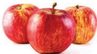
Maçã Fuji Kg