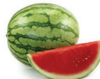
Melancia Tradicional Inteira Kg