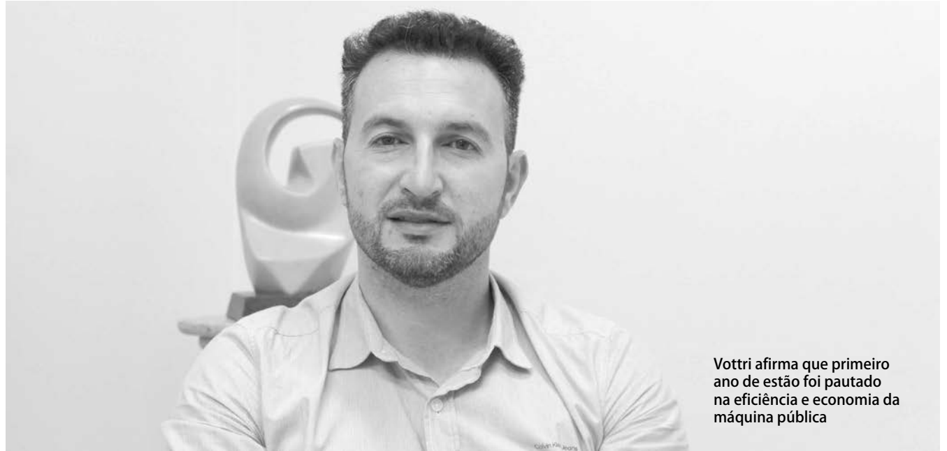
Votri afirma que primeiro ano de gestão foi pautado na eficiência e economia da máquina pública